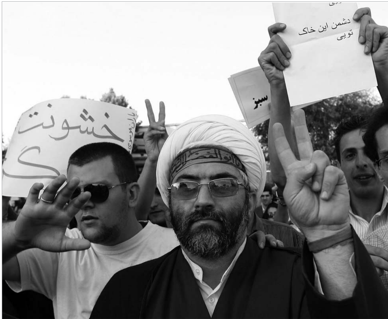
ირანში საპროტესტო გამოსვლები არ წყდება

მიუხედავად იმისა, რომ ოთხშაბათის ხალხმრავალმა მიტინგმა პოლიციისთან შეტაკებების გარეშე ჩაიარა, ოპოზიცია ვარაუდობს, რომ მომავალ მიტინგზე აშმადინეჯადის ხალხი პროვოკაციის მოწყობას შეეცდება, რათა შემდეგ