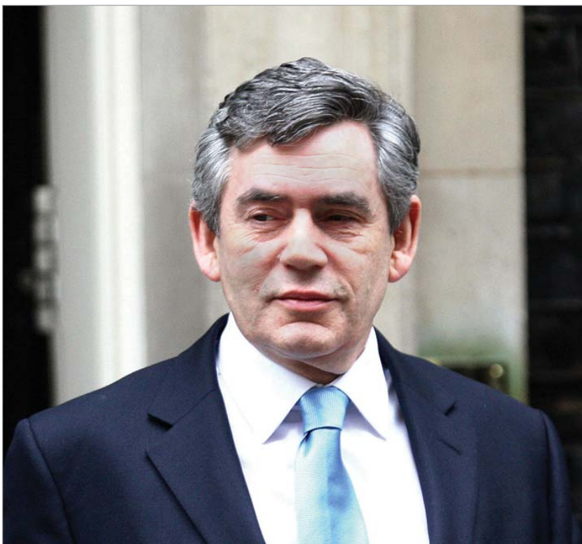
გორდონ ბრაუნმა თანამდებობა შეინარჩუნა

ზოგიერთმა დეპუტატმა იმ ფულის დაბრუნება გადაწყვიტა, რომელიც ბიუჯეტიდან სხვადასხვა მიზნებისთვის მიიღო. დაბრუნებული თანხამ, საბოლოო ჯამში, 300 ათას გირვანქა სტერლინგზე მეტი (დაახლოებით, 480 ათასი დოლარი) შეადგინა. თემთა პალატის