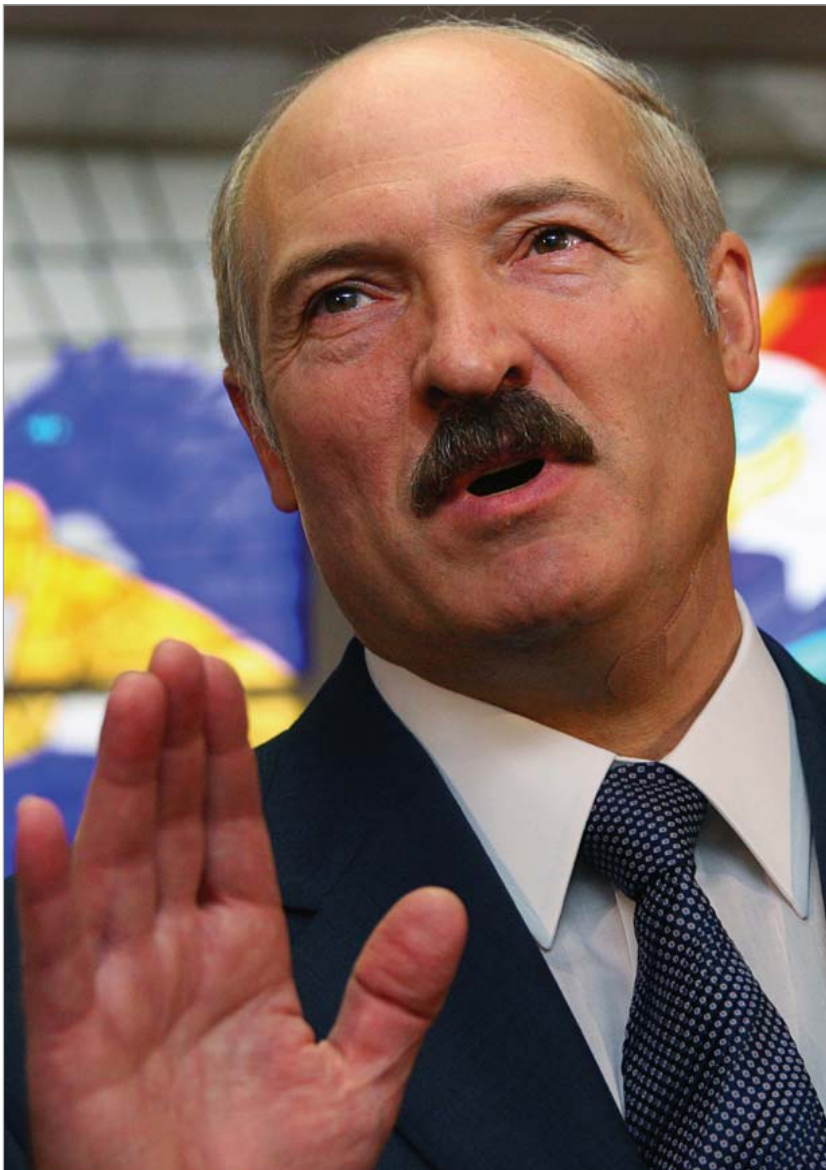
ლუკაშენკო ოპოზიციას ქვეყნის მტრებს უწოდებს

ბელარუსის ოპოზიციის აზრი იმ საკითხში იყოფა, შესაძლებელია თუ არა ქვეყანაში არსებული რეჟიმის დემოკრატიზაცია არსებულ საგარეო პოლიტიკურ პირობებში. ამაზე კოზულინის მსგავსი პოზიცია აქვს ევროპული კოალიციის" კოორდინატორ ნიკოლაი სტატკევიჩს. არსებობს ზოგი პოლიტიკური სტრუქტურა, სადაც მიაჩნიათ, რომ ევროპას შეუძლია ლუკაშენკოს დარწმუნება, რომ დემოკრატი გახდეს," - განმარტავს ის. ამ შესხედულების მონი-