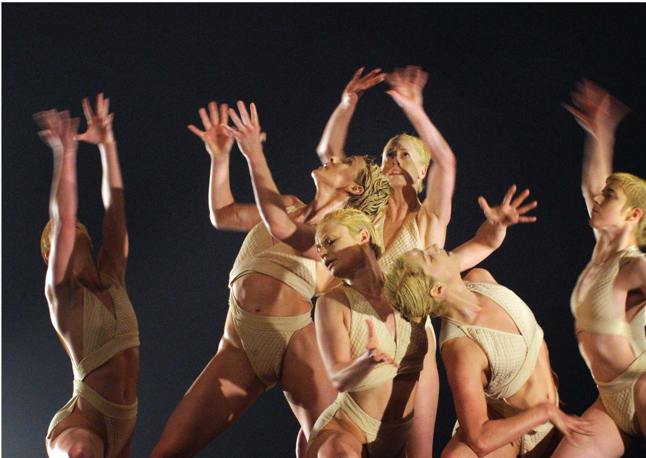
ნორვეგიის თანამედროვე ცეკვის დასი Carte Blanche ევროპულ ტურნეს მართავს. ამჯერად დასი სპექტაკლ Killer Pig-ს წარმოადგენენ, რომლის მთავარი ქორეოგრაფიც შარონ ეიალია. გერმანიაში მიმდინარე ფესტივალ Ludwigsburg-ზე Carte Blanche ვარსკვლავის სტატუსითაა მიწვეული.