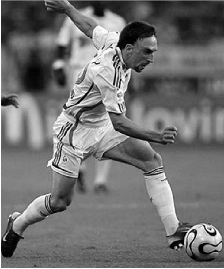
რიბერი რეალს შეუერთდება

მოთამაშის ტრანსფერზე საბჭოს ნებართვა საერთოდ არ არის საჭირო.