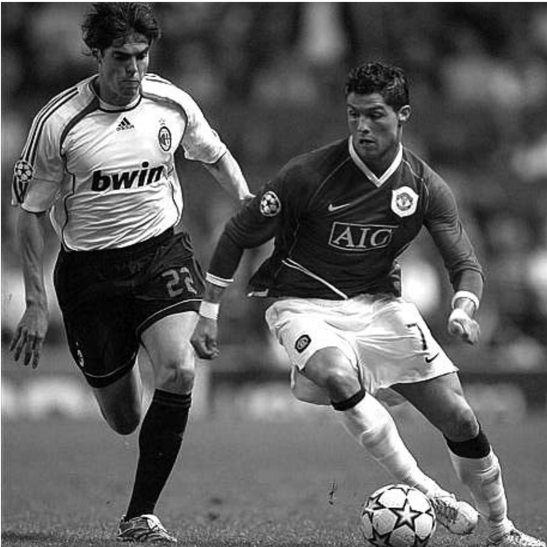
ეს ორი ვარსკვლავი ახლა უკვე ერთი გუნდისთვის გაირჩება

ამ კითხვაზე პასუხის მისაღებად ფეხბურთელის განვლილი წლების სტატისტიკას გადავხედოთ. ბოლო სამი სეზონის განმავლობაში რონალდუ პრემიერლიგაში მუდამ ბომბარდირთა შორის იყო და ამ მაჩვენებლით მეორე ადგილზე ქვევით არ ჩამოსულა. საშუალოდ თამაშში ერთნახევარი გოლი გააქვს, რაც მას პრემიერლიგის ყველა დროის საუკეთესო ბომბარდირთა რიგში აყენებს. ბოლო სამი სეზონში რონალდუს ანგარიშზეა მანჩესტერის მიერ გატანილი ყველა გოლის 28 პროცენტი.