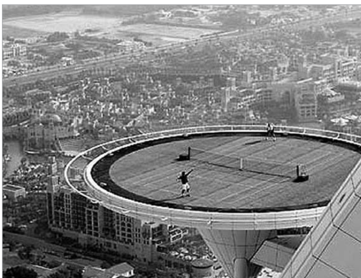
ჩოგბურთის მამებმა ჩანს, რომ თამაშების წინააღმდეგ გაილაშქრეს

სულ ცოტაც და, საჩოგბურთო სამყარო უიმბლდონის ტურნირს მიაპყრობს მზერას. მანამდე კი ჩოგბურთელები სეზონის მესამე დიდი სლემის ტურნირისთვის ემზადებიან. ATP-ს ხელმძღვანელობას კი, როგორც ჩანს, ბლომად აქვს საქმე. ჩანს, თამაშებზე აქამდეც ბევრს საუბრობდნენ, თუმცა ჯერჯერობით თითქმის ვერაფერს დაუმტკიცეს თამაშის ჩაშვება. ახლა კი ახალი სკანდალი აგორდა. ბრიტანულ გამოცემა The Independent-ის ცნობით, ATP-ს ხელმძღვანელები იძიებენ 12 ჩოგბურთელის საქმეს, რომლებიც გარიგებულ მატჩების გამართვაში არიან ეჭვმიტანილი. ჩოგბურთელების გვარები არ სახელდება, თუმცა ცნობილია, რომ 12 ჩოგბურთელში არიან რუსები, იტალიელები და ესპანელები.