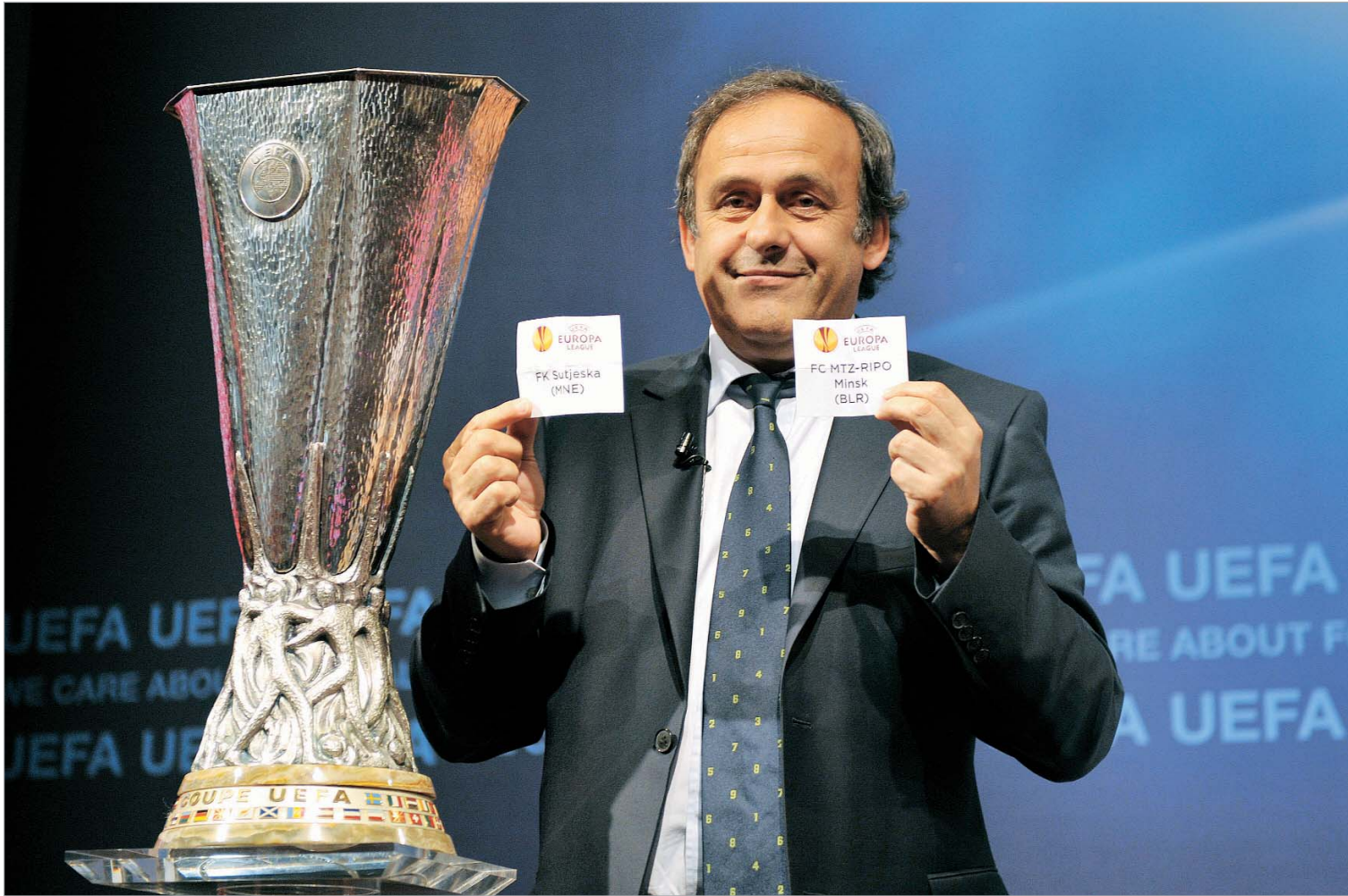
მიმელ პლატინიმ ნილი გვიყვარს.