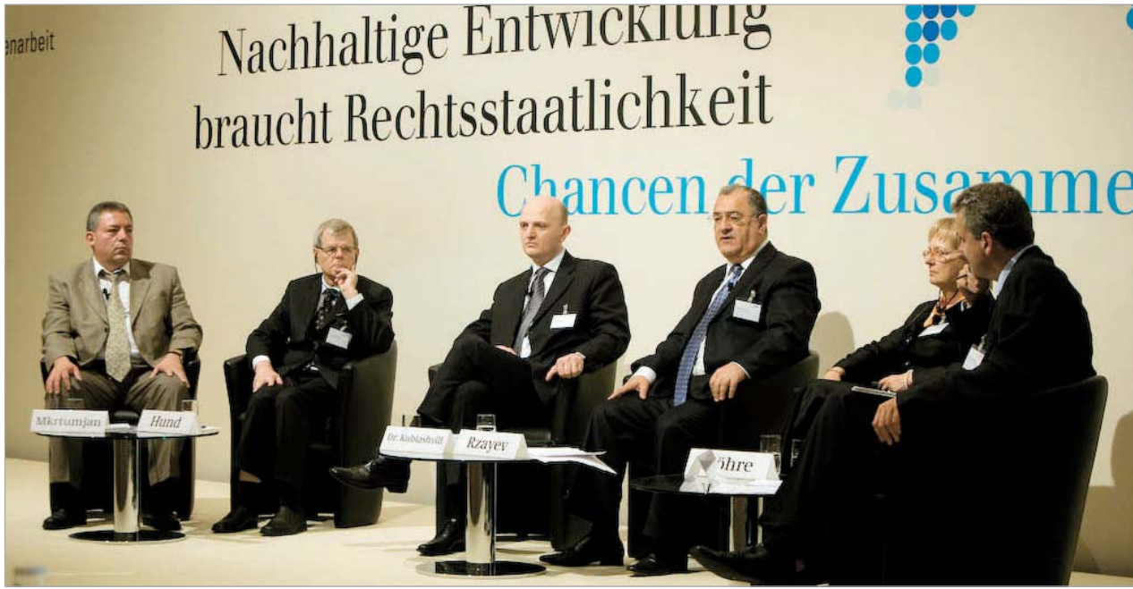
საქართველოს უზენაესი სასამართლოს თავმჯდომარე ბერლინის კონფერენციაზე.

ბერლინში გამართულ კონფერენციაზე სომხეთის, აზერბაიჯანის, საქართველოსა და უკრაინის იუსტიციის მინისტრები, უზენაესი სასამართლოს თავმჯდომარეები და მაღალი რანგის თანამდებობის პირები გერმანელ ექსპერტებსა და სპეციალისტებს შეხვდნენ. კონფერენციის "სტაბილური განვითარება საჭიროებს სამართლებრივ სახელმწიფოს - თანამშრომლობის შანსები" ინიციატორი იყო ეკონომიკური თანამშრომლობისა და განვითარების ფედერალური სამინისტრო, რომლის დავალებითაც გერმანიის ტექნიკური თანამშრომლობის საზოგადოებამ (GTZ) ღონისძიება მოაწყო.