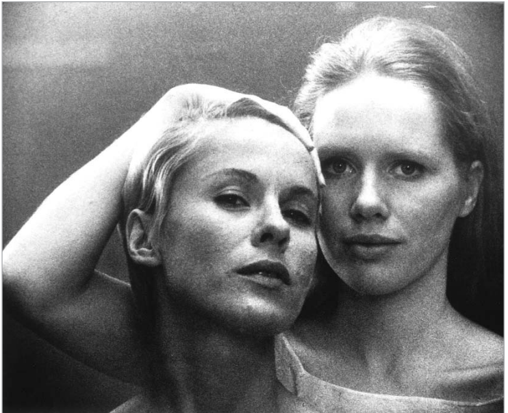
კადრი ბერგმანის ფილმიდან "პერსონა".

რეტროსპექტივაზე სულ ხუთი ფილმი იქნება წარმოდგენილი: 29 ივნისის 1951 წელს გადაღებულ "ზაფხულის თამაშებს" ნახავთ. ფილმი რეჟისორმა თავისივე მოთხრობა "მარის" მიხედვით გადაიღო, მარი კი ახალგაზრდა ბალერინაა, შეყვარებული გოგონა, რომელიც დაკარგული სიყვარულის შესახებ მრავალი წლის შემდეგ კიდევ ერთხელ იხსენებს. მოხეტიალე ცირკის მსახიობების ცხოვრებას აღწერს 1953 წლის