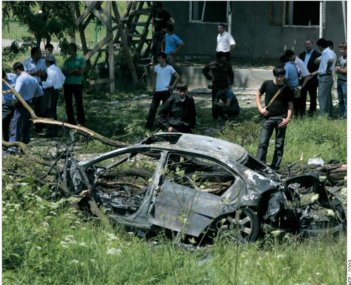
თავდასხმისთვის გამოყენებული მანქანა მოსკოვში აღმოჩნდა გატაცებული.