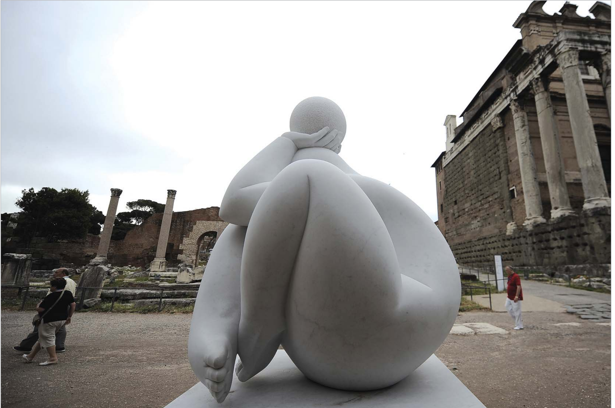
რომის იმპერიის პერიოდის პოლიტიკური, სოციალური, რელიგიური და კულტურული ცენტრის, რომის ფორუმის ისტორიულ ტერიტორიაზე კოსტა რიკელი მოქანდაკე ხიმენეს დერედის გამოფენა La Rota de la paz გაიხსნა. წარმოდგენილი ნამუშევრები ფორუმის თითქმის მთელ ტერიტორიაზე გაბნეული და დამთვალეიერებელთა დიდი მოწონებით სარგებლობს. როგორც რომის ფორუმის კომპლექსის დირექცია აცხადებს, მსგავსი გამოფენები ისტორიულ ადგილებში ტურისტების მოსაზიდად საუკეთესო საშუალებაა.