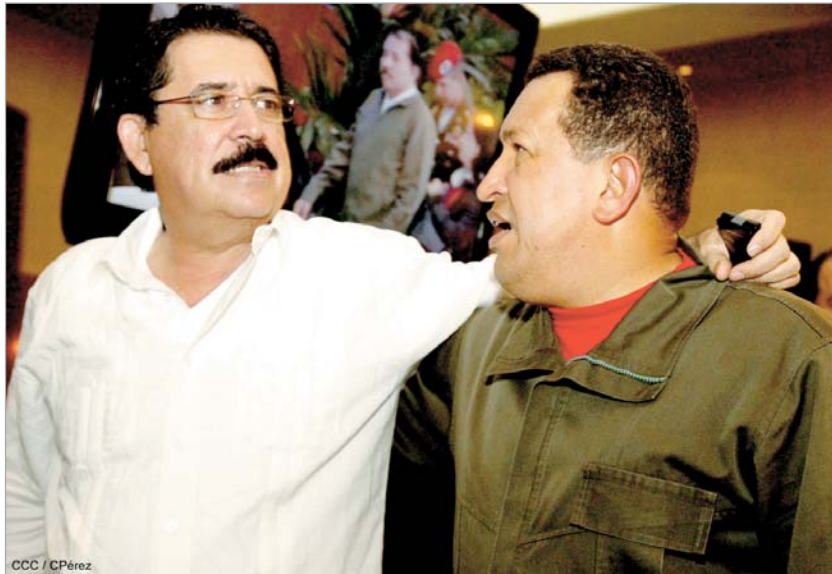
მანუელ სელაია უკო ჩავესთან ერთად

მიერ ჩამოგდებულად მიიჩნევს. როგორც ირკვევა, პრეზიდენტის რეზიდენციას რამდენიმე ათეულმა ჯარისკაცმა შემოარტყა ალყა, მათ იქ შეკრებილი პრეზიდენტის ზუთასიოდე მხარდამჭერის წინააღმდეგ ცრემლსადენი გაზი გამოიყენეს. ახლა პრეზიდენტის რეზიდენციას 60 პოლიციელი იცავს. თუმცა სელაიას დაპატიმრების საქმე მთლად ასე მარტივად არ არის. ჰონდურასის უმაღლესმა სასამართლომ განაცხადა, რომ პრეზიდენტი მისი გადაწყვეტილებით გადააყენეს. სასამართლომ უკანონოდ გამოაცხადა ის რეფერენდუმი, რომელიც კვირას უნდა ჩატარებულიყო. ამ რეფერენდუმის წინააღმდეგ გამოდიოდა კონგრესიც და თვით სელაიას პარტიის წევრების მნიშვნელოვანი ნაწილიც. კონგრესმა საკუთარი სპიკერი რობერტო მიჩელეტი პრეზიდენტის მოვალეობის დროებით შემსრულებლად დანიშნა. ის სელაიას თანაპარტიული, მაგრამ ამავე დროს მისი ოპონენტიცაა. ორივენი "ლიბერალური პარტიის" წარმომადგენლები არიან. მიჩელეტიმ ქვეყანაში ორი ღამით კომენდანტის საათი შემოიღო. წინა კვირაში, ოთხშაბათს სელაიამ პოსტიდან გადააყენა ჯარების მთავარსარდალი და თავდაცვის მინისტრი, რადგან სამხედროებმა რეფერენდუმის მხარდაჭერა-