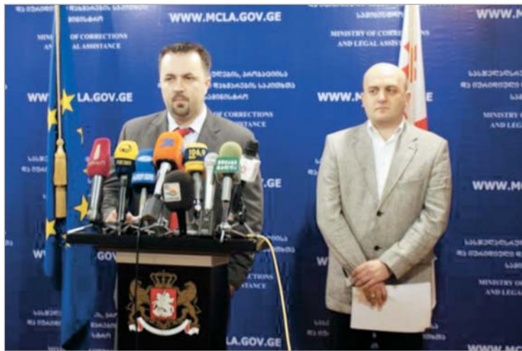
ბრიფინგი საკანონმდებლო ინიციატივაზე.

"პატიმრებს მიეცემათ არა მარტო სწავლისა და მუშაობის შესაძლებლობა, არამედ შეძლებენ, საკუთარი შრომით მიღებული ანაზღაურებით ოჯახებს დაეხმარონ ან დანაშაულები შექმნან," - აცხადებს