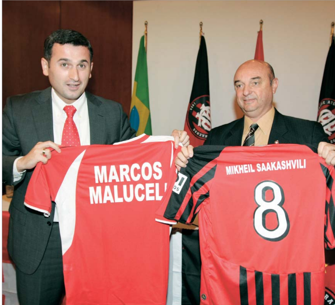
"პარანანენსეს" რამდენიმე ფეხბურთელი "ოლიმპი" ითამაშებს

კლუბი, რომელიც საქართველოსა და ბრაზილიას შორის საფეხბურთო ურთიერთობის პირველი ხიდის ფუნქციას იტვირთავს, არა მხოლოდ ბრაზილიური საზომებით, არამედ მთელი მსოფლიოს მასშტაბით გამორჩეულია ინფრასტრუქ-