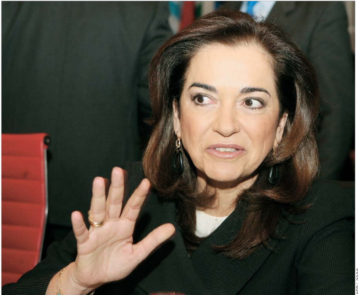
დორა ბაკოიანისმა კორფუს სამიტის შედეგებს საგაზეთო სტატია მიუძღვნა.