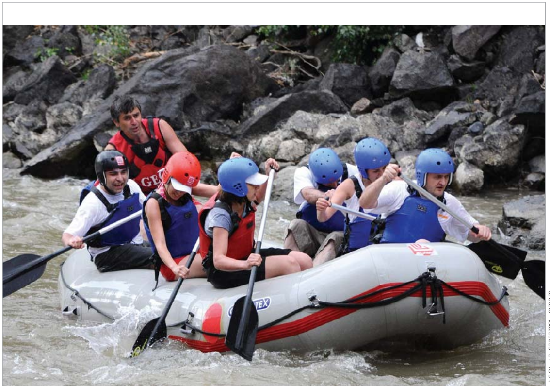
ესეც ჩვენ 24 საათელები

პროფესიიდან გამომდინარე, სხვათა საქმიანობისა თუ მიმდინარე მოვლენების გაშუქებით ვართ დაკავებული, მაგრამ არის სასიამოვნო გამოწვევებიც, როდესაც სხვა დროს რესპონდენტი კომპანია ჩვენთვის იცვლის და ამა თუ იმ დონისძიებაზე გვიხმობს როგორც მთავარ გმირებს. ასე რომ, წელიწადში რამდენჯერმე საკუთარ თავზეც გვიწევს რაღაცის თქმა. ლუკილის მიერ დაწესებულ მედია-ჯომარდზე, რომელშიც, 24 საათის გარდა, საკუთარ თავს ცდიდნენ ჟურნალ-გაზეთების კატეგორიიდან: Financial, ჯორჯია თუდი, კვირის პალიტრა, ავტო-ბილდი, Commercial, ინტერპრესნიუ-