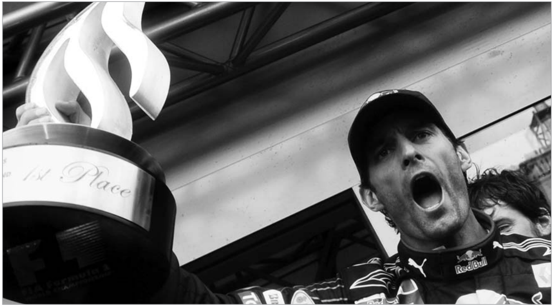
მარკ უებერმა გერმანიაში კარიერის პირველი გამარჯვება იხიმა

გერმანიის დიდი პრიზი ნიურბურგრინგი. 60 წრე. მანძილი: 5.148 კმ. დისტანცია: 308,863