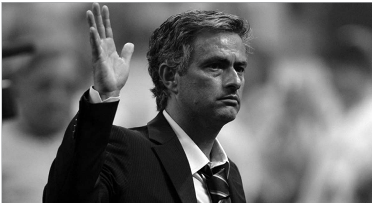
ყოზე მოურიჩიოს რეალი არ აშინებს

მილანის ინტერს სატრანსფერო ბაზარზე არ უაქტიურია და, როგორც ჩანს, არც აპირებს აქტიურობას. ნერაპურში მომავალი სეზონისთვის დაიწყო მზადება და, ცხადია, ყურადღების ცენტრშია მილანელთა პორტუგალიელი თავკაცი ყოზე მოურიჩიო, რომლის სამწვრთნელო კვალი ფიკაციაში ეჭვს ვერავინ შეიტანს. მოურიჩიო უდავოდ დიდი მწვრთნელია, თუმცა მას აქვს კიდევ ერთი თვისება, რომლის გამო მედიისთვის საყვარელ რესპონდენტად იქცა. პორტუგალიელი ყოველთვის ახერხებს რაიმე ორიგინალურის თქმას, რითაც ერთბაშად იქცევის ხოლმე ყურადღებას.