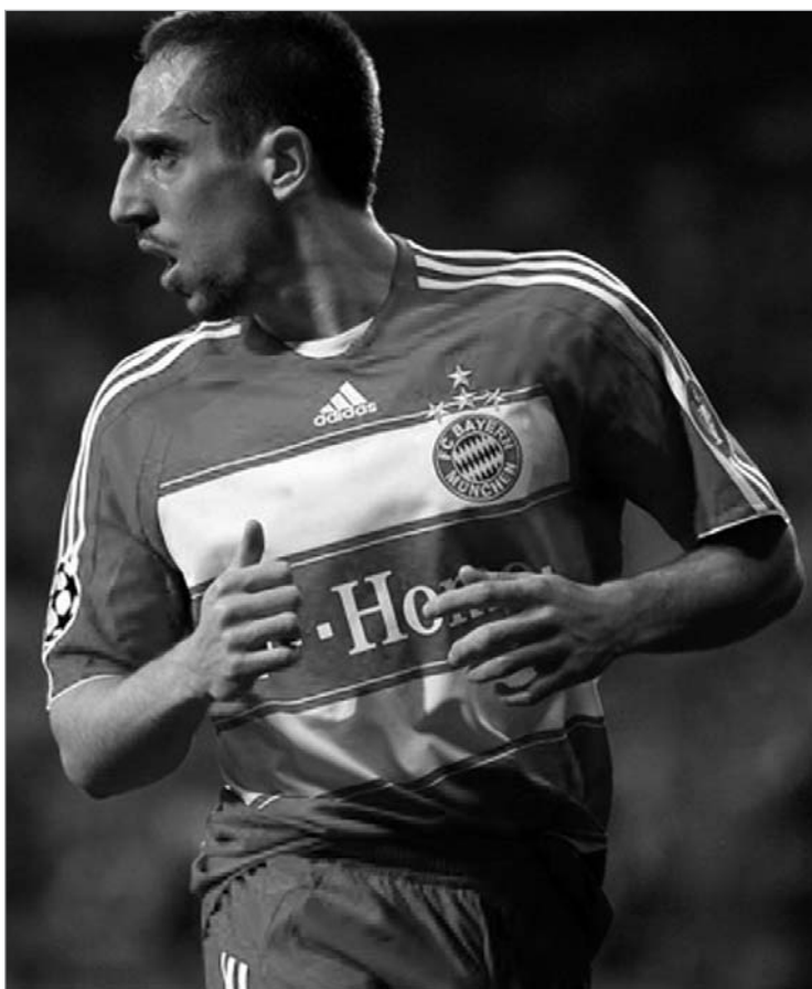
ფრენკ რიბერიში 80 მილიონს მხოლოდ მთვარეული თუ გადაიხდის

მა სატრანსფერო ბაზარზე შექმნილ ვითარებაზე ისაუბრა: ყველამ კარგად იცის, რომ ვითარება არანორმალურია. დაუშვებელია ფეხბურთელებზე ფასების ასეთი ზრდა, თანაც, მსოფლიო ეკონომიკური კრიზისის პირობებში. დარწმუნებული ვარ, ასე გაგრძელება არ შეიძლება. უახლოეს მომავალში ვითარება აუცილებლად შეიცვლება. ბოლოს და ბოლოს, ყველაფერი, რაც ხდება, უხამსობას ემსგავსება. მსოფლიოში ფინანსური კრიზისი მძვინვარებს, ხალხი უმუშევრად დარჩა, ზოგს ლუკმაპურის ფული არა აქვს, კლუბები კი ფეხბურთელებში 100 მილიონს იხდიან. თავად ფეხბურთელებს კი წელიწადში იმდენს აძლევენ, რომ ადამიანების უმეტესობა მთელი ცხოვრების განმავლობაში ვერ გამოიმუშავენ იმდენს, - აცხადებს ბეკენბაუერი.