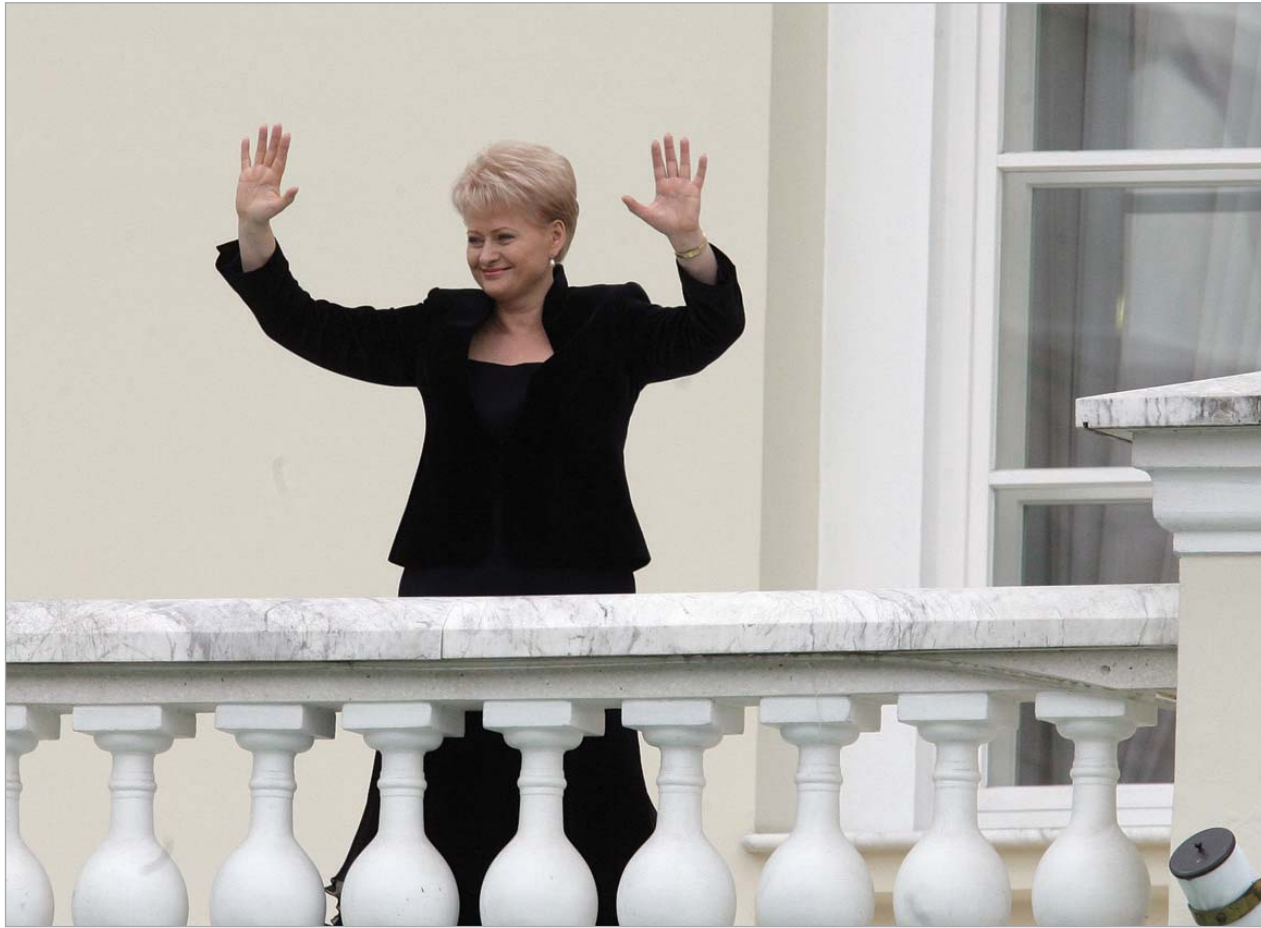
ლიტვის ახალი პრეზიდენტი დალია ბრიბაუსკაიტე

ლიტვის მთავარი საარჩევნო კომისიის ცნობით, ბრიბაუსკაიტეს მხარი დაუჭირა 950 407 ლიტველმა -