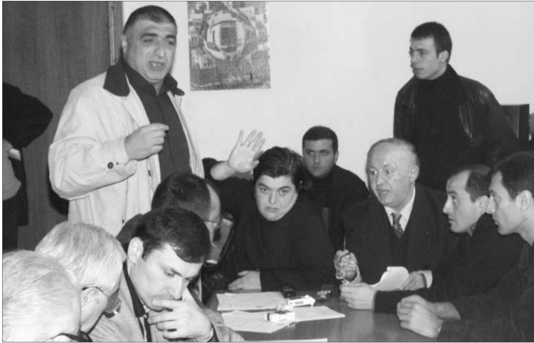
ასეთი იყო ვითარება ცესკო-ს სხდომაზე.