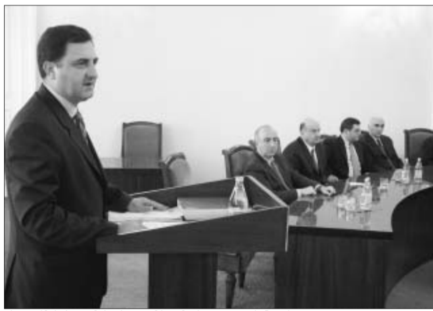
რეფორმების კომისიის თავმჯდომარე მადო ჭანტურია

განუხილ დახმარებისთვის უცხოელ კოლეგებს მადლობა მოახსენა უშიშროების საბჭოს მდივანმა თედო ჯაფარიძემაც: “აღნიშნული კონცეფცია უმნიშვნე-