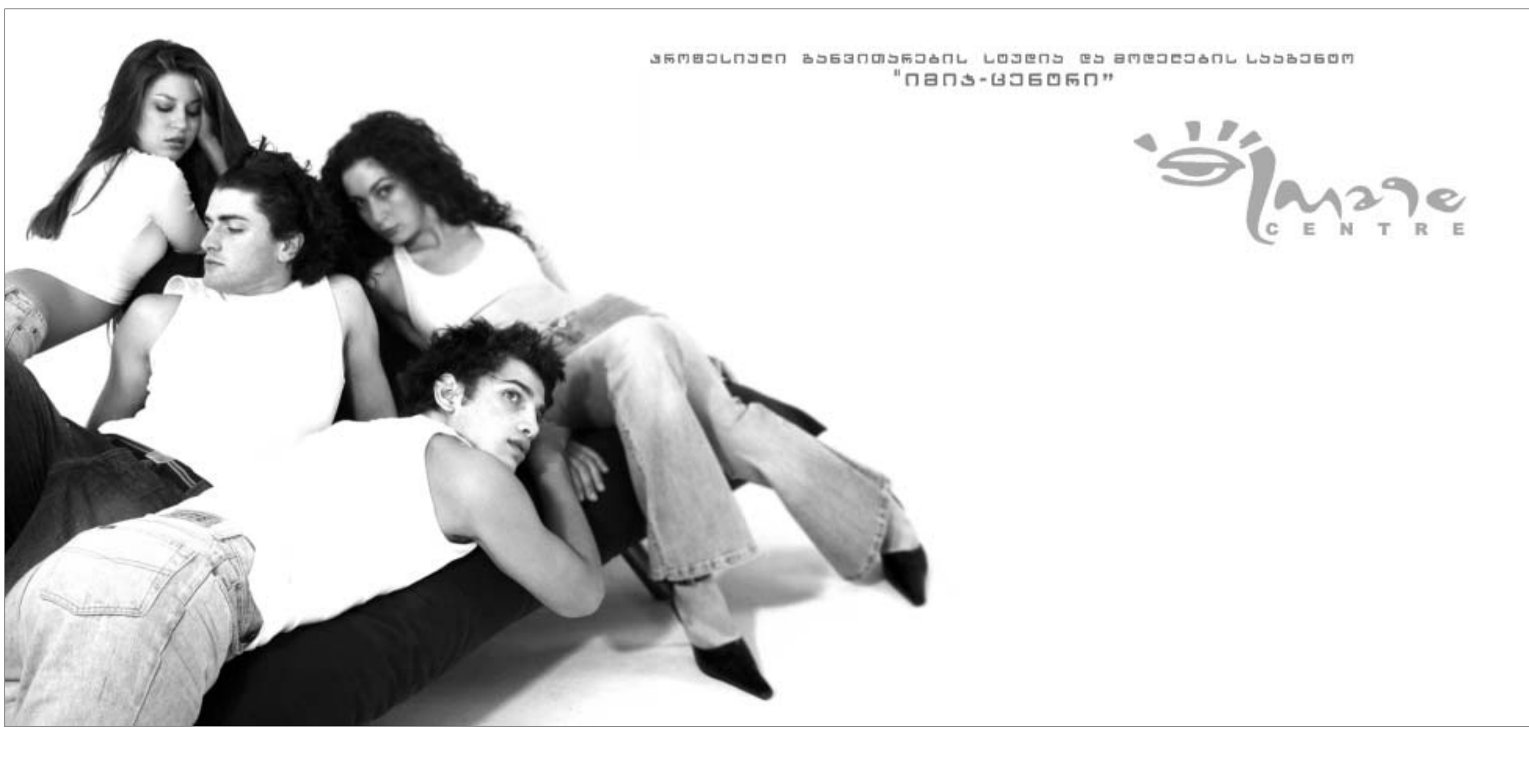
კრიზისული განვითარების სივრცე და მომდევნო სახანძრო "იზი-ცხენი"

ასე რომ, მადესტაბილიზებული ფაქტორები კვლავაც უზედადა და მათი ამოქმედება დიდ სირთულეს არ წარმოადგენს, თუკი საქართველო არ გადადგამს კონტრნაბიჯებს. პირველყოვლისა, აუცილებელია კონფლიქტების პოლიტიკური მონესრიების პროცესის გადაყვანა რეალურ სიტუაციულ, შესაბამის საინფორმაციო პოლიტიკის განხორციელება და, რაც მთავარია, მადესტაბილიზებული ფაქტორების პრევენცია ღრმა სიტუაციური ანალიზითა და თანამიმდევრული ქმედებებით.