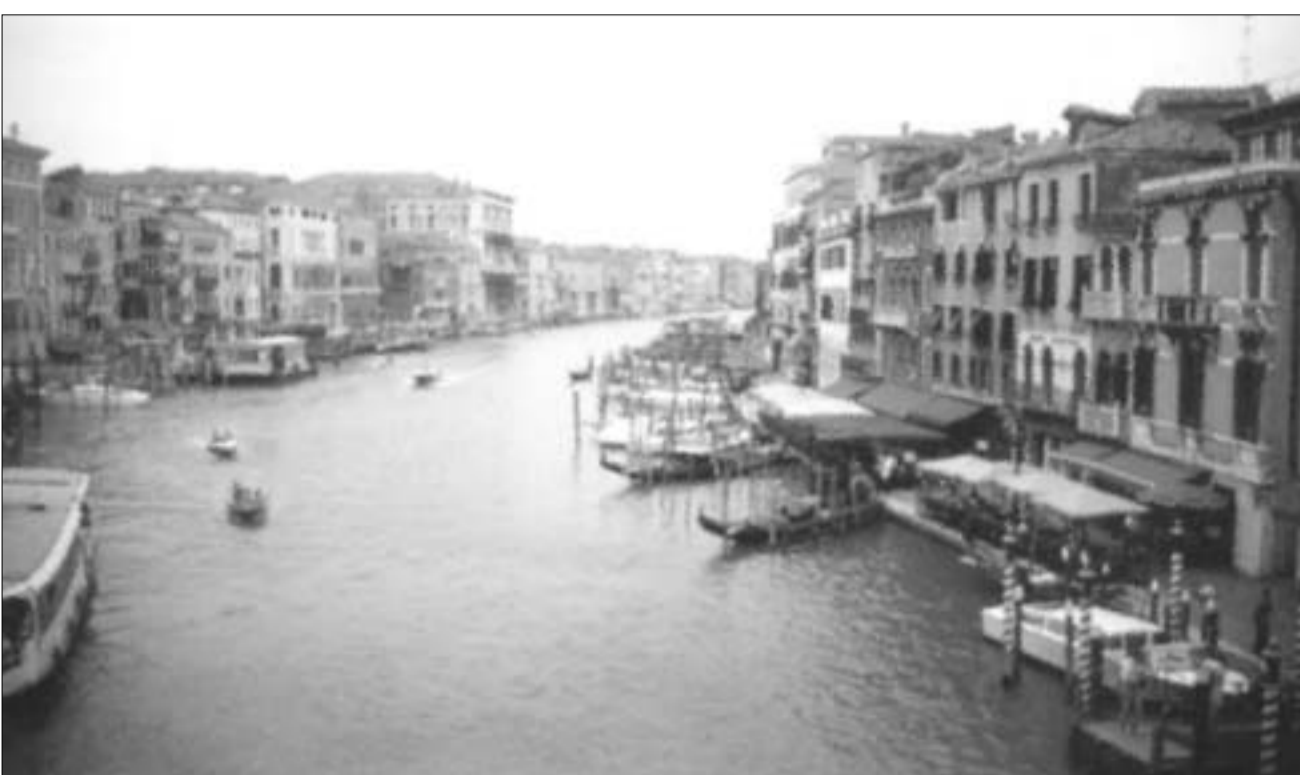
ხედი რიატოს ხიდიდან

ჩვეულებრივ მოქალაქეთა და უბრალო ხალხის საცხოვრებელი ბინები, რა თქმა უნდა, ასეთი მორთული არ ყოფილა, მაგრამ საკმაოდ კარგად იყო მოვლილი და იმ დროისათვის