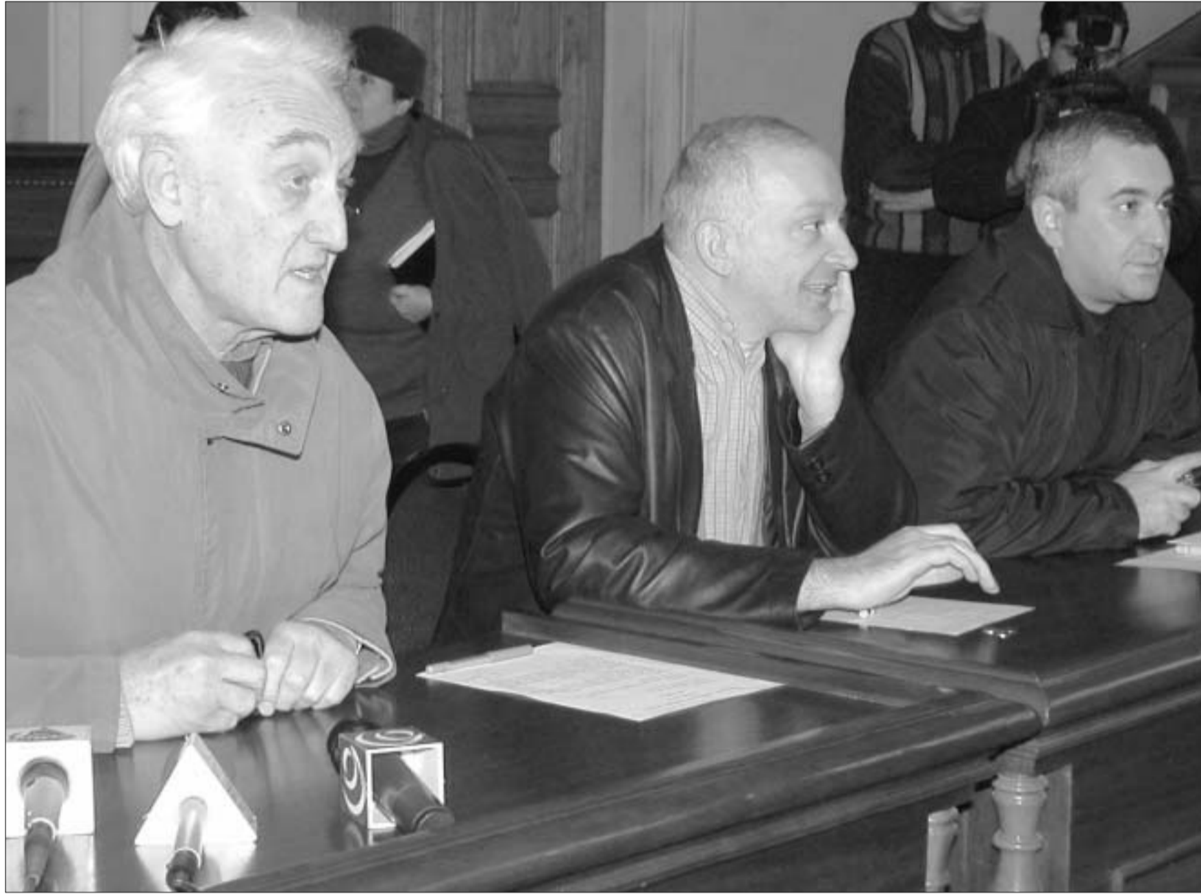
ცესკო კანონსა და ამომრჩევებს დასვინს