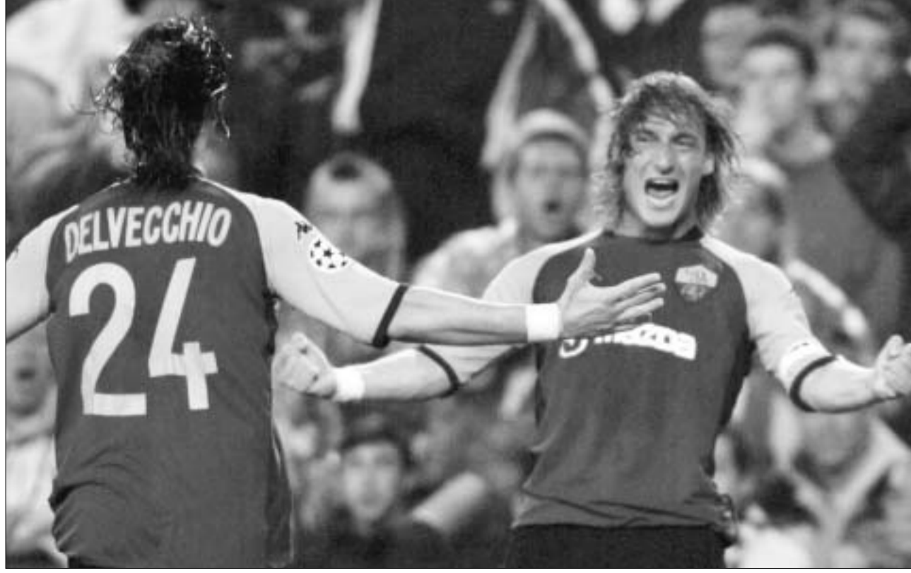
დელვეკიო და ტოტი გატანილი გოლის შემდეგ.