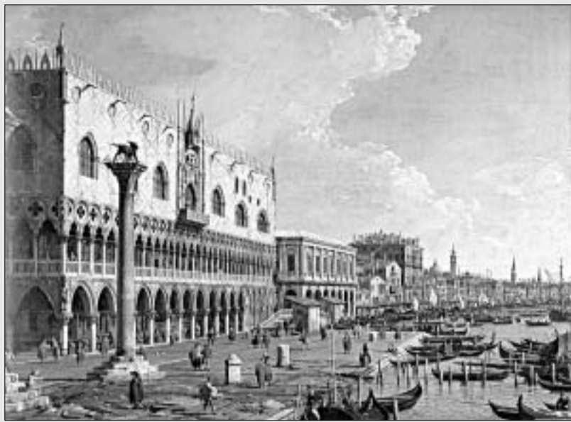
კანალიტო - სანაპირო.

თუ ყველანი მიჩვეულები ვართ, რომ ბუნების გამომსახველ სურათს პეიზაჟი ჰქვია, ყველამ შეიძლება არ იცოდეს, რომ ქალაქის გამომსახველი პეიზაჟის პროფესიული სახელია "ვედუტა", რაც იტალიურად დანახულს ნიშნავს. ვედუტის ფანრი XVIII საუკუნის ვენეციაში ჩამოყალიბდა. ამ ფანრის კრიტიკალიზაცია მოხდა ვენეციელი მხატვრის, კანალიტოს (ანტიონიო კანალეს) შემოქმედებაში. კანალიტო ხატავს ქალაქის ღრმა, ილუზორულად დამაჯერებელ ხედებს, ვენეციის მდიდარი არქიტექტურის ყველა დეტალი ძალიან ზუსტადაა ამონერილი და ძალიან რთულ რაკურსებშია გამოსახული. ეს ყველაფერი ორგანიზებულია მკაცრ განონასწორებულ კომპოზიციებად. მიუხედავად დიანგონალეხისა და რაკურსების სიუხვისა, სივრცე ყოველთვის პანორამულად იშლება. მსუყე, მკლერი ფერები განაპირობებს სურათის დეკორატიულ სიმდიდრეს. კანალიტო მისწრაფდა გამოსახულების სიზუსტისაკენ და მიზნის მისაღწევად თანამედროვე ფოტოგრაფიის ნიშნებს, კამერა ობსკურას იყენებდა, ანუ ყუთს, რომლის ერთ კედელზე ვინჩი ხერვლი, ერთგვარი ობიექტივი იყო გაკეთებული, ხოლო მეორე, ნახევრადამჭერივალ მასალისგან დამზადებულ კედელზე იქმნებოდა სინათლის სხივების გარდატეხის მეშვეობით შედგენილი გამოსახულება. ამგვარი ფოტოგრაფიული ხერხის გამო კანალიტოს სურათები სცლდებოდა ფერნერული კომპოზიციის მანამდე გამოუმუშავებულ ხერხებს და უახლოვდება ფოტოგრაფიას.