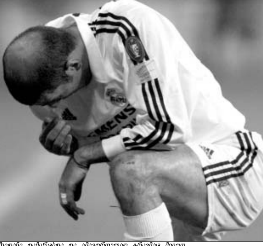
ზიდანი დამარცხდა და ამავედროულად ტრავმაც მიიღო

ვეს ხელიდან და საკმე გაირთულეს. "გენკმა" საბერძნეთში ფრეს მიადინა - 1:1. მართალია, "აეკს" ჯერ კიდევ აქვს შემდეგ ეტაპზე გასვლის მანძი; თუმცა, ამისათვის მათ "რომა" უნდა დაამარცხონ გასვლაზე, რაც ძალიან რთული ამოცანა უნდა იყოს, თუ გათვითვალისწინებთ იმას, რომ რომაელებმა მადრიდში "პლანეტის საუკეთესო გუნდად" წოდებულ "რეალს" საფეხებით დამსახურებულად მოუგეს. ფრანსესკო ტოტის მიერ იკერ კასიასის კარში 28-ე წუთზე გატანილი გოლი კი ტურის უმნიშვნელოვანეს გოლად შეიძლება ჩაითვალოს.