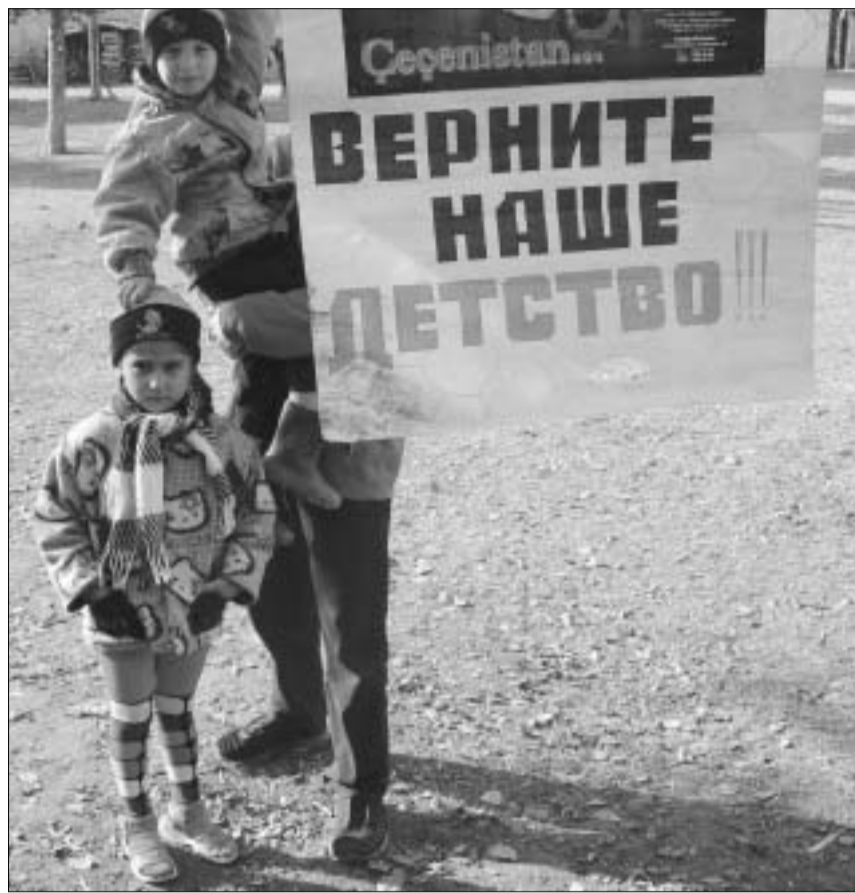
დუისში აქციები პერმანენტულად ეწყობა

“ბავშვები საკვების უკმარისობის გამო იღვრილები არიან, მოხუცები უკვე ჭაუდიან გადადიან”, -- ჩივიან ღტოვნილი ქა-