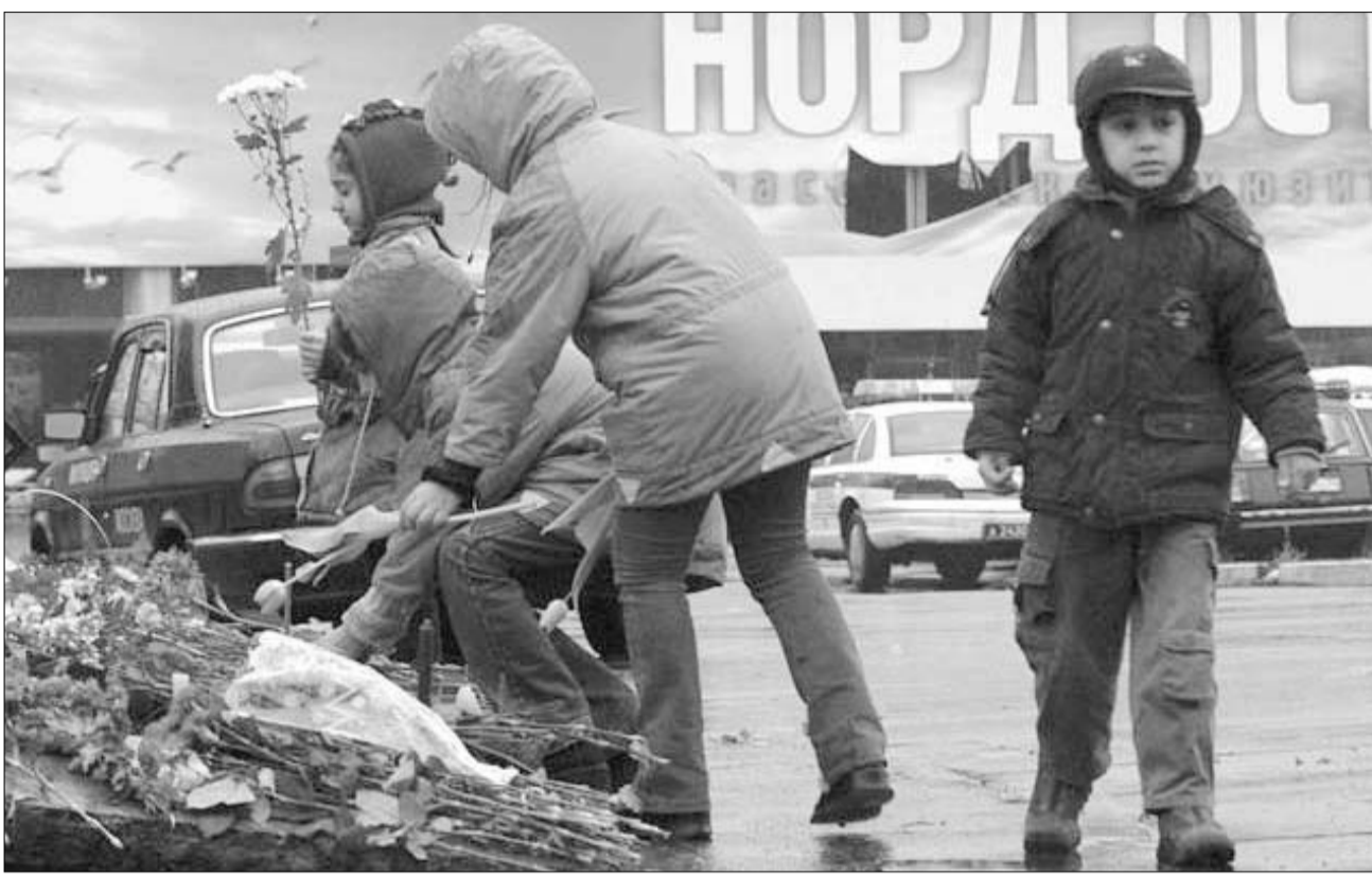
რუსეთი ტრაგედიის მსხვერპლს გლოვობს.

- ნება მომეცით, პრემიის მიანიჭება სახელისუფლოების, ფედერალურ ძალებსაც ეკისრებათ, მათ მიერ გამოყენებული ტაქტიკის გამო?