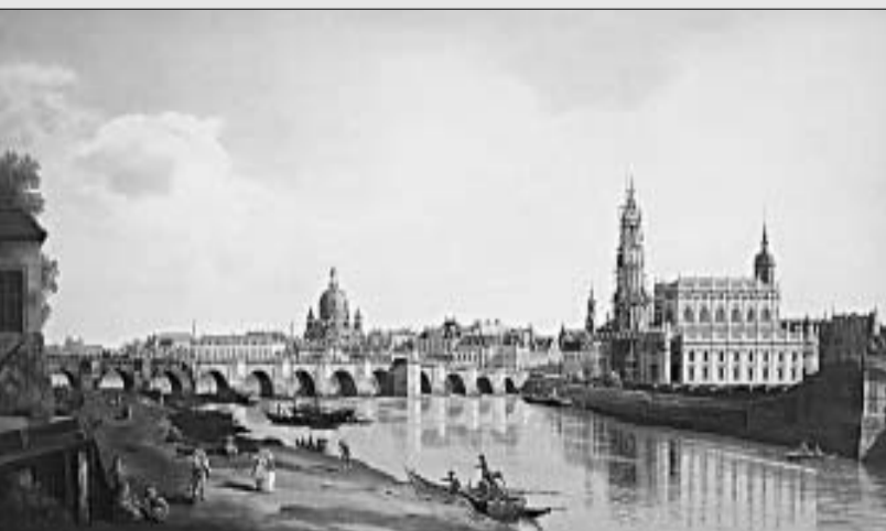
ბელოტო - ხიდი მდინარეზე.

ვენეციის ფანრი ვენეციიდან თანდათანობით მთელს ევროპაში გავრცელდა და სწრაფად მოპოვა პოპულარობა. ამის შესანიშნავი საბუთია ბერნარდო ბელოტოს მიერ შექმნილი ვენის მშვენიერი ხედები.