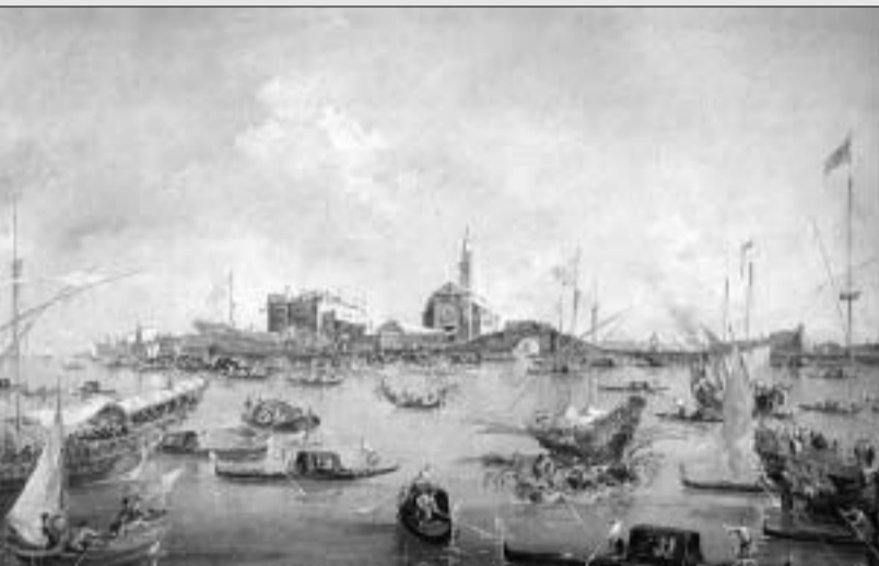
გუარდომი - ვენეციური რეგატა.

ვენეციის ფანრი შემდგომში ფრანკესკო გუარდომი და ბერნარდო ბელოტომ განავითარეს. პირველთან ფერნერული სტიქია კიდევ უფრო თავისუფალი და დინამიური გახდა. მისი მხატვრობა ვენეციის პაერისა და სივრცის ვიბრაციების გადმოცემაზე იყო ორიენტირებული. ამის გამო არქიტექტურის მკვეთრი კონტრასტები იშლება და დეტალები ქრება. ფრანკესკო გუარდომი თავისი სილამაჟის გამო იაფად ყიდულობდა სხვა, ძირითადად უნიჭო და ეპიგონი მხატვრების მიერ შესრულებულ ვედუტებს და ზემოდან "ახატავდა პაერს". მისი ფერნერის გამომსახველობა უკვე აღარ იყო დამოკიდებული არქიტექტურული ნატურის