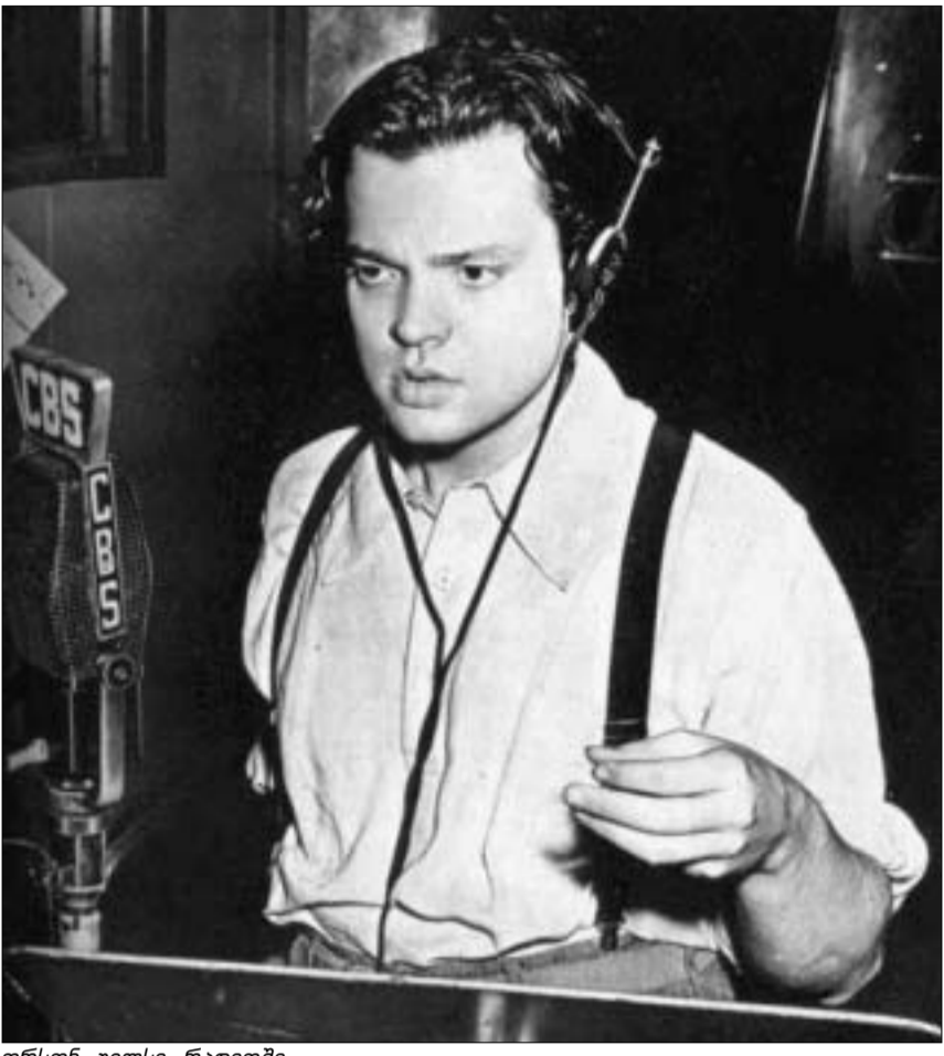
ორსონ უელსი რადიოში

ბუნებრივია, მასობრივი ქაოსი და შიში მეკის ტელელობას აღარ მოჰყოლია. თუმცა, თავად შურნალისტი მიიჩნევს, რომ საკუთარსა და უელსის ექსპერიმენტს შორის მანიჭ-მდეგ მიმართული გეგმები დასახეს“... ბექს თავის პროექტში ცოცხალი ორკესტრის გამოყენებაც სურდა, მაგრამ ტექნიკური ხარვეზების გამო ეს ვერ მოახერხა და ისე უელსის გადაცემაში გამოყენებული მოუსიკის ჩანანტის დასჯერდა.