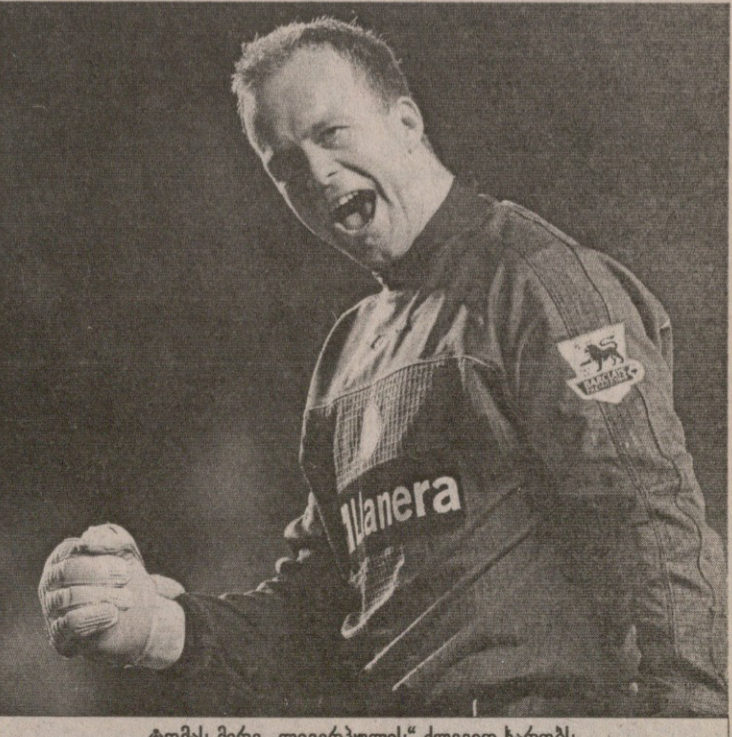
ტომას მირე „ლივერპულის“ ძლევეთ ხარობს

ახლა „ლივერპული“ 6 ქულით და 1 თამაშით ჩამორჩება მეორე ადგილზე მყოფ „მანჩესტერს“.