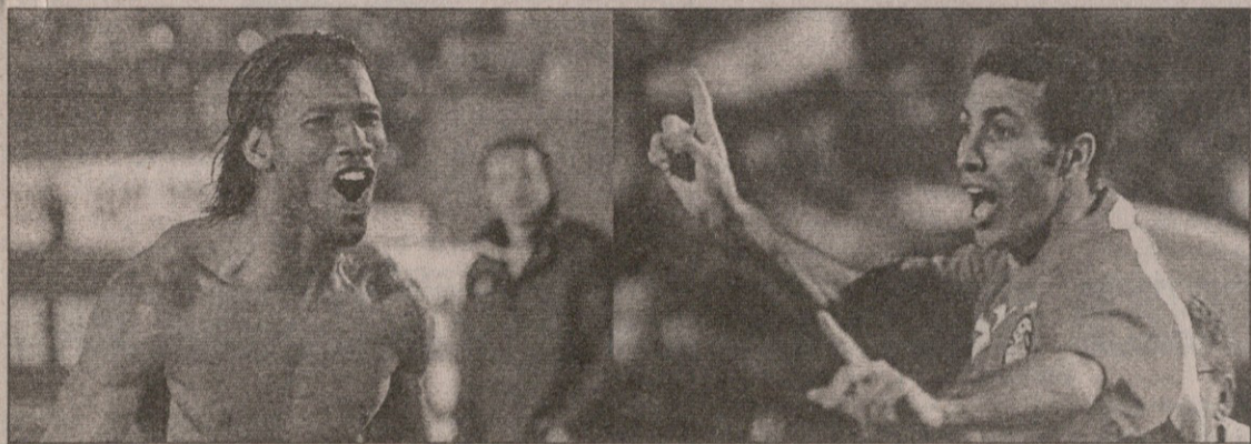
„სპილო“ დროგმა და „ფარაონი“ მოტაბი