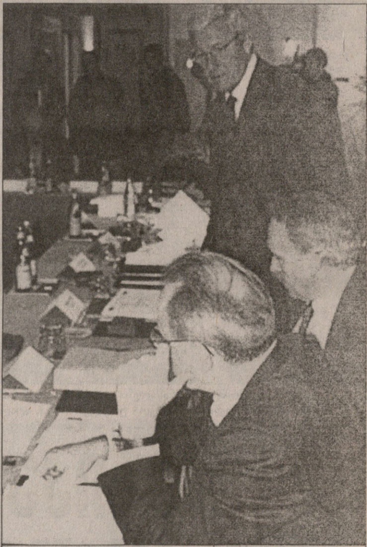
პარიზში მარჩელო ლობიც ჩავიდა