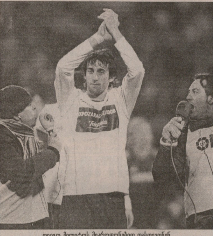
დიეგო მილიტოს მიკროფონებით დასდევნენ

უკვე 3:0 გახლდათ დიეგო მილიტოს ჰეთ თრიქის წყალობით არგენტინელმა მილიტომ (რომლის „სინდისზე“ მეოთხედფინალში „ბარსელონას“ გაძევება) „ლა რომარედაზე“ დაამტკიცა, რომ ესპანური ლიგის ერთ-ერთი საუკეთესო ფორვარდია. დიეგომ „რეალის“ უკანახაზელთა ურცხვი შეცდომა (ელგერას თამადაობით, რომელმაც განსაკუთრებით ბევრი შესვლა) მშვენივრად გამოიყენა და გალაქტიკოსებს ბოლო პრაქტიკულად მარტომ მოულო.