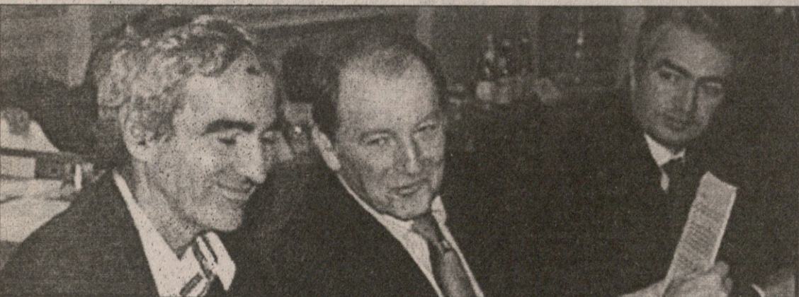
ფრანგთა თავკაცი რაიმონ ლომენევი (მარცხნივ) შეხვედრის დაწყებისას იმედიანი ჩანდა