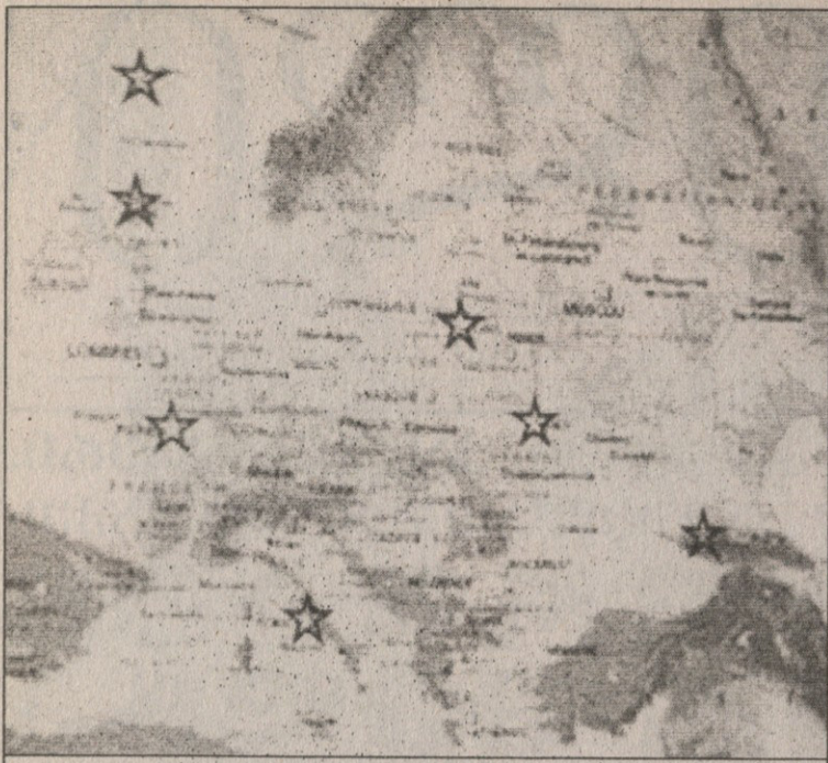
ბ ჯგუფი რუკაზე