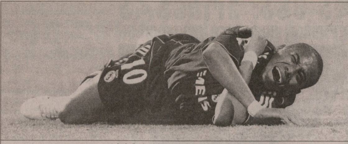
რობინოს „რეალი“ „სარაგოსამ“ ატირა

ინგლისი პრემიერლიგა გადადგებული მატჩი ჩარლტონი 2:0 ლივერპული 1:0 დ. ბენტი (42), 2:0 იანგი (45) ჩარლტონი: მირ, იანგი, პერი, პრე-დარსონი, სპეტორი, ბ. პიუზი, კიმი-შევი, სმერტინი (ელ კარკური 83), ტომა (ამბროზი 79), მ. ბენტი, დ. ბენტი მწვრთნელი: ალან კერბიშლი ლივერპული: დუდევი, ფინანი, ვარაგერი, შიპია (რიხე 70), ჯ. ტრაორე, ჯ. სისე (კრომპაში 78), სისოკო, ხაბი ალონსო, კიუელი, მორიენტი, კროუტი (ფაულერი 60) მწვრთნელი: რაფაელ ბენიტესი გაფრთხილება: ტომი, პერი, დუდევი, ვარაგერი მსაჯი: მარინერი 27 III მაყურებელი