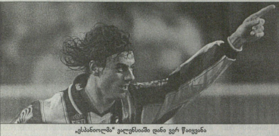
„ესპანოლმა“ ვალენსიაში დანი ვერ წაიყვანა