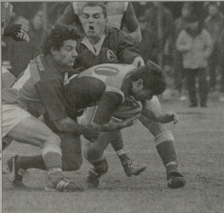
გადარი კაითილასის ფოტო