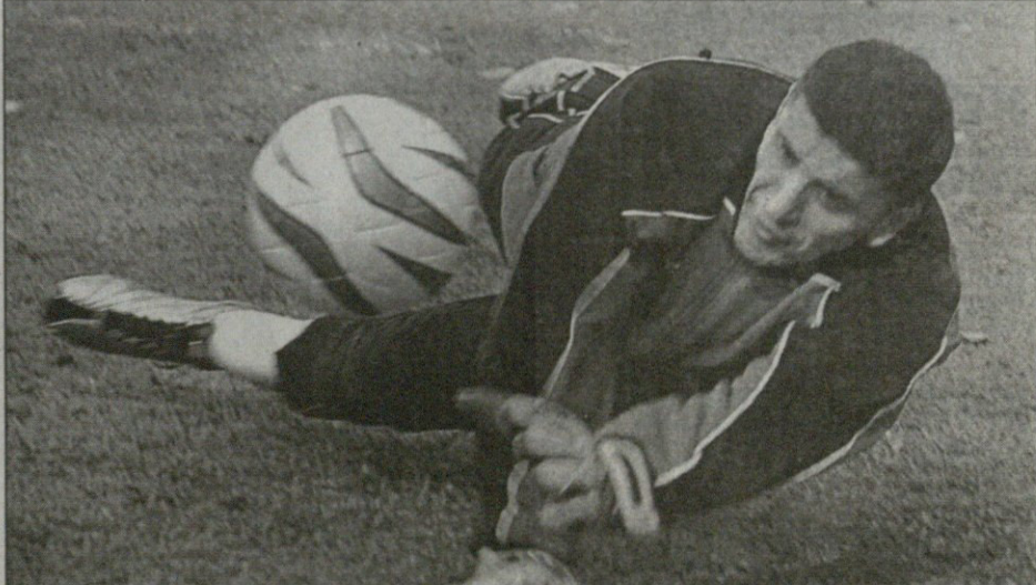
გადარი კაითილასის ფოტო