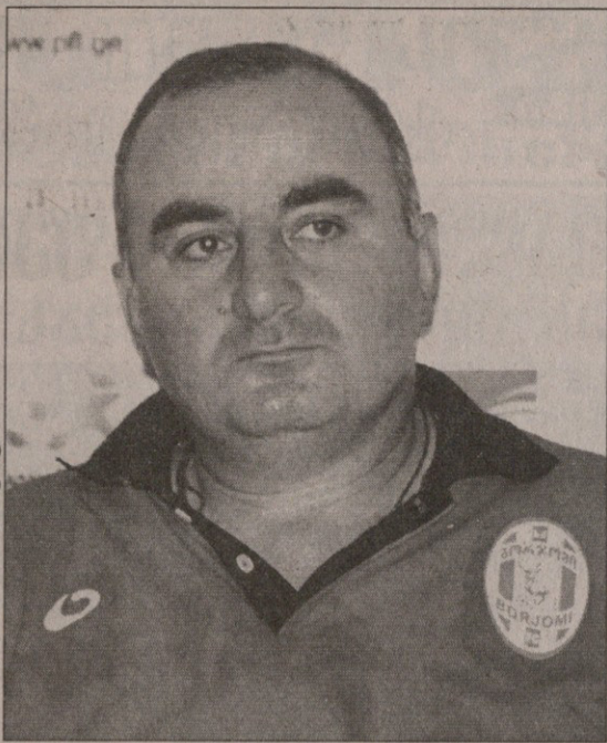
ბორჯომიდან მოვიდა მწვრთნელის შეცვლის ამბავი