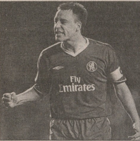
„ბარსელონასთან“ წაგებით სასათაფანჯლო იქონი... „პორტსმუთის“ მასპინძლობა ფოზე მურინიუსს გუნდი ბოლოს წინა ადგილზე მყოფ მუტიოქსთან მხოლოდ გამარჯვებაზე ფიქრობს.