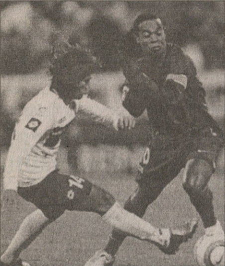
სათასო სარაგოსა — ბარსელონა მასპინძლობდა 4:2 მოიგეს

პრიმერას გრანდებმა საჩემპიონთალიგო ომები დროებით მოილიეს და ისევ შინაურ ჩემპიონატს დაუბრუნდნენ, თუმცა სად „ბარსელონას“ განწყობა და სად „რეალისა“. თუ კატალონიელები ლონდონში „ჩელისისთან“ მოგებით სინარულისგან მეტხზე ცაზე არიან, მადრიდელებს შინ „არსენალთან“ მარცხი გულს უღრღინეთ. „ბარსა“ დღეს „ლა რომა-