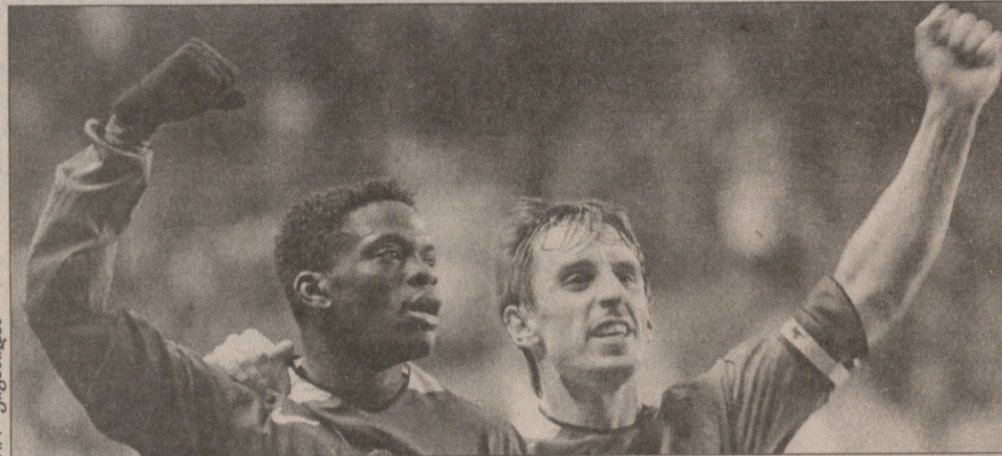
სა და ნევილი მოგვამ წასწია

სულ ცოტა, ექვსი საგოლე მომენტი ვერ გამოიყენეს. სტუმართა დაცვას ეძინა, ნახევარმცველები კი შეტევებს თავს ვერ აბამდნენ. შესვენების შემდეგ „უიგანმა“ კიდევ უფრო მოუმატა და დაწინაურდა შარნერის გოლით, რომელმაც ვან დერ საარის მოგერიებული ბურთი ახლოდან გაიტანა. ამის მერე კი იკადრა ფერგიუსონმა და რუელ ვან ნისტელროი შეუშვა, რომელიც უთამაშებლობის გამო მწვრთნელზე ნაწყენი ყოფილა. ჰოლანდიელმა ოთხ წუთში საგოლე პასი მიართვა კრიშტიანუ რონალდუს და მანაც ანგარიში გაათა-