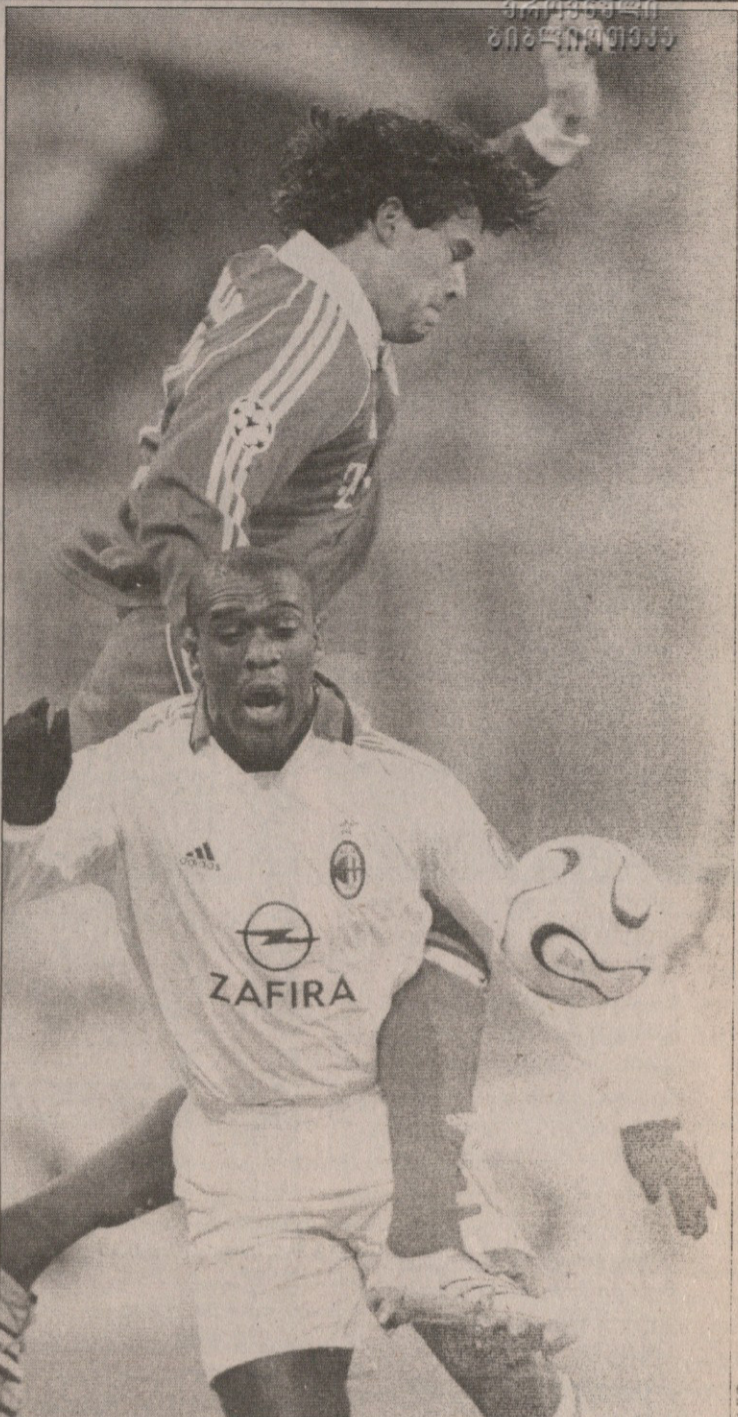
ზეედორფი და ბალაკი დღესაც არაერთხელ შეხვლებიან