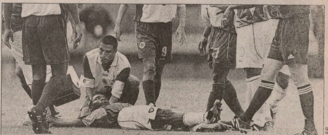
2003 წელი. კოლუმბია — კამერუნი. მარჯვნივ ფიფა მოედანზე გარდაიცვალა