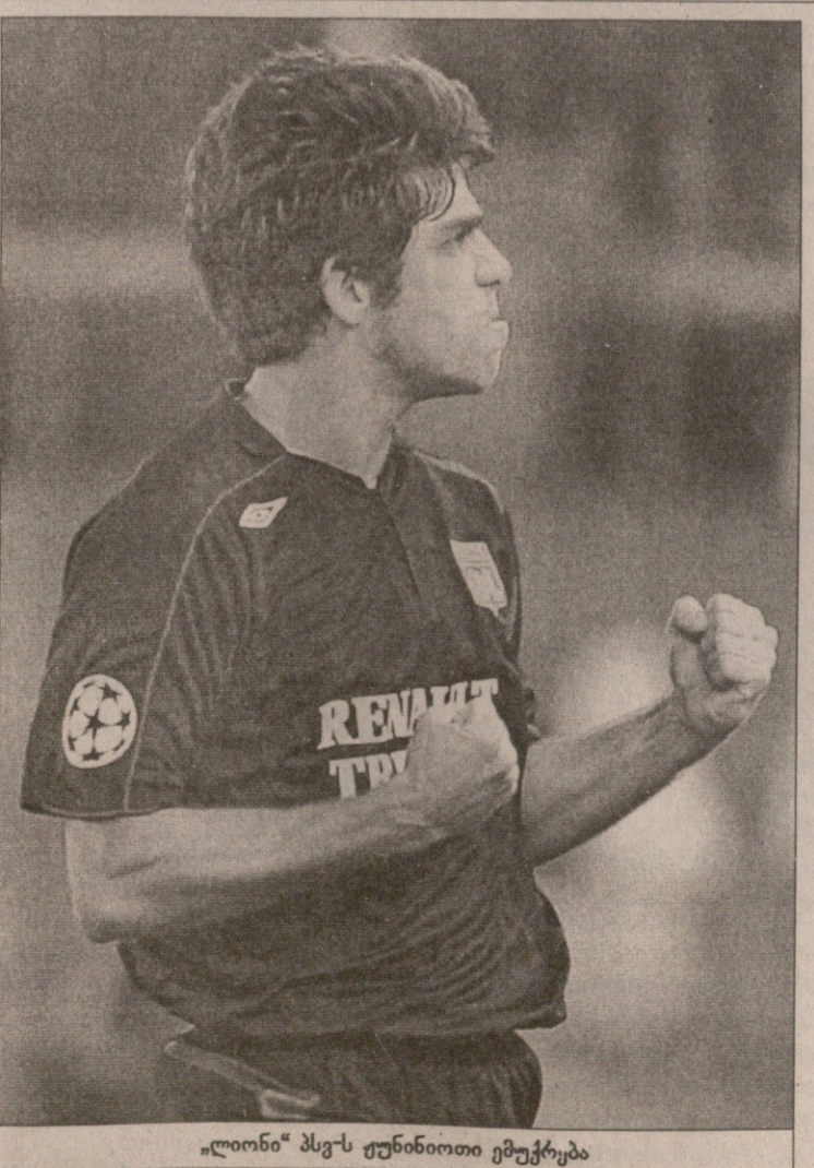
„ლიონი“ ჰეს-ს ფუნინიოთი ემუქრება