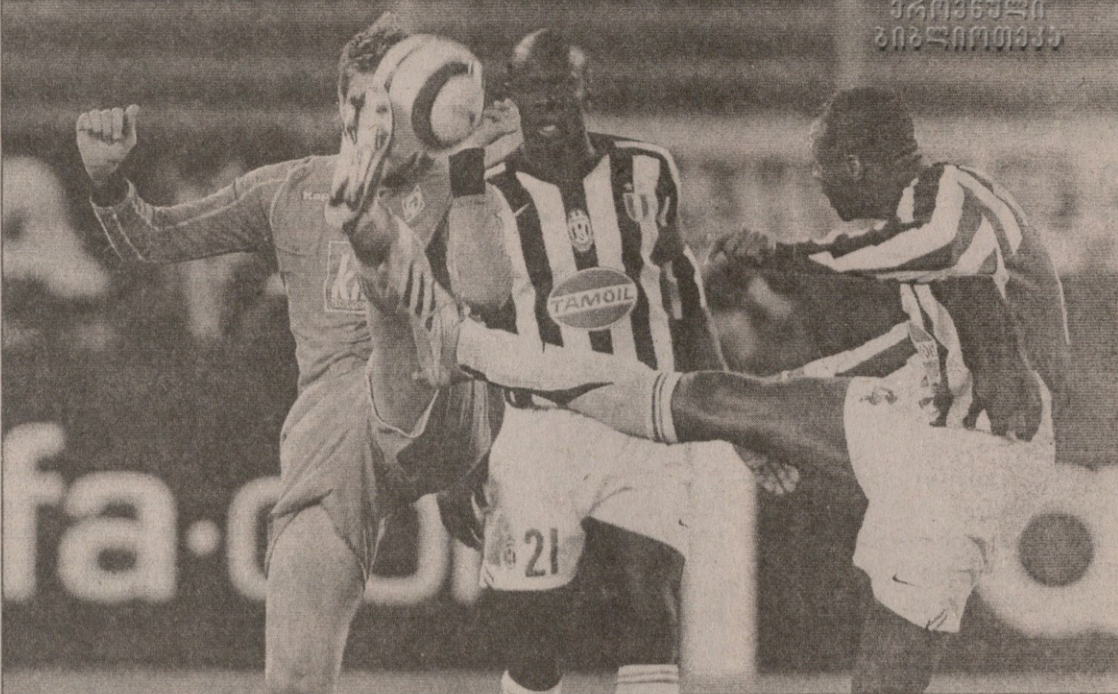
იუვენტუსი — ვერდერი. ტურინელებს გერმანელთა ძლიერმა ძლიან გაუჭირდათ

ვილიარეალი (ესპანეთი) 1:1 რეინჯერსი (შოტლანდია) (2:2) 0:1 ლოვერანდსი (12), 1:1 არუბარენა (49) ვილიარეალი: ვიერა, ხავი ვენტა (ექტორ ფონტი 46), გონსალო, პენია, არუ-ბარენა, სენა, ტაკინარდი, ხოსიკო, რიკელმე (კალენა 86), ფორლანი, ხოსე მარი (გ. ფრანკო 46) მწვრთნელი: მანუელ პელეგრინი რეინჯერსი: ვატერუესი, პატონი, კირიაკოსი, ჟ. როდრიგესი, მიურეი, ბარკი (ნოვო 87), ფერგიუსონი, პემდანი, ნამუში, ლოვერანდსი, ბუფელი (ბოიდი 64) მწვრთნელი: ალექს მაკლიში გაფრთხილება: მიურეი, არუბარენა, პატონი, ხოსიკო, ბუფელი, ვიერა, ტაკინარდი, ფრანკო მსაჯი: ალან შამერი (ლუქსემბურგი) 22 000 მაყურებელი