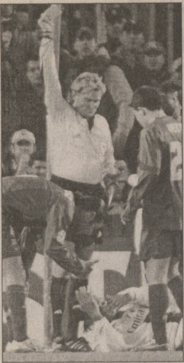
ტელეკომპანია ITV 1-მა გადაიღო პუბლიცისტური ფილმი „სამართლმსაჯების შესახებ“, რომელშიც მთავარი გმირია ანდერს ფრისკი

სკი, მთავარი თემა კი მისი ფეხბურთიდან წასვლა. გავიხსენოთ რა მოხდა: ფრისკი შარშანდელი „ბარსელონა“ — „ჩელსის“ არბიტრი გახლდათ, რომელმაც მოედნიდან ლონდონელი დიდი დროება გააძევა. ინგლისურმა გუნდმა მსაჯი ამის გამო ლამის ჯვარს აცვა, თუმცა იყო სხვა მიზეზიც — „ჩელსის“ შეფები ფრისკს „ბარსელონას“ მწვრთნელ ფრანკ რაიკარდთან შესვენებისას საუბარში სდებდნენ ბრალს. მართალია, ასეთი ბრალდებების გამო უეფამ „ჩელსის“ თავკაცი ჟოზე მურინიუ ორთამამინი დისკვალიფიკაციით დასაჯა, კლუბს კი ჯარიმა გადაახდევინა, მაგრამ შევედ არბიტრს ამით ცხოვრება არ გაუადვილდა. ფრისკმა სასიკვდილო მუქარის წერილები მიიღო და საერთოდ დაანება პროფესიას თავი.