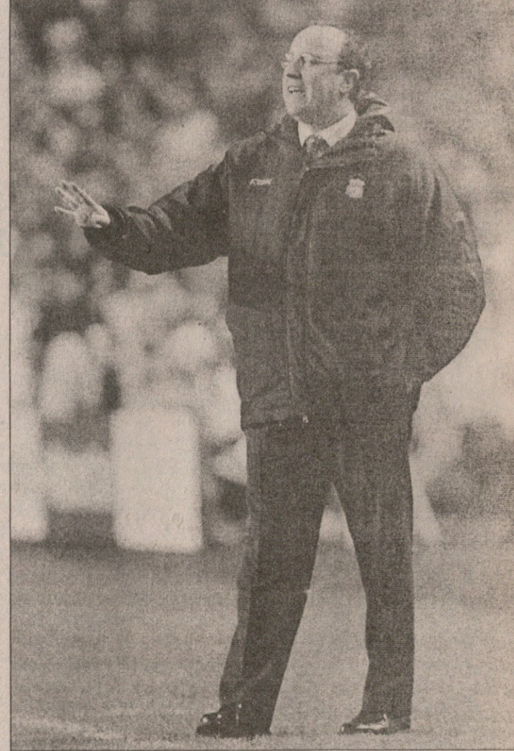
რაფაელ ბენიტესი ბენფიკას უჩივის

ცხადია, ვერ ითამაშებს პირველ მატჩში სერიოზულად დაშვებული მოჰამედ სისოკო, რომელიც ცალი თვალით დაბრმავებას ბეწვზე გადაურჩა. „ბენფიკას“ ბანაკში კი, რა თქმა უნდა, საბრძოლო განწყობაა, მაგრამ პორტუგალიელები არ მალავენ, რომ აქცენტს დაცვაზე გააკეთებენ. მათ დაუბრუნდათ იტალიელი თავდამსხმელი ფაბრიციო მიკოლი, რომელმაც ტრავმა ახლახან მოიშუშა და გასულ უქმეებზე „ამადორას“ გოლიც გაუტანა. „ბენფიკას“ ფრანგი ნახევარმცველი ლორან რობერი: „ჩვენი მთავარი ამოცანა კარის მშრალად შენახვაა. თუ გატანას მოვახერხებთ, მით უკეთესი, მაგრამ მთავარია, კარგად დავიცვათ თავი“. „ცხადია, ძალიან ძნელი მატჩი გველის, მაგრამ ხშირად გრანდებთან უკეთ ვთამაშობთ, ვიდრე სხვა კლუბებთან. ჩვენთვის მეტოქის სახელს მნიშვნელობა არ აქვს. მი-