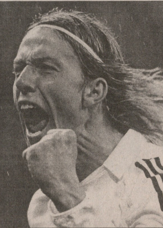
რონალდოს თურმე გუტი ჩაუწიხლავს

ლონდონში „ჰაიბერიზე“ „რეალს“ მორიგედ ყოფნა მოუწევს — პირველ მატჩში ხომ „არსენალმა“ ტიერი ანრის ბრწყინვალე გოლით 1:0 მოიგო.