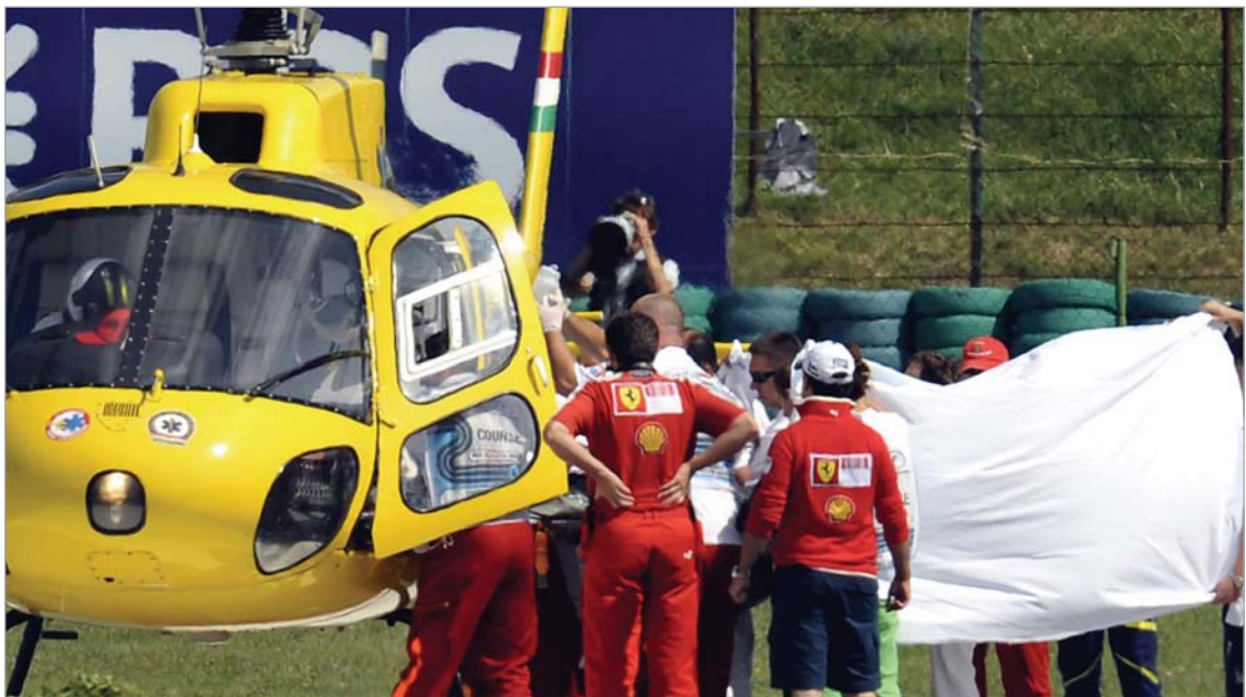
ფელიპე მასა ჰუნგარორინგიდან

...სამეფო რბოლათა მსოფლიო ჩემპიონატის მეთავე ეტაპის კვალიფიკაცია რენოს ესპა-