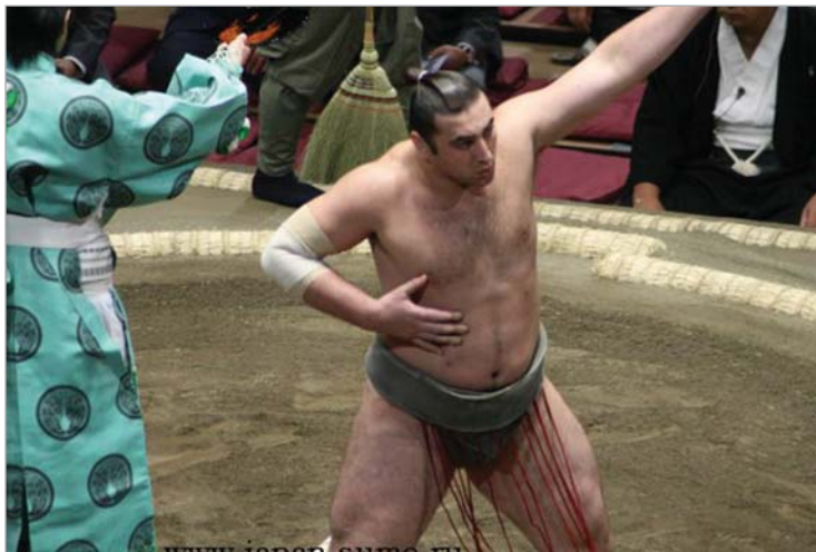
ტორინოშინი პირველ მაიგაშირობას უმიზნებს

ტორინოშინი რომ ბაზოს დადებითი ბალანსით დაასრულებდა, ეს ვადაზე ადრე გახდა ცნობილი, თუმცა მერე ზედმედ რამდენიმე ბრძოლა ნააგო და მხოლოდ გუშინ შეძლო მეტოქის დამარცხება. ასე რომ, ტორინოშინმა ტურნირი 9 გამარჯვებითა და 6 მარცხით დაასრულა. ეს კარგი შედეგია ახალგაზრდა სუმოსისტისთვის, რომელიც ელიტურ მაკუჩი დევიზიონში მეორე სეზონს ატარებს.