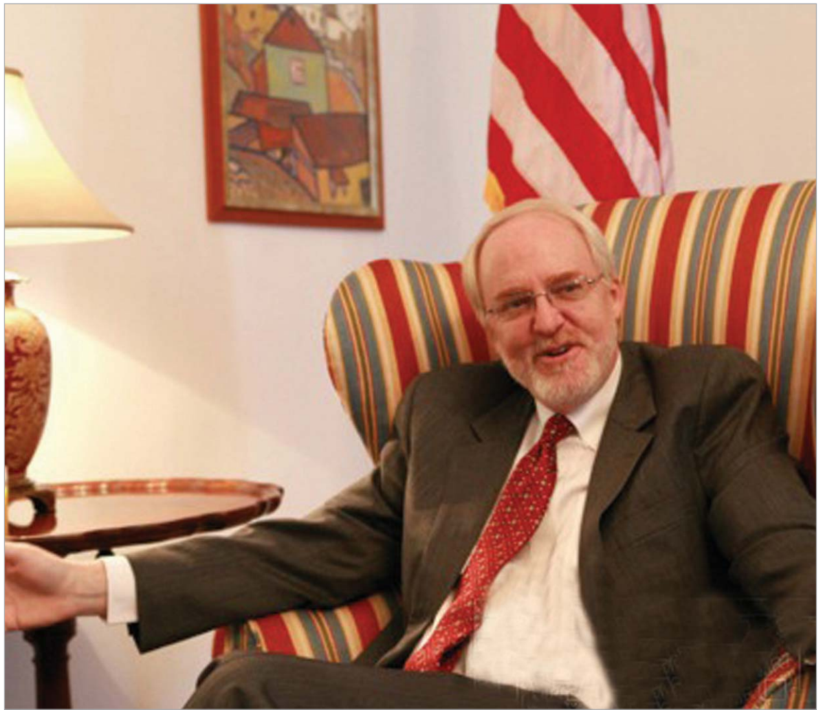
რუსეთში აშშ-ს ელჩი ჯონ ბაიერლი ჩვენ გვაქვს და გვეჩვენა სამხედრო თანამშრომლობა საქართველოსთან