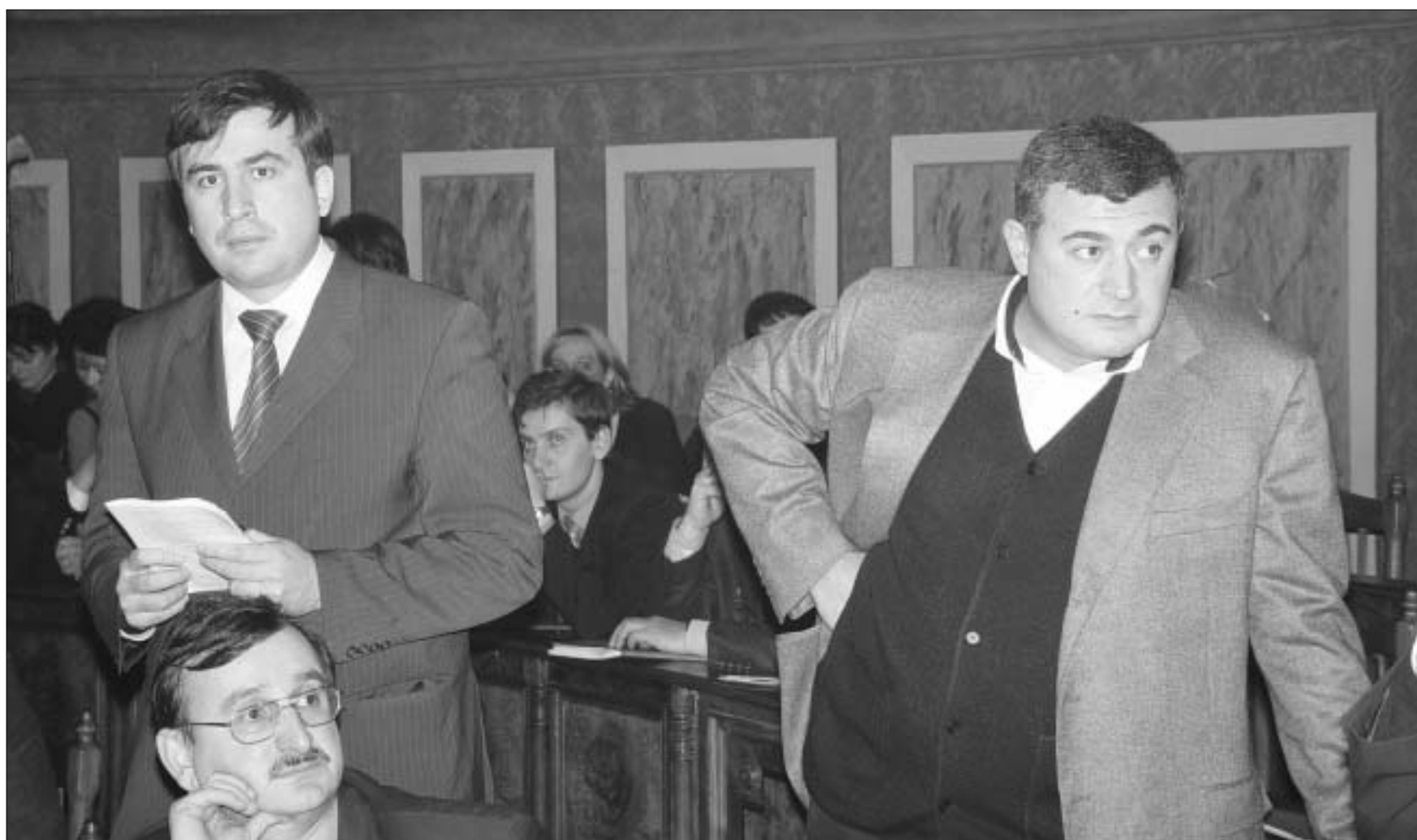
გუშინ პარტნიორები, ხვალ?

როგორც იქნა, თბილისის საკრებულო მყავს. ვერც ცენტრალური საარჩევნო კომისიის ბოლოდროინდელი, ამ კარად გაუგებარმა და ხშირად კანონსაწინააღმდეგო ქმედებებმა, ვერც "ნაციონალური მოძრაობის" აქტივისტების მიერ მერიის შენობის პიკეტირებამ, ვერც საერთო დაძაბულობამ და "ნაციონალურების" და ახალი მემარჯვენეების მცირეოდენმა წაყინკლავებამ ვერ გაანელა იმის მნიშვნელობა, რაც გუშინ საქართველოს დედაქალაქში მოხდა.