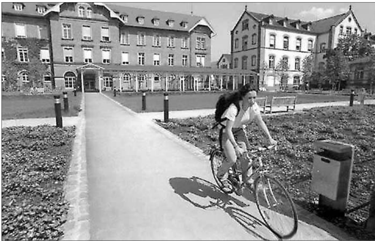
გერმანული სტუდენტის საყვარელი ტრანსპორტი

ბუნებრივია, უცხოეთში მიმავალი ადამიანი, პირველ რიგში, ბინაზე იწყებს ზრუნვას. ფონდების უმრავლესობა ამ საკითხს თავადვე აგვარებს და სტიპენდიანტებს საუნივერსიტეტო საერთო საცხოვრებლებში ანაწილებს. აქ თქვენ დაგვხვდებათ ერთი მოცუტე-ქნის ოთახი, მინიმალური საჭირო ავეჯით, საერთო (მაგრამ სუფთა) ტუ-ფამბოთი და საერთო საშარეულოთი, რომლის სისუფთავა და იქ გამკეეუ-