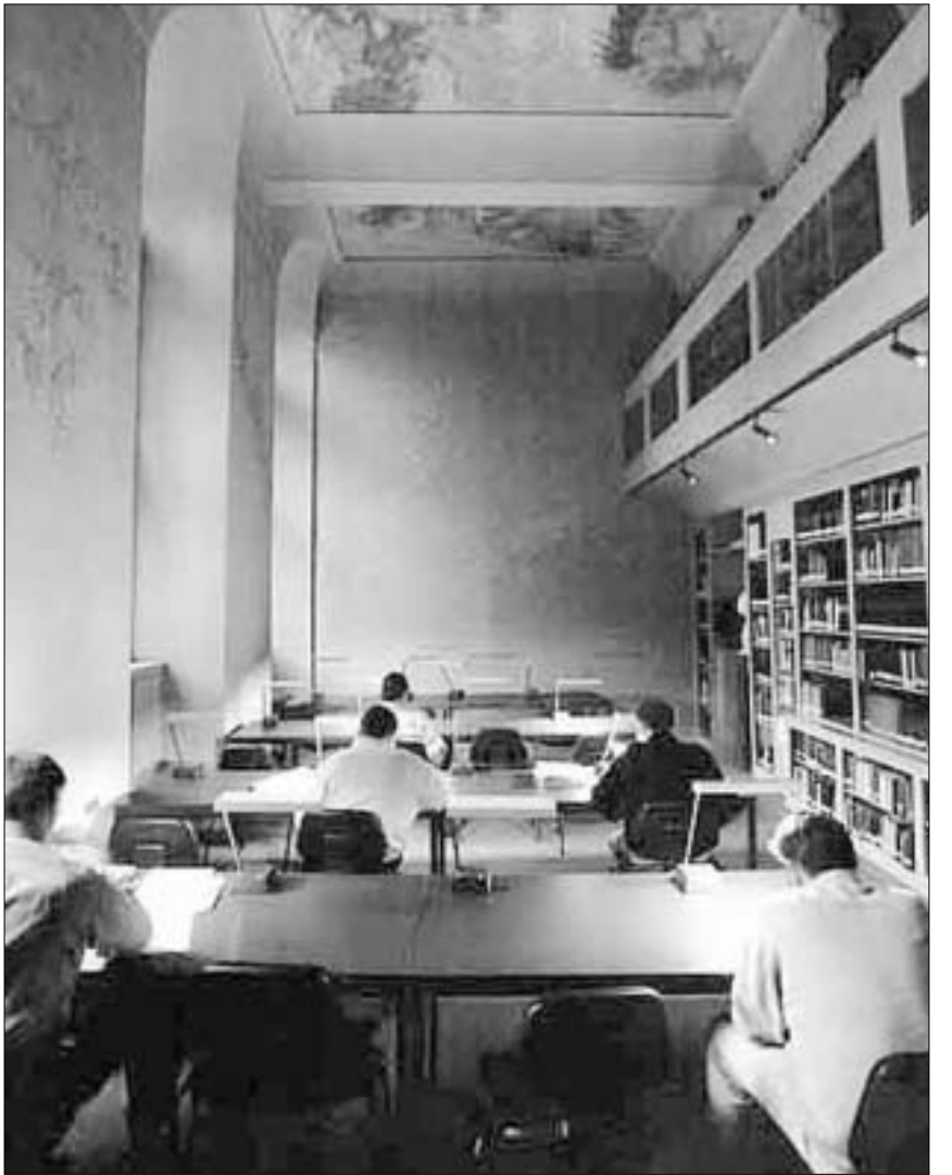
ფილოსოფოსების ბიბლიოთეკა ჰაიდელბერგის უნივერსიტეტში

http://www.avh.de ეს საიტი დაინტერესებს მათ, ვისაც ჰუმბოლტის სტიპენდიით გერმანიაში სამეცნიერო მუშაობის გაგრძელება სურს. აქ სამ სხვადასხვა ფორმატში შეგიძლიათ მოიპოვოთ საჭირო დოკუმენტები და შეიტანოთ თქვენი განაცხადი.