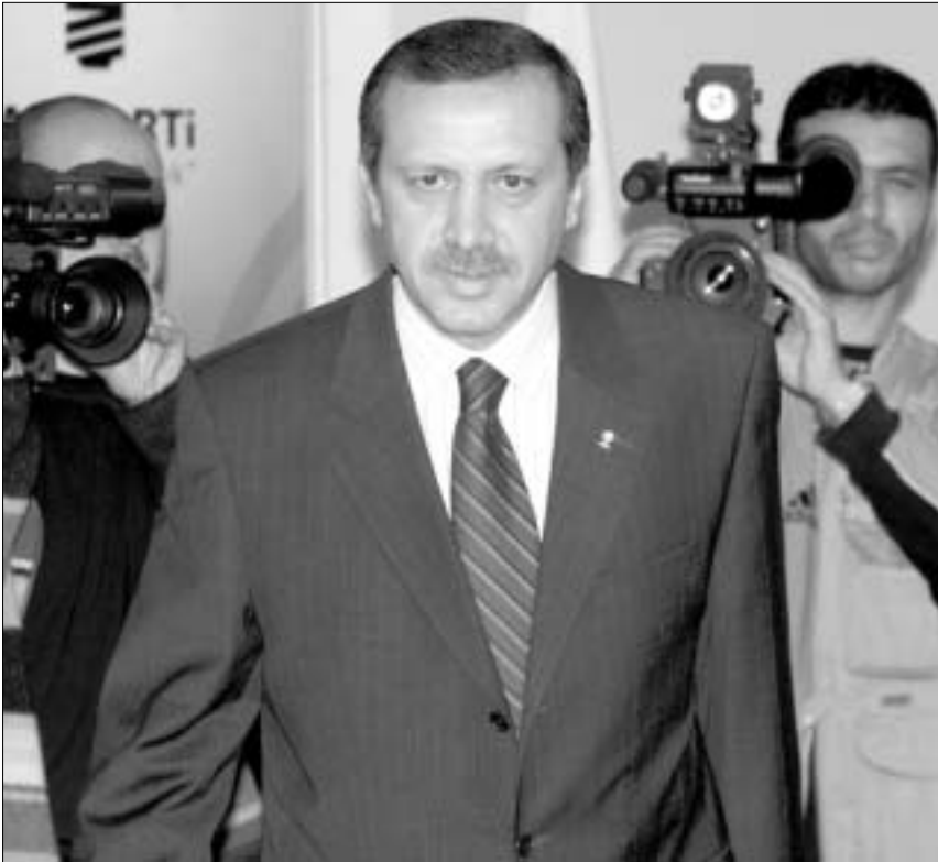
რეჯეპ ტაიპ ერდოღანი

აბდულა გული ჩაუდგება, რომელიც პარტიის ერთ-ერთი ლიდერია. ბევრისათვის იგი კიდევ უფრო მისაღები კანდიდატურაა, ვიდრე ერდოღანი. თავმჯდომარისაგან განსხვავებით, რომელმაც არც ერთი უცხო ენა არ არის, არასოდეს უსწავლია სახელმწიფო და ახალგაზრდობაში, ოჯახის სარჩენად, იძულებული იყო, ლიბო-