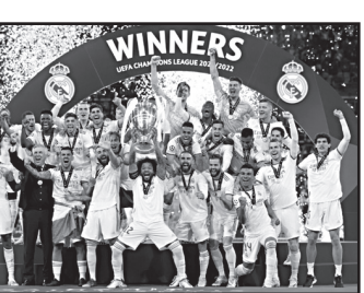
გა 4-ჯერ მოიგო. „პაპა კარლომ“ ევროპის ყველაზე პრესტიჟული საკლუბო ტურნირი ორჯერ მილანსა (2002-03, 2006-07) და ორჯერ მადრიდის რეალს (2013-14, 2021-22) მოაგებინა.

მეორე გაიტანა. მერსისაიდლებმა ბევრი მომენტი შექმნეს, მარტო კარში დარტყმების სტატისტიკა იყო 9:1. კურტუამ ყველაფერი აიღო, რეალმა კი ერთადერთი დარტყმა შეავლო - ვინისიუსმა კარგად ჩაქვტა ვალვერდეს გამჭოლი პასი და რეალმა თასიც ჩაიხუტა.