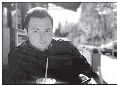
გაუფასურება დაიწყო და ეს გაგრძელდება.

— კი, ამის რისკი არსებობს. ამაზე ბევრჯერ მილაპარაკია. ასე ხელაღებით და არ გაუმჯობესის გარეულ საუბარში ახლა ძნელია და არ შეიძლება, თუმცა არის იმის რისკი, რომ ერთგვარ სავალუტო მანიპულაციასთან გვექონდეს საქმე. ლარმა