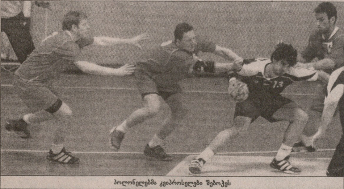
პოლონელებმა კვიპროსელები შებოჭეს

ეპროპის ახალგაზრდული ჩემპიონატის შესარჩევი ტურნირი გუშინ კი დასრულდა, მაგრამ უმოთხვრესი ამბები შაბათს, მეორე ტურში მოხდა. საქართველოს ნაკრებმა პირველი გამარჯვება იხიმა, ჩვენების ამ მოგებით კი პოლონელებმა ჯგუფში პირველობა და ფინალური ეტაპის ერთადერთი საგზური ვადამდე გაინაღდეს. ჯერ წინა დღეს მოგებულების, რუმინეთისა და პოლონეთის უშედავთო ბრძოლა გაჩაღდა. ორივე