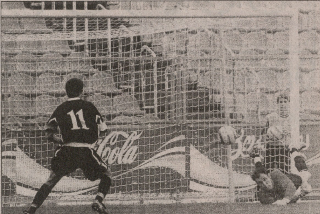
ახალბედა ტორპედოელმა გიორგი გურულმა „დინამო“ ამ გოლით დაამწვხრა