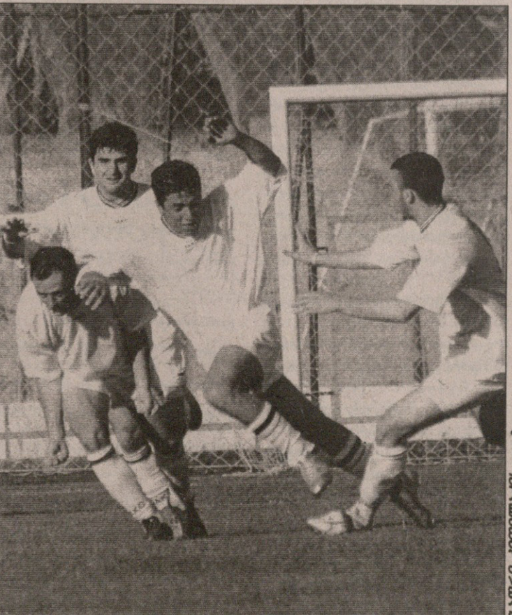
ბათუმელები თელავშიც ვერ შეაჩერეს