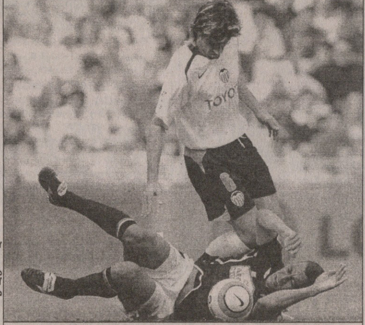
ვალენსია — ესპანოლი. მასპინძლებმა სტუმრებს გადაუარეს

გაფრთხილება: არანაბალი, ფლურ-კინი, ველა, სელადესი, მორანი მსაჯი: პერეს ლიმა 30 000 მაყურებელი