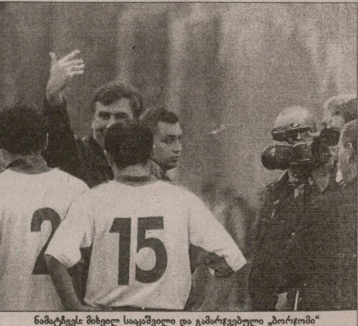
ნამატჩევს მიხეილ სააკაშვილი და გამარჯვებული „ბორჯომი“