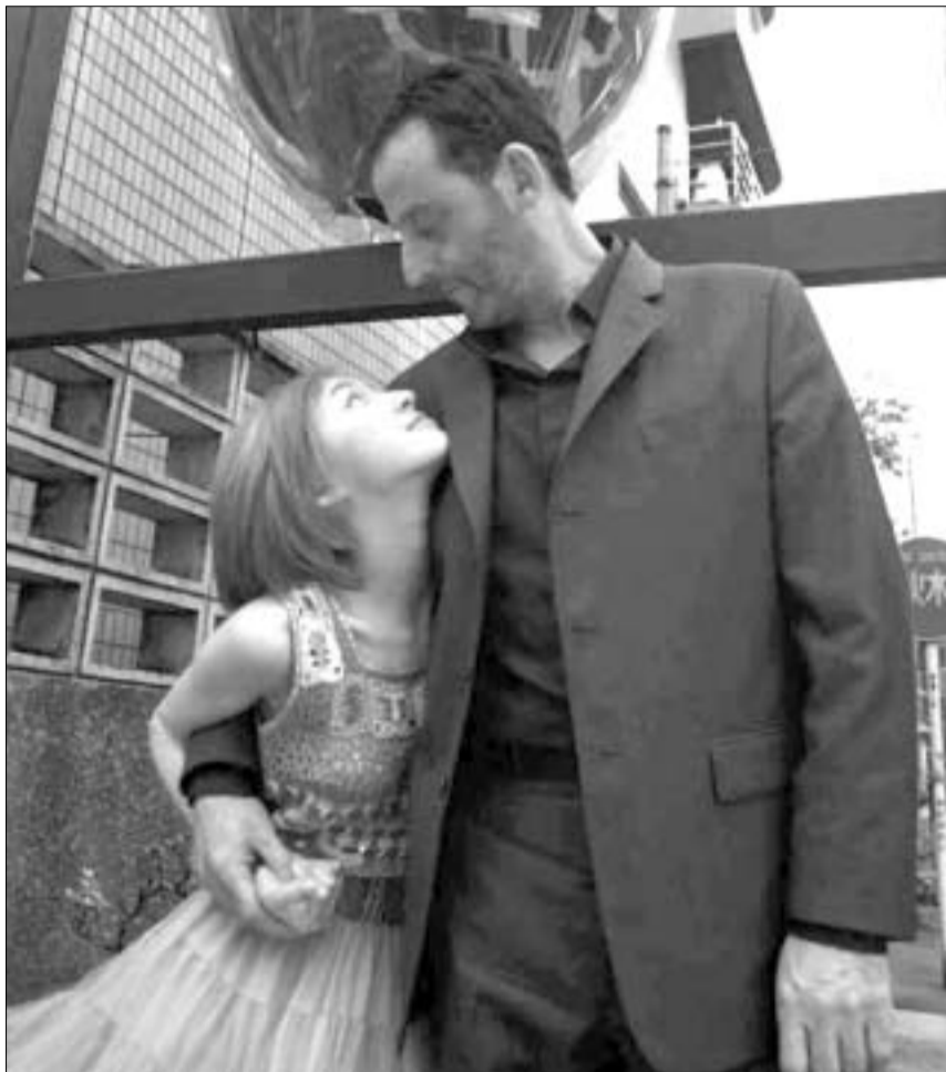
რეჟისორი: ვერარ კრავიჩიკი სცენარის ავტორი და პროდიუსერი: ლუკ ბესონი მთავარ როლებში: ჟან რენო, მიშელ ბიულერი, როიკი პიროსოუ

ამ ფილმში ყველაფერი პარადი-რეზულია, დანაწევრი მამა-შვილური ურთიერთობით და დაბრუნებული იაპონური მათთვის. "ვასაბიში" ტრეკიული და კომიკური სიტუაციები ელვის სისწრაფით ცვლის ერთმანეთს. აღსანიშნავია, რომ ფილმის შემქმნელები სხვადასხვა ტრიუკების ხარჯზე არ ცდილობენ ემოციების გამოწვევას. ფილმის პერსონაჟები თითქოს ჩვეულებრივად იქცევიან, მაგრამ მათთვის ბუნებრივი ქმედება მყურებელში თავმოყვავებულ სიცილს იწვევს. ეს უპირველეს ყოვლისა ლუკ ბესონის დამსახურებაა. ერთი ფაქტია საყურადღებო. მის თითქმის ყველა ფილმში პოლიციელი ან სულელია, ან კიდევ ბოროტების განსაზღვრება ("ტაქსისტი", "ლეონი", "მეზუთე ელემენტი").