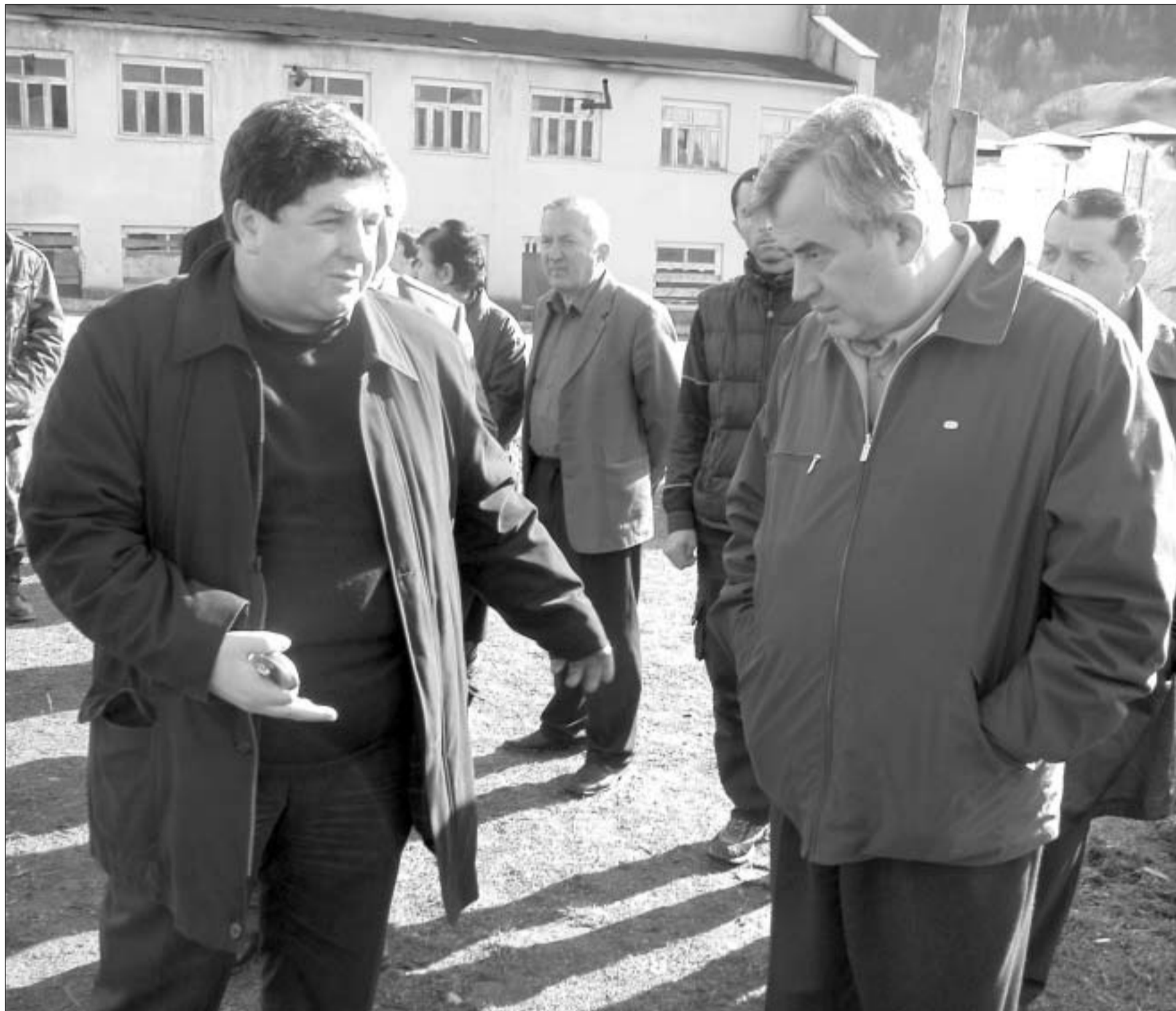
ენგურჯისის და სახელმწიფო მინისტრები კოდორის ხეობაში.