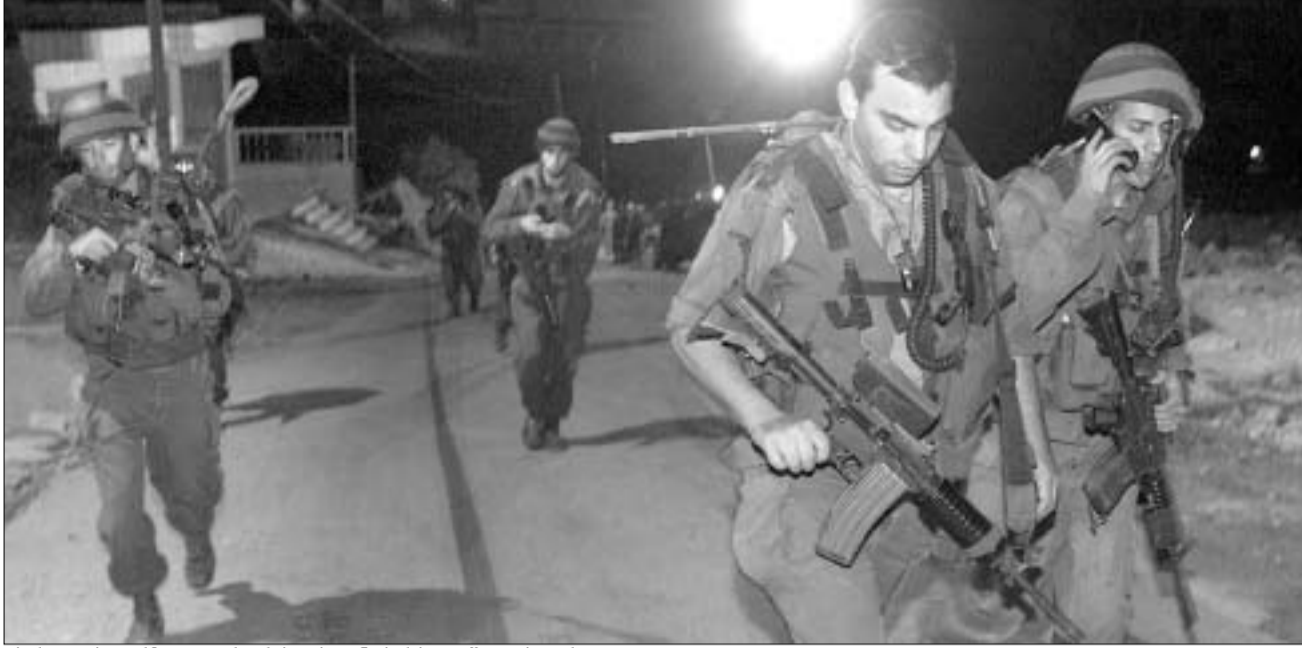
ისრაელის არმია ტერორისტებთან ბრძოლაში უძღვრება.

აიალონმა განაცხადა, რომ მომხდარი საერთაშორისო ტერორიზმის ისეთივე გამოვლინებაა, როგორც კუნძულ ბა-ლიზე, მოსკოვსა და აშშ-ში მომხდარი ტერაქტები. თუმცა, უნდა აღინიშნოს, რომ ამ შეხედულებას, "ერთიანი საერთაშორისო ტერორიზმის" არსებობის შესახებ ბევრი არ იზიარებს. ჩენჩუი და პალესტინური წინააღმდეგობის მოძრაობების მიღების მოთხოვნით გამოდის, რაც საბოლოო ჯამში, იანვარში დაგეგმილ არჩევნებში, ულტრამემარჯვენეების ნისკეილზე დასასმას წყაოს. ბევრი ექსპერტი ვარაუდობდა, რომ ერაყში მოსალოდნელი იქნება, ან, ამერიკა შეეცდებოდა დეკლარირებულ ისრაელი, შეერბილებინა პოლიტიკა პალესტინის მიმართ. ისრაელ-პალესტინის კონფლიქტი ახლო აღმოსავ-