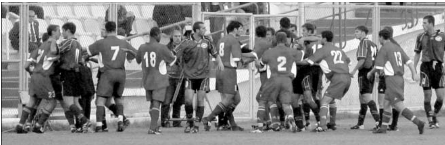
„ლოკომოტივი“-„ვიტ ჯორჯია“ ჩხუბის გამო თამაში 5 წუთით შეწყდა.