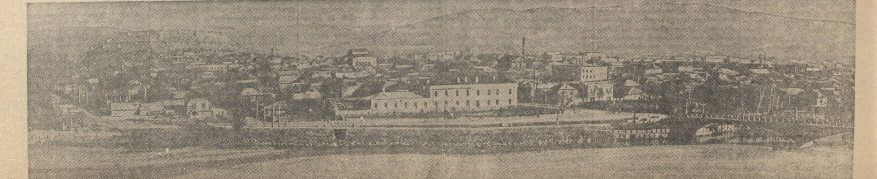
ქალაქ გორის ხედი.