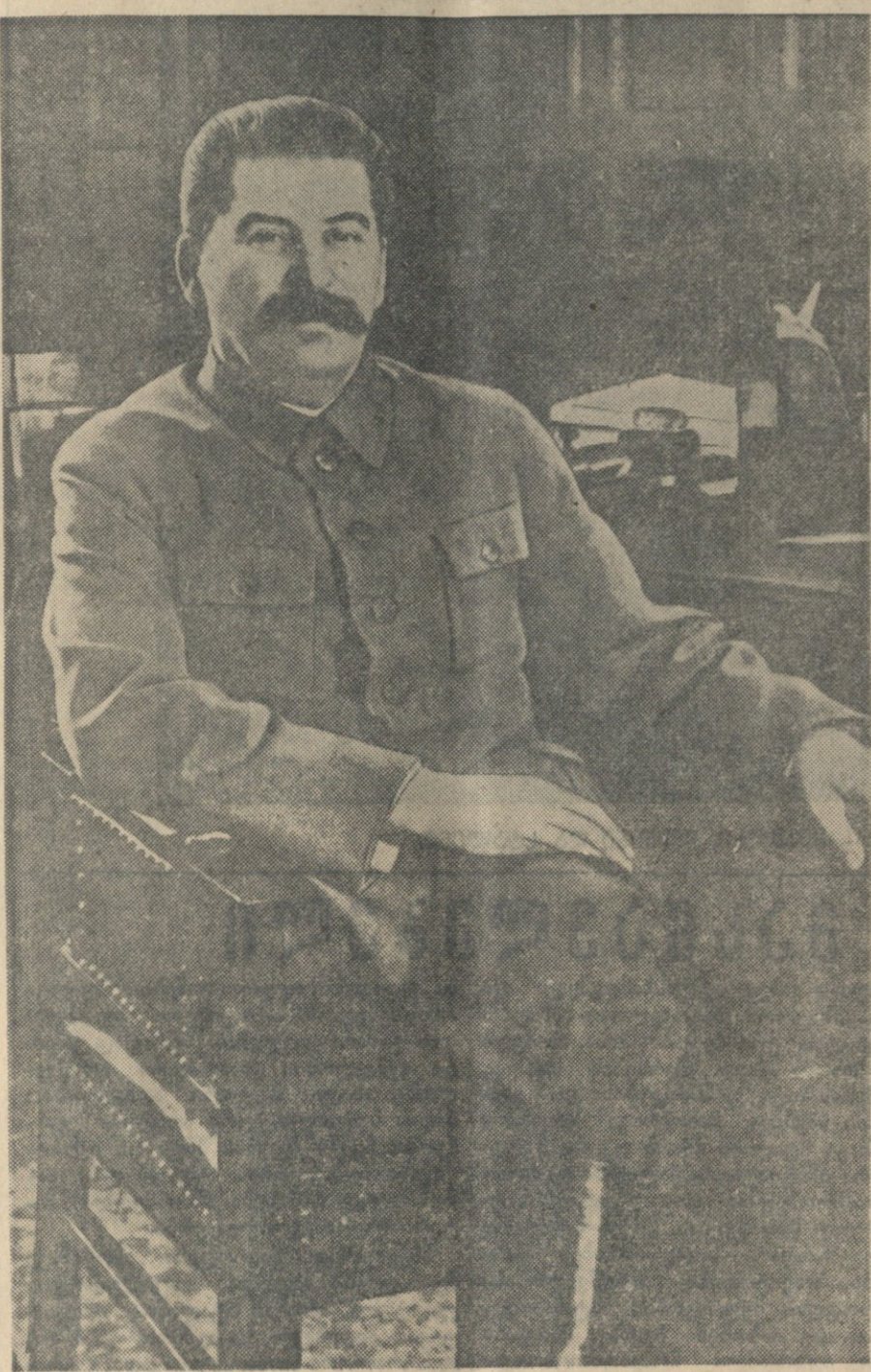
ნ. ს. სტალინი

მისებრი ენთუზიასტები ცხოვრობენ და მუშაობენ რუსთავში. აწვილია ისეთი მუშა, რომელიც გამოშვების ნორმას ვერ ასრულებდეს, ხოლო ისეთი კი, რომლებიც ნორმებს დიდი გაღაპრებით ასრულებენ, უმეტესობაა. ზინკალი ა. მისურაძე, მგალობელი, ყოველდღეურ ნორმებს 250-350 პროცენტით ასრულებს. როგორც მოწინავე სტანანოველი და ენერგული საზოგადოებრივი მუშაკი, ამხ. მისურაძე არჩეულ იქნა საქართველოს კ. პ. (ბ) რუსთავის საქალაქო კომიტეტის წევრად.