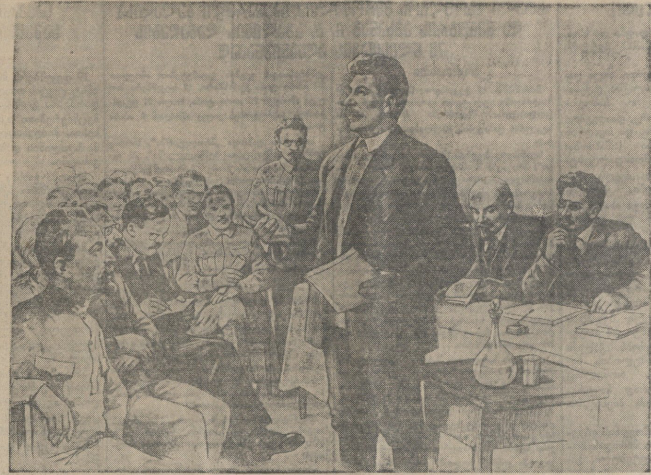
ი. ბ. სტალინის გამოსვლა ბოლშევიკების სკოლის VII (პირლი) კონფერენციაზე