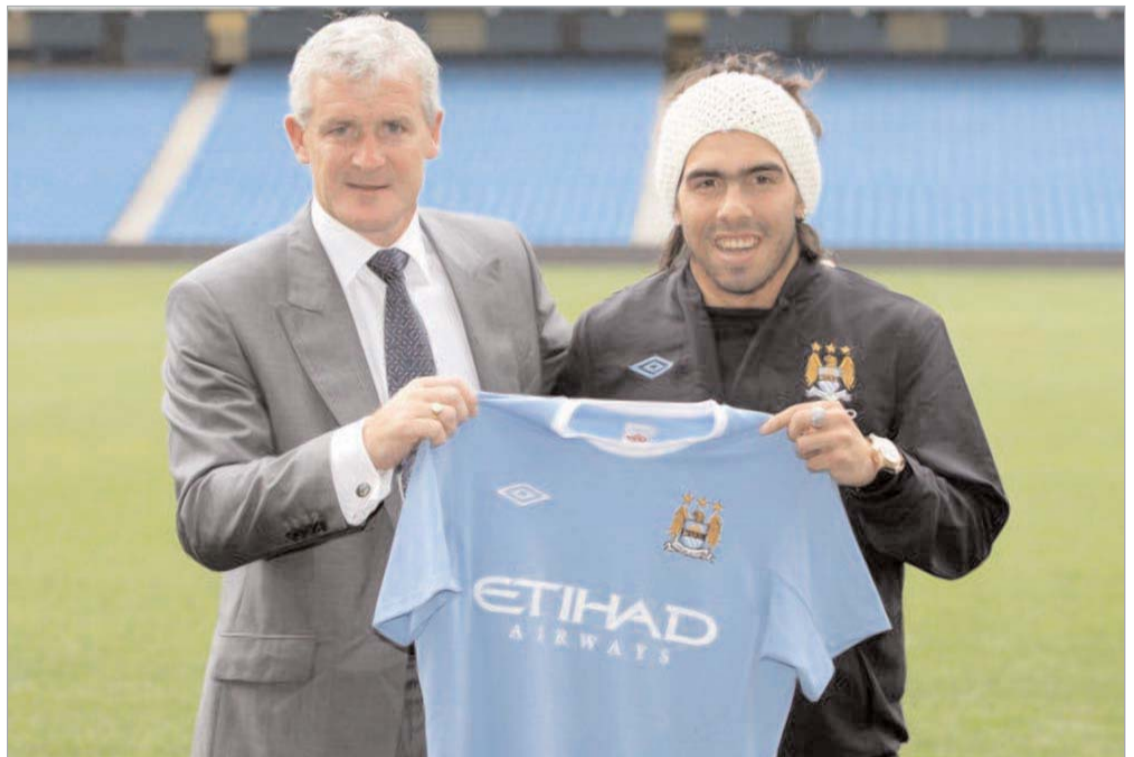
ტვესის ტრანსფერი ყველაზე ძვირი გამოდგა

დაიხურა სატრანსფერო ფანჯარა და ახლა უცხოურ მედიაში ხშირად საუბრობენ იმაზე, თუ რომელმა კლუბმა რამდენი დახარჯა. ამ მხრივ აშკარა რეკორდსმენია მადრიდის "რეალი", თუმცა, შევევით "სამეფო კლუბს", რადგან ამჯერად ინგლისურ პრემიერშიპზე გვსურს საუბარი.