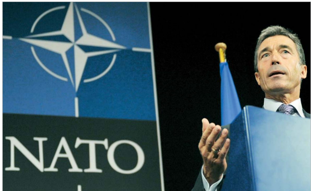
ანდერს ფოგ რასმუსენი: "ნატო არასდროს მისცემს მწვანე შუქს იმ ქვეყნებს, რომლებსაც სხვა ქვეყნების სუვერენიტეტის დარღვევა სურს"

დიმიტრი ავალიანი ჩრდილოატლანტიკური ალიანსი საქართველოს მხარდაჭერას კიდევ ერთხელ ადასტურებს. ნატო რუსეთთან ურთიერთობების გაუმჯობესებას აქტიურად ცდილობს. თუმცა ეს ახალი აგრესიისთვის "მწვანე შუქს" არ ნიშნავს, - ამის ხაზს გასმა ალიანსის გენერალურ მდივანს პირადად მოუხდა. იმავედროულად, ევროპის საბჭოს საპარლამენტო ასამბლეაში, შეასაძლოა, რუსეთისათვის ხმის უფლების ჩამორთმევის საკითხი დადგეს. ამის მიზეზი რუსეთის მიერ ასამბლეის იმ რეზოლუციების შეუსრულებლობაა, რომელთა უმთავრესი მოთხოვნა სეპარატისტული რეგიონების აღიარების გაუქმებაა.