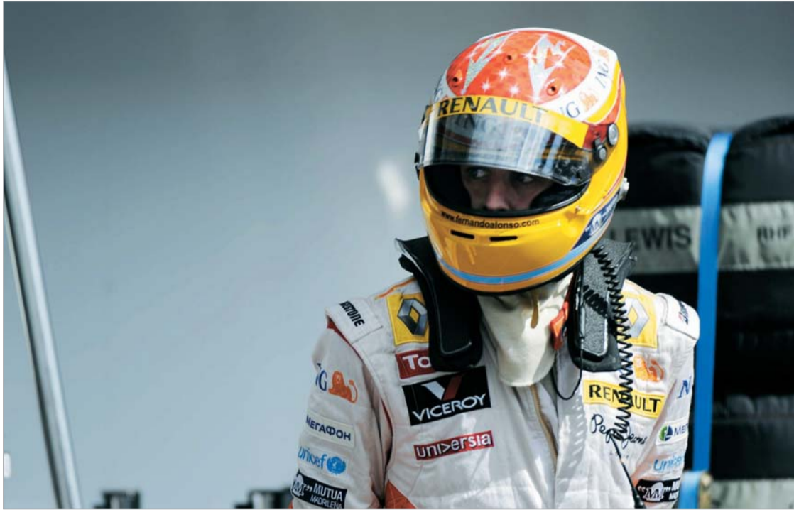
ალონსოს არჩევანი ჭერ არ გაუკეთებია. თუმცა საბოლოო გადაწყვეტილებას მალე მიიღებს

მიმოხილველები თვლიან, რომ ბრიატორეს ალონსოს გაშვება ხელს არ აძლევს, რადგან, ამ შემთხვევაში, "რენოს" სპონ-