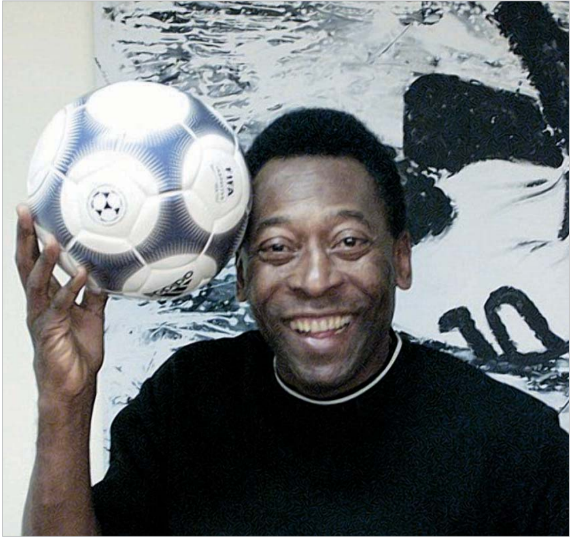
პელეს მარადონას გუნდის დამარცხების იმედი აქვს

მოახლოვდა მორიგი სამხრეთამერიკული დერბი. მსოფლიო ჩემპიონატის შესარჩევი ციკლის მატჩში ბრაზილიისა და არგენტინის ნაკრები გუნდები უპირისპირდებიან ერთმანეთს. ცხადია, წმინდა სატურნირო თვალსაზრისით ამ მატჩს განსაკუთრებული დატვირთვა არა აქვს. 2010 წლის მუნდიალის ფინალურ ეტაპზე რომ ორივე სამხრეთამერიკული გრანდი ითამაშებს, ეს ეჭვს არ იწვევს. თუმცა, რა შუაშია სატურნირო ცხრილი, როდესაც ერთმანეთს ხვდებიან ბრაზილიისა და არგენტინის ნაკრები გუნდები.