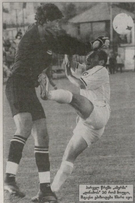
პირველ წრეში „ბორჯომი“ „დინამოს“ 2:0 რამ მოუგო, შტაბის გაბობლივებმა წარიყო

„დინამო“ — „ამერი“, „ჩინურა“ — „სიონი“ და „ბათუმი“ — „ტორპედო“: ეს გუნდები თონი დღის წინ სათასო მეთიხდენიან-ბა შეხედნენ ერთმანეთს, დღეს კი ჩემპიონატის მეოთხეხეტზე ტურნი მურჯანაძის დღეს კიდევ თონი თამაში კა, მაგრამ გემოვნებაზე ბევრს უკეთავეთი — გამოსარჩევი „დინამო“ — „ამერი“ და „ოლიმპიკი“ — „ხესტაფონი“.