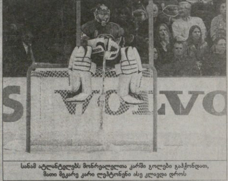
სანამ ატლანტიკის მონარქულითა კარმა ვიუსტი გაქვინდათ, მათი მტყავალი კარლ ფერბეინერი ასე ეკლავდა ღრის