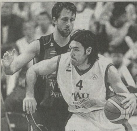
ლუის სკოლა ვეროლიეს ყველა დროის საუკეთესო ბოზმარდირი

მეორე ჯგუფური მატაჰი. მიწისზე ტურნი. 7-8 მარტი