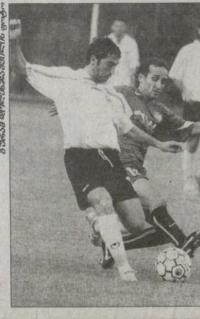
პირველი მატჩები 17 აპრილს