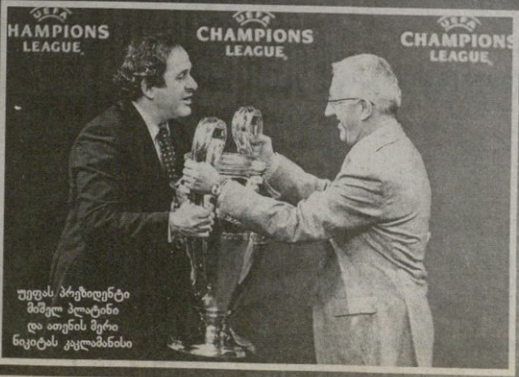
უფესს პრეზიდენტი მამულ პლატინი და ათენის მერი ნიკიტას კალკანასისი