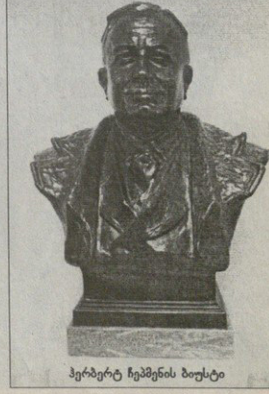
პერდუტ ჩემპიონის ბოსტო