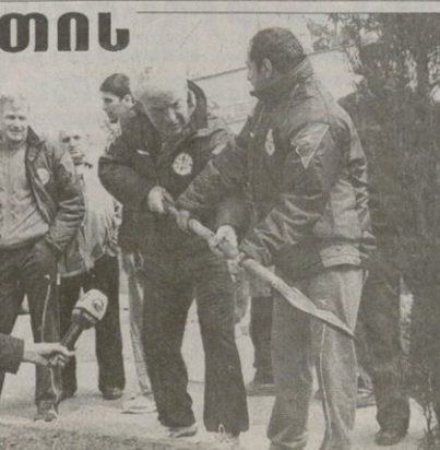
ახალი სეიონიდან, ფეხბურთის ხეივანი

ნიღარ ახალაკაცმა, კლავს ტიაში-ლერმს და ნაკრების ფეხბურთელმს ხეხეი დარეცს — ხეივანს ხეხეი შეემა-ტა, „დინამოს“ კი ის სიმბოლოება, რის გამოც სწორედ მის ბაზასთან და-არსდა ქართული ფეხბურთის ხეივანი.