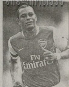
რან A-ში გადასვლის არც მისი ფერტი პაული ვილიანი გამოიხატეს.

ბრაზილიელმა ნახევარმცემელმა ფობერტო სიღვაძე განაცხადა, რომ საიმპონებოთი ითამაშებდა „იუვენუსში“. უკვე ხა ხანია, ტურნირები ლონდონის „არსენალის“ 30 წლის ფეხბურთელი არაინ დანტრესტეკელნი მას „მეოფეხბთან“ კონტრაქტი 2009 წლამდე კი აქვს, მაგრამ ფეხას ახალი წესებით, მუშაობა, თავი ორი წლის ხელფასის, ანუ 17 მილიონი ევროანების სანაცვლოდ გამოისყლოს.