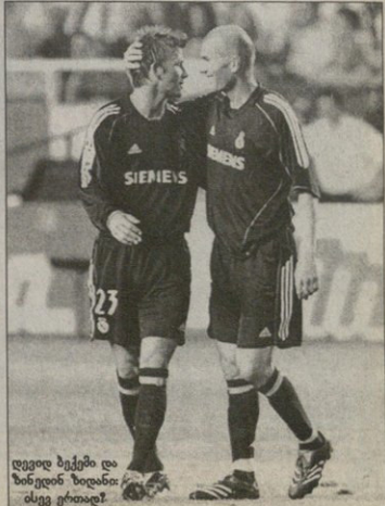
დვიდ ბეჭები და ზინდინ ზიდანის ძივე ერთად!

არ ვკვირდება ქვეჩანდ კაცი, რომელსაც დიდი ზინდინ ზიდანის მოედანზე ხილვა არ უნდოდა. ამის ახდენა, ანუ ფეხბურთიდან წასული ზიუის მიბრუნება ყველას არ ძალუძს, მაგრამ, კიდევ კარგი, არსებობს ხალხი, რომელთაც ეს შეუძლიათ და, რაც მოავარია, ფეხბურთს და მუშაობენ ამის გასაკეთებლად. ამერიკელი „ლიოს ანჯელეს ვალაქის“ დიდ ტრანსფერზე ფეხბურთს — დიდი მანსია, დიდი ზინდინ ზიდანის ფეხბურთის დაბრუნდეს და ამ კლუბის მისურა მოიგვოს. ფეხბურთის ლეგენდამ ამერიკელთა წინადადება უკვე იცის — ეროვნული კონტრაქტი სილიდერი გასამრეკლოთი. ფრანგს უარი არ უთქვამს და ახლა ყველაფერი მის საბოლოო პასუხზეა დამოკიდებული. მსოფლიო ფეხბურთი ახლა დასავლეთის შექმერებს: რას იტყვის ზიუ?