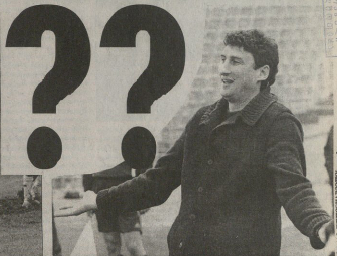
პაპია კითხვას ფოტო