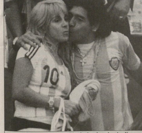
ლიგო მარაღონა კლუდიასთან ხელშეკრუე გახუტვის დარღობს...

მარაღონას პირადად ექიმს ადვრულო კაცე უგნაღობსტბითან შეხვედრისას აღიარა, რომ ფეხბურთის მეფეე ნარკოტიკები აღკობლით ჩანაცვლა.