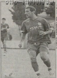
ჰერ, აპითაც გზანახში!