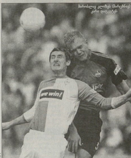
მარიალსკი კლოზის (მარცხენი) კარი დღეობის