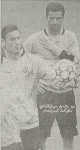
ფრანსეკო ტოტი და კრისტიან პანუჩი