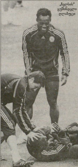
ჩელსის გამწადლი ოლაბუცი