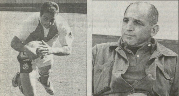
მაღალს ქვემოლი „ლელოების“ ლელოების თვალს ვერ აუღილია