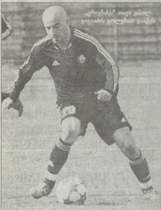
კრისტანო თავი ვასო გვიჩვენებს ფეხბურთით განკაცს

ტური ტურის მისდევს და სულ უფრო უახლოვდება ბუნდესლიგის ლეგან კობახიძის „მალე“, „სუპერბიშოპ“ აუტსაიდერი ავლაბისა და „დინამო“ ტურის ჩვენებას და შედეგულად ითამაშა და მართალია ფეხბურთში მონაწილეობა არ მთავარია, მაგრამ სავსაფაო აქტიური იყო.