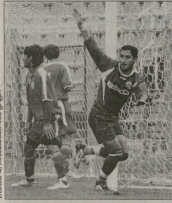
პირამ ვეროხანსიაზე, ვიტ ჯორჯია

საქართველოს თასს აღნიანად გამოითიუმლა „ვიტ ჯორჯიამ“ პირველი წრე შიორე ადგილით ჩაამთავრა, შიორეში კი ისე ველარ ჩაუტებს, მაგრამ მანინ აქვს მანის, ვეროტურნირზე თამაშში. ვიტ ჯორჯიასი შიოჯარი ახლა ის უნდა იყოს, რომ „სიონმა“ ან „ტორკლედი“ არ გადაასწონ და „ოლივის“ და „დინამოს“ „ზესტაფონი“ და „ამერი“ არ დაეწიონ. თუ ვეველაფერი ისე დარჩა, როგორც მე-19 ტურისთვისაა, შეხუთავდელისანი „ვიტ ჯორჯია“ ინტერტოტოს თასზე თამაშებს. „ვიტ ჯორჯიას“ ცხრილში ოთხი გუნდი უსწრებს, რომელთაგან ორმა, „ამერი“ და „ზესტაფონმა“ ინტერტოტოზე თამაშზე უარი თქვა, რომ არა ეს, ინტერტოტოს საჯური შესამადეველსანი შეხედებოდა. ნესტორ შუმბაძის გუნდმა ამ ტურში „მერანს“ ვერ მოუვლი, თუმც თუ მისანი ინტერტოტო, ამ ურით „ვიტ ჯორჯია“ დიდად არ დაზარალებულა.