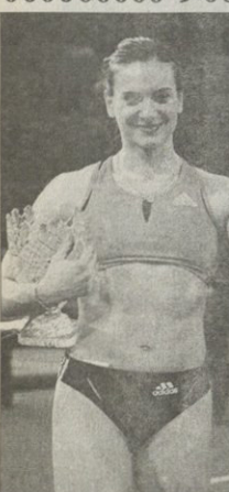
მანანა სინგაპურა „ოქროს ლიგის“ ექვსე ტურნირში მონაწილეთა ვანუზნახავს, რომლის პროგრამაშიც ქალთა ჭოკით ხტო-

მა წლეულს პირველად შეიტანეს „ბედნიერი ვარ, რომ ჩემი დისციპლინა „ოქროს ლიგის“ პროგრამაში მოხვდა — ამბობს მსოფლიოს რეკორდსმანი — ეს ძალიან პრესტიჟული ტურნირია მინდა, რომ ექვსე ტურნირში მონაწილეობით ვეცაობი მოეხსნა. ეს თილი არ იქნება, რადგან წლეულს მსოფლიოს ჩემპიონატზე ტარდება და ძალიან გრძელი სეზონი ვეცნება“. წლეულს „ოქროს ლიგის“ მილიონდოლარიან საპრიზო ფონდს მხოლოდ ის სპორტსმენები ვინაწილებენ, რომლებიც ექვსე მტაპს მოიგებენ.