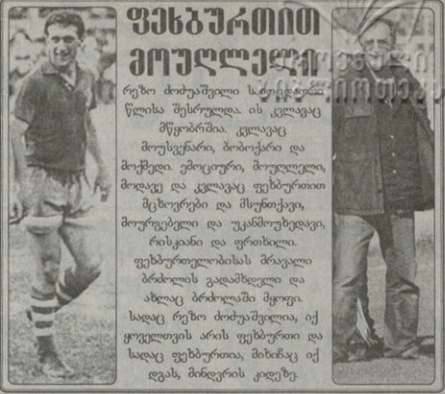
საფეხბურთო კლუბი „ოლიმპი“ დაბადების დღეს ულოცავს 62 წლის სახელოვან ქართველ ფეხბურთელს...