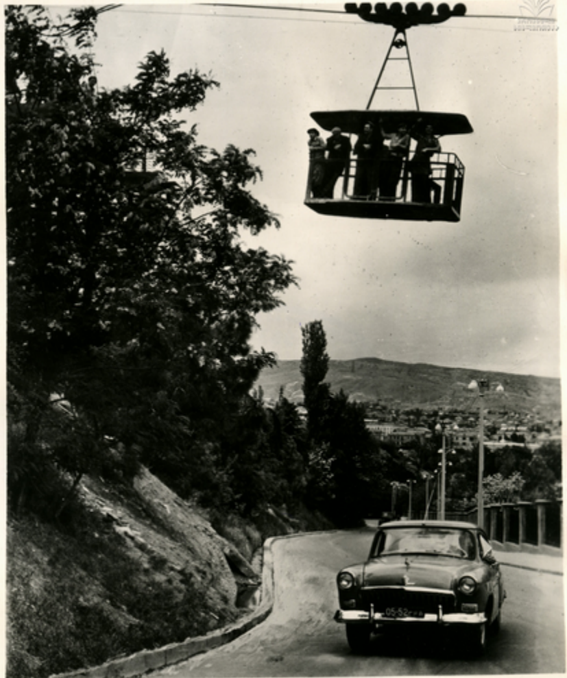
საქართველოში დასრულებულია მთიანეთში—საბაქალაქო და რიონში შენობა-ნაგებობების საპროექტო მუშაობა.