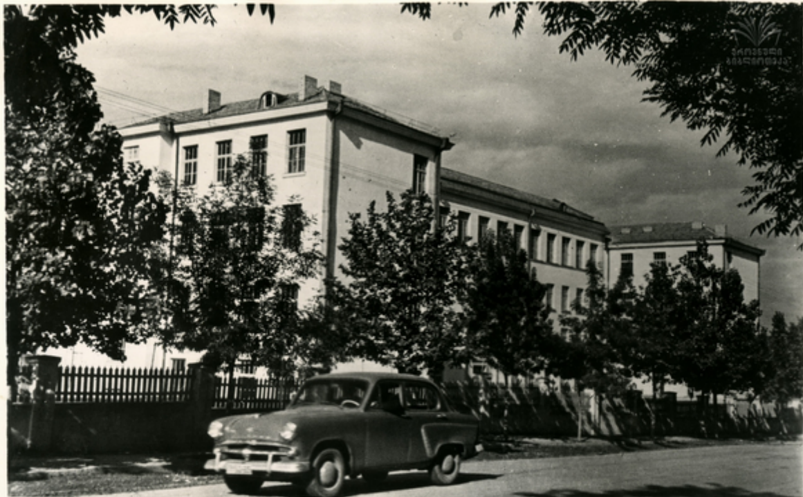
აიღონად სანსა ნითიდწყაიროთი სანქსლოვანთოთო ბაღანთა სანქალო სოლონ ანალი შანოგა. სანაითუბ: ანალი სოლო.