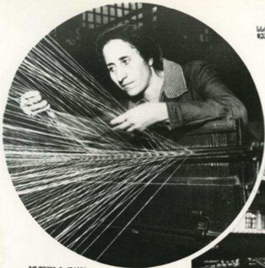
მსოფლიო ს. კახიანი.

ვათაისში, სარაი წინათ აა იყო აკმ ვაკით მსხვილი სანაკრძო, სავაჭოთა ხალიშუღაგის დეგბი ახანდა მძიგა, მსაგაში და კვების მკანდალოგის ათოგით ქახანა და შუბაკიკა. ქალა- ეის ყვალაზა მკვილი სანაკრძო მადრის შუბაკიკა, კომბალიშ აგებულ იქნა ჯაკ კილევ 1923 წელს.