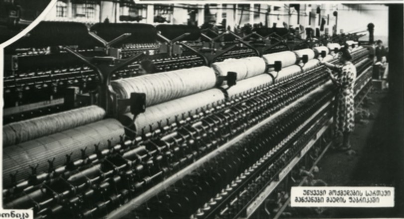
შუბაკიკის მუგოტეონის სკა კახიანი მკანდალოგის მკანდალოგის