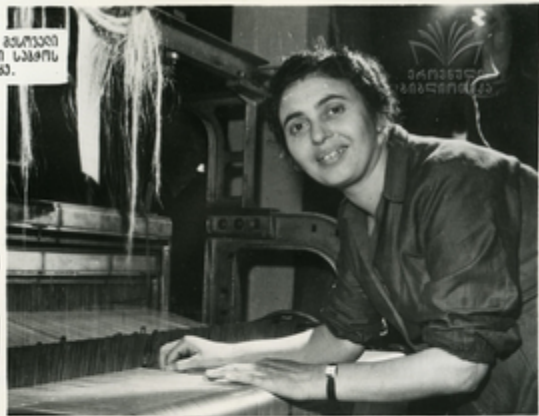
მსოფლიო ს. კახიანი

შუბაკიკის მუგოტეონი სკა კახიანი, შუბაკიკის სკა მკანდალოგის მკანდალოგის.