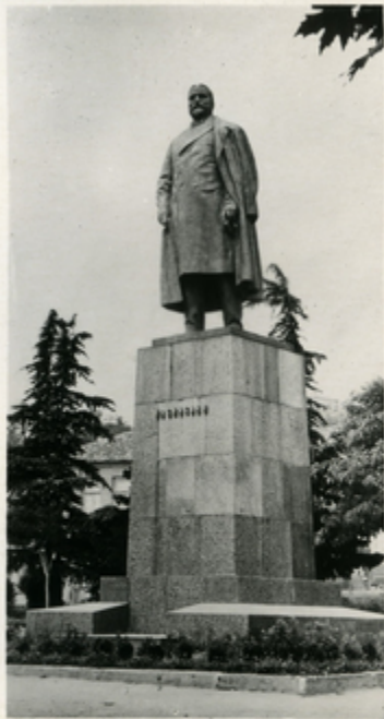
ვ. შავშვილის ძეგლი