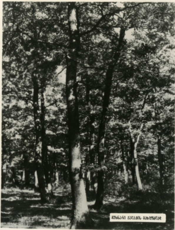
ბუნარი ძალიან მარტაბი

შუთისნაღვრი აბაჟოვან აკა მარტო თაჟისი ჟალაჟით, აკაჟეჟი შისი ლაბაჟი მირაჟოვანითაჟ—მარტოღალთა ლანჯა- ნაგის საყვარელი ადგილავით.