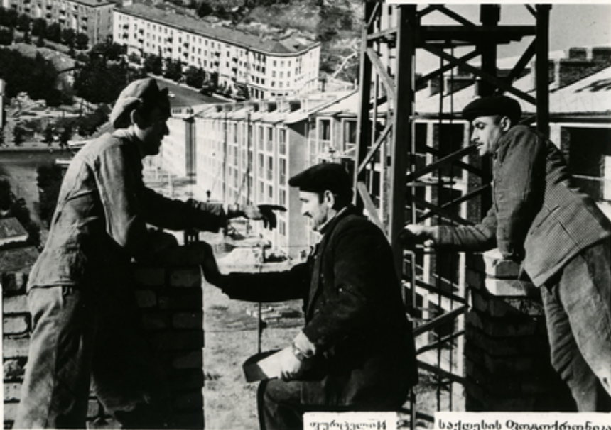
მუშაკები ქობულეთში მშენებლობის სამუშაოებზე.

ქართული შრომის უკონო ნაყოფებს სანახევრო მშენებლობა. უკვე აღმოცენდა მშენებელთა მუშაობის შედეგად მრავალსართულიანი სასახლეები ქობულეთში. ქალაქის მშენებელთა ასოციაციის მხარდასაჭერად უკვე დაიწყო მშენებლობის სამუშაოები.