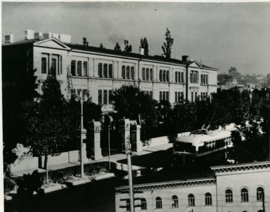
ქართული კარგო იური ინსტიტუტი.