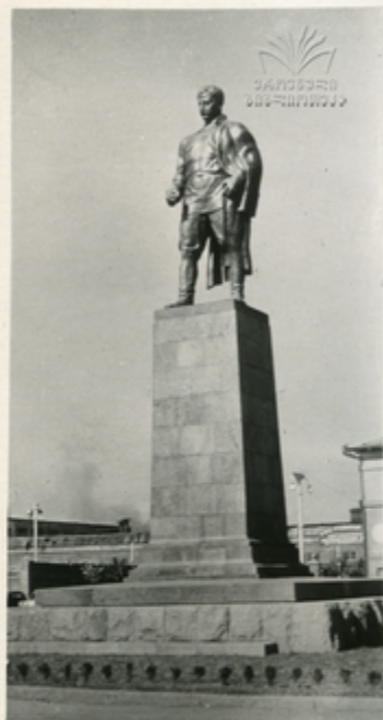
ს. შავშვილის ძეგლი ვაჟა-ფშაველას ძეგლი

ვაჟა-ფშაველას ძეგლი, შიშინძის ძეგლი, გიორგი მეგრელის ძეგლი, ვაჟა-ფშაველას ძეგლი