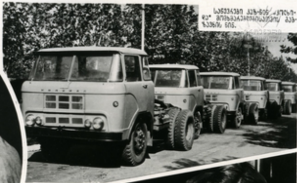
სარეზინო ბაიბაძე და სხვანი სარეზინო- ცენტრს.