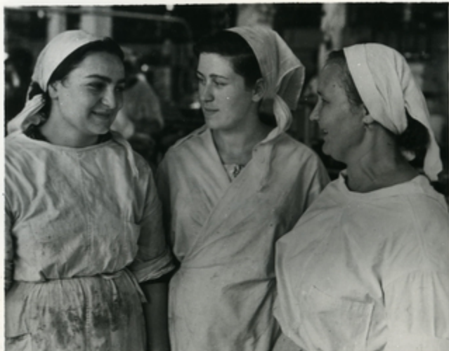
საქართველის მრეწველთა საბჭოთავო ინჟინერების სკოლა.