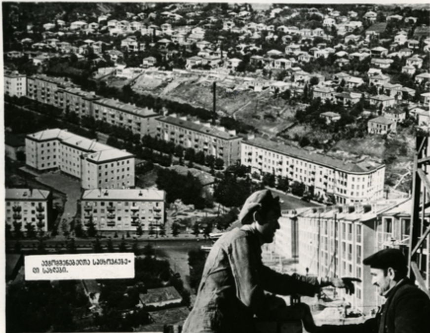
უკვე მთავრდება ბათის საბავშვო სასახლე.

ქართული შრომის უკონო ნაყოფებს სანახევრო მშენებლობა. უკვე აღმოცენდა მშენებელთა მუშაობის შედეგად მრავალსართულიანი სასახლეები ქობულეთში. ქალაქის მშენებელთა ასოციაციის მხარდასაჭერად უკვე დაიწყო მშენებლობის სამუშაოები.