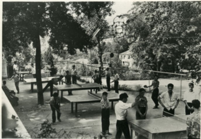
ზაფხულის დღეებში ქალაქის ბაღები და პარკები ივსება ნოაჩი ქუთაისელებით, რომლებიც მოდიან აქ, რომ მხიარულად გააფარონ დრო. სურათებზე: კლუბისა და დანებების პარკში.