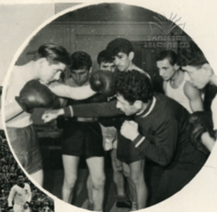
სპორტის მსახურების მუშაკნი სპორტის

ქართული მომხრეებს სპორტის ნაგებობათა მთელი ქსელი. ქალაქის შიდა სპორტის სანაღი მსოფლიო არსობის რვა კანკალიაში, ისე მის შიდაგანს ბაკათა. ს. ოკროშინიძის სანაღი ავსტრალიაში ჩამოყალიბდა სპორტის ქსელი „კოლხე“, სარე მემორიალურს ასობით ახალგაზრდა მხვა. მანსაქობათაში თყვართ ქართულიებს შინაგანათა ბუნის „სპორტის“, არბალის ნაღს პირველად გამოდის „ა“ ქალაქი,