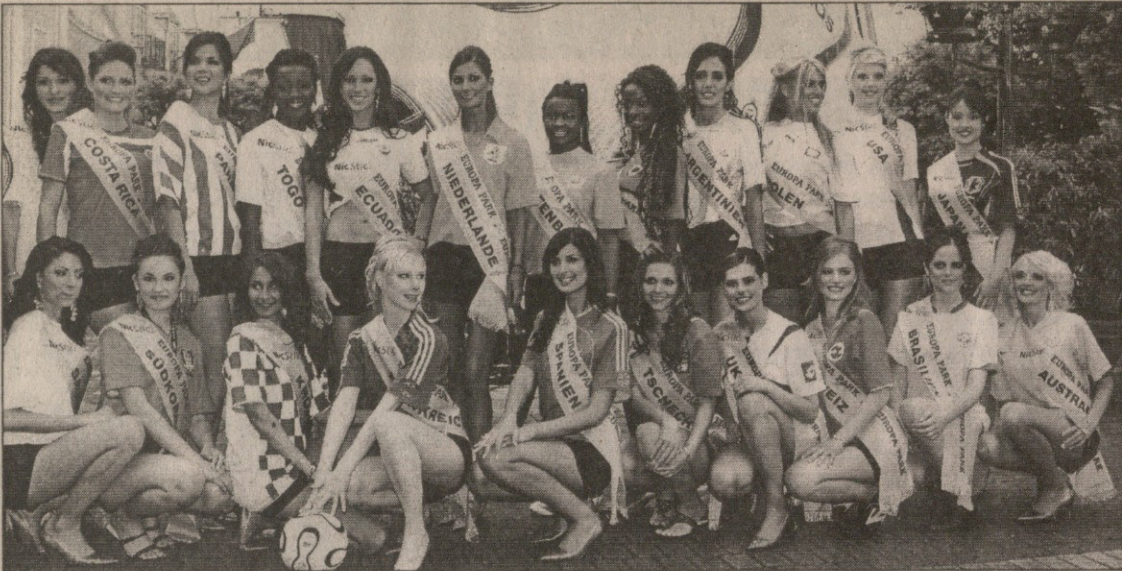
ქალთა სახეები გერმანია 2006-ზე