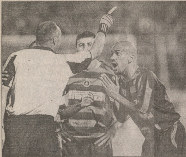
ვერონის იტალიელ მსაჯებთან კამათი აღარ მოუწევს

სუან სებასტიან ვერონმა ხანგრძლივი ფიქრის შემდეგ, როგორც მოსალოდნელი იყო, თავისი ოჯახის სასარგებლო გადაწყვეტილება მიიღო ანუ სამშობლოში ბრუნდება და კარიერას იქ დაასრულებს. „ბოლო 10 დღის მანძილზე ამ საკითხზე ძალიან ბევრი ვიფიქრე და საბოლოოდ გადაწყვეტილებაც