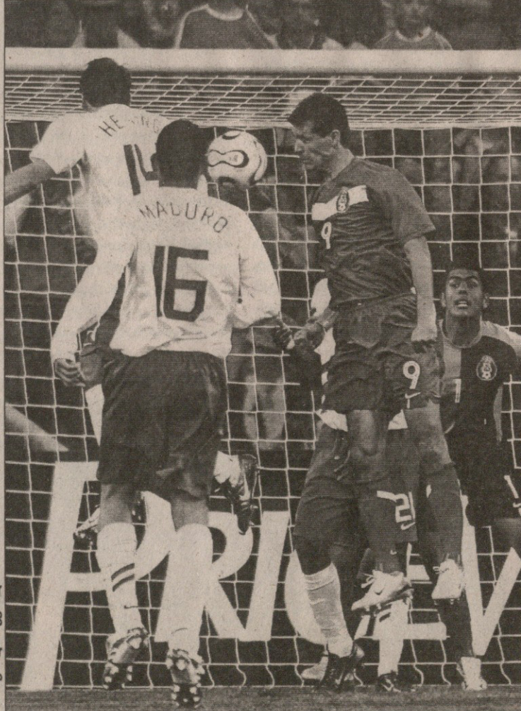
რიკარდო ლავოლპემ მექსიკელებს კი შეუძახა, მაგრამ...