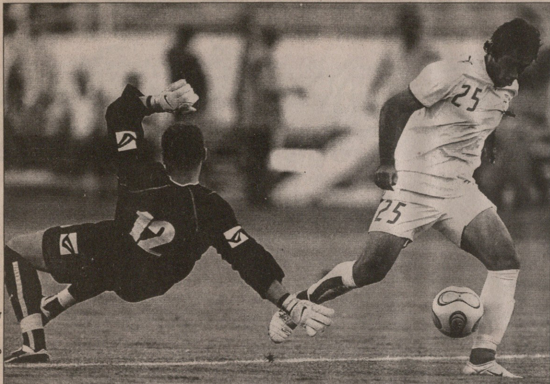
მადანი ბოსნიელ მეკარეს გასცდა

ირანი 5:2 ბოსნია 0:1 მისიმოვიჩი (4), 0:2 ბარბარესი (17), 1:2 მადანი (26), 2:2 რეზაი (44), 3:2 შამსიანი (45), 4:2 ენაიათი (89), 5:2 ხატიბი (90)