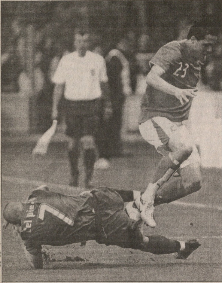
დელ პიერო დალლილი ჩანდა

შვეიცარია 1:1 იტალია 0:1 ჯილარდინო (11), 1:1 გიგაქსი (32) შვეიცარიები: ცუბერბოლერი (კოლტორტი 46), ფ. დეგენი, ჯირუ, მანინი (შპიხერი 46), სენდეროსი (გრისტი-ნგი 70), ბარნეტა, კაბანასი (მარგარიაცი 46), ფოგელი, ვიკი (პ. იაკინი 62), ფრეი, გიგაქსი (დ. დეგენი 90) შვეიცარიები: იაკობ კუნი