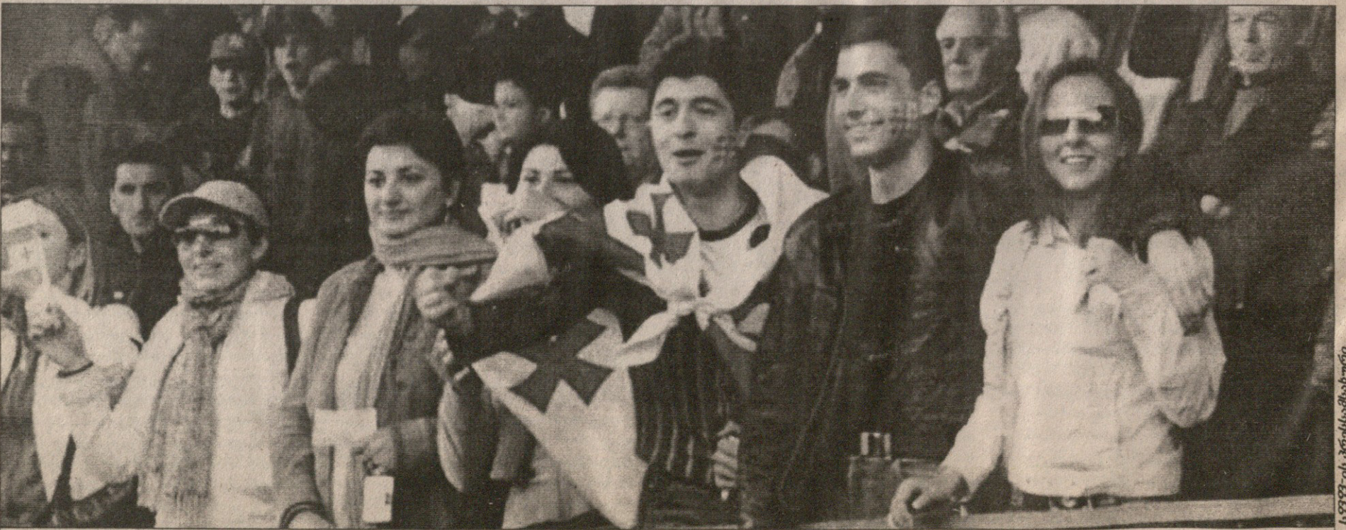
„ავსტრიელმა“ ქართველებმა დორნიბირში ჩასულ საქართველოს ნაკრებს გულშეურვალედ უქომაგეს