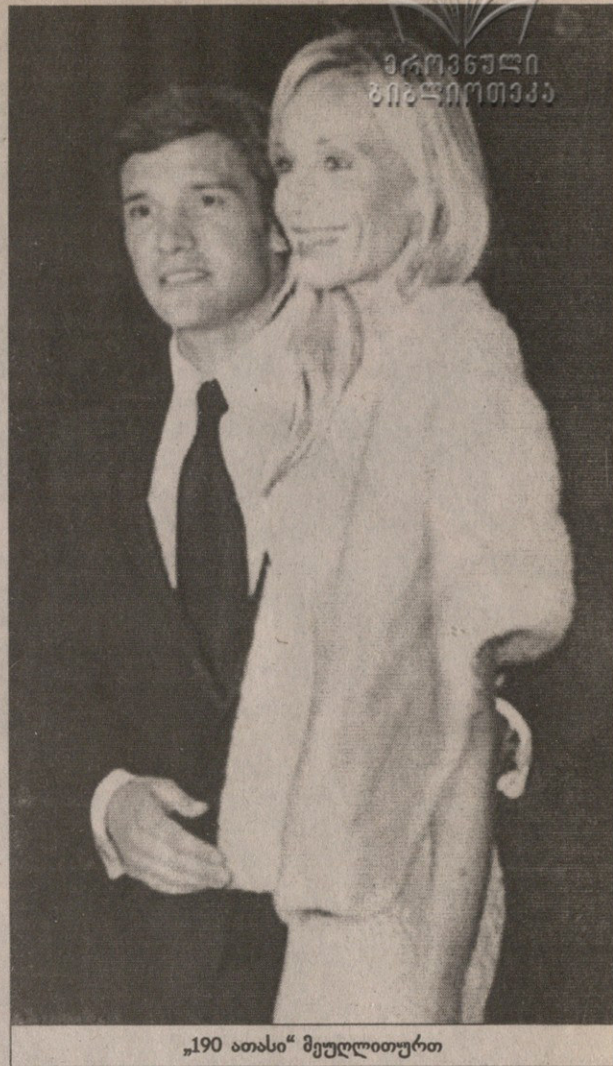
„190 ათასი“ მეუღლეთურთ