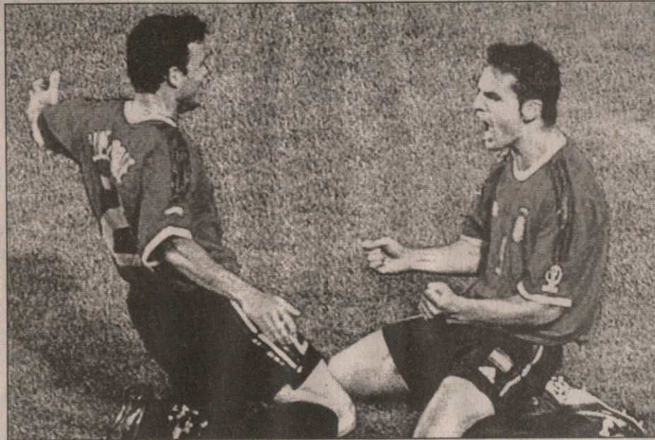
2002 წელი. მორიენტესი ირლანდიის კარში გატანილი გოლით ხარობს