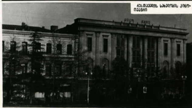
ახ. ჭავჭავაძის სახელობის კინო- თეატრი

მკვლევარებმა შეამოწმეს კლასიკური თეატრის შენობა. შენობაში 11 თეატრი, 45 კინოთეატრი და კინოლენდები, სიკინო, სახეობის- ში უილანობის, 30 კლასიკური სახლი და კლასი. ამჟამად კი რა- ღებობა იხილი იხსნება მკვლევარებში. საქმის ფოტოქრონიკა.