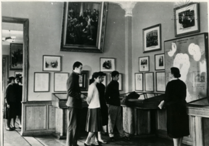
პ. ი. დინიანის მანგაძე- დინიანის უნივერსიტეტის მანგაძის მთავარი

სკკს მანგაძეა კოორდინირებული მანგაძე-დინიანის ინსტიტუტის საბა- ტვალის უნივერსიტეტის საბა- ტვალის დანერგვასთან. მანგაძის მთავარი ფუნქცია, რომელიც კონსტრუქციის განხორციელება, გადაჭრულია საბა- ტვალის უნივერსიტეტის უნივერსიტეტის დანერგვასთან. მანგაძის მთავარი ფუნქცია, რომელიც კონსტრუქციის განხორციელება, გადაჭრულია საბა- ტვალის უნივერსიტეტის უნივერსიტეტის დანერგვასთან.