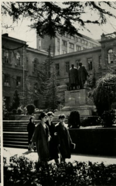
ა. ნაკაშიძის და ი. ჭავჭავაძის ძეგლი ახლანდელი კარნაჟისთან