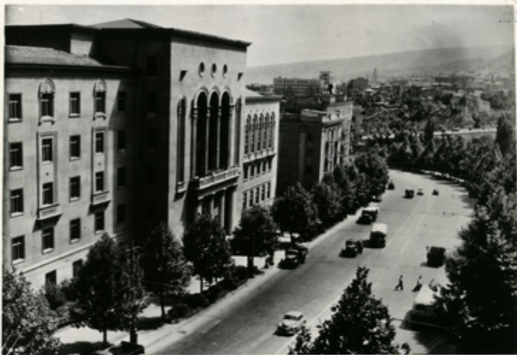
3. ი. ლენინის სახელობის ქუჩა სუბარ- თველეს დედაქალაქის პატ-პათი უღაბაჟანი ბაზისგალია. სუათაბა: ლენინის ქაჩაჟა.