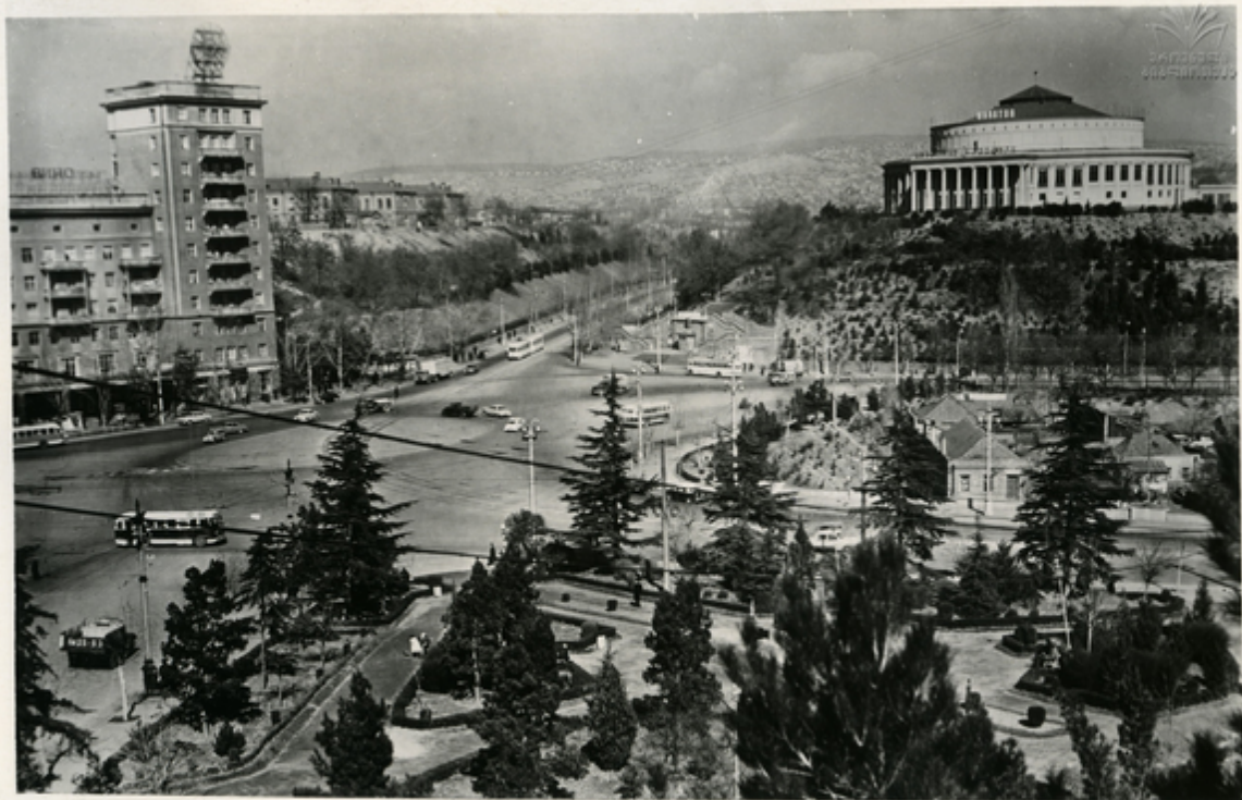
გზიკთა მოძრენის რა სახელმწიფო სიკიის ხელი