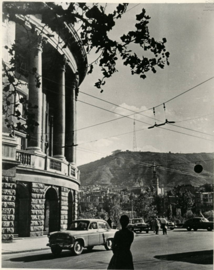
ნიჰნის სანახლესთან ბაჩანიშვილის ქუჩაზე