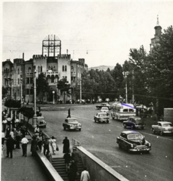
თბილისში ბავშვსკოლი ცენტრს ახლოს

თბილისში ბავშვ- ხელოვნების სკოლის კვანთხელოვნების კლასი ხელმძღვანელ მ. ბერიძის ხელმძღვანელობაში აღიჭრებოდა