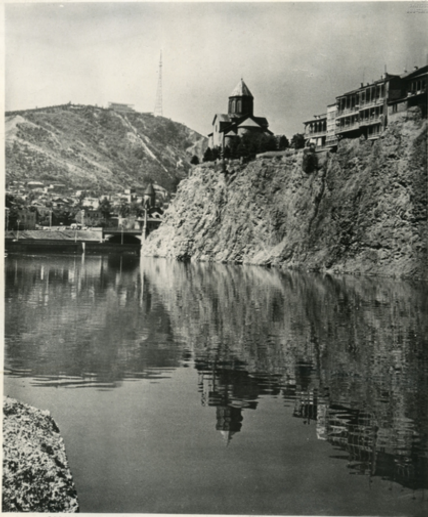
მეფის ტიხა XVII საუკუნეში საქათვალს მეფის კურორტი იყო, შემდეგ კი საქათვალს კათალიკოსის საყრდენი ადგილი. XIX საუკუნის პირველ ნახევარში ახალი მეფის მთავრობამ მეფის სასახლეა და მისი საყრდენი საქათვალი: მეფის ტიხის ხეივანი.