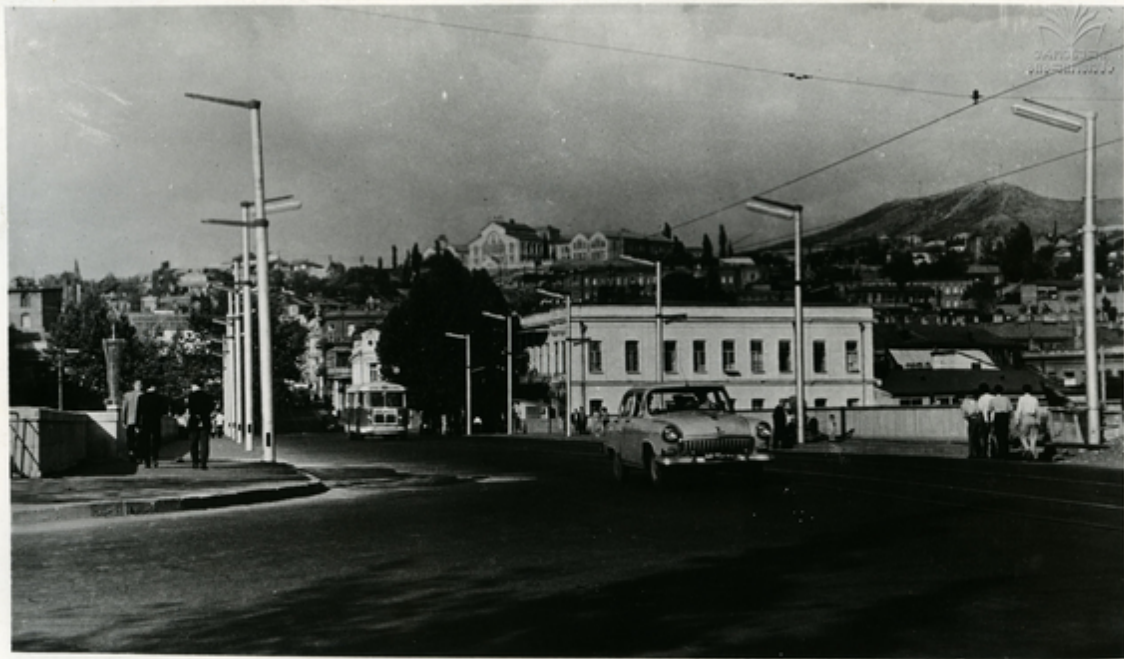
აკონსტრუქციული ხილისა და კაბე მაქსის სახელობის მოედნის ხელი