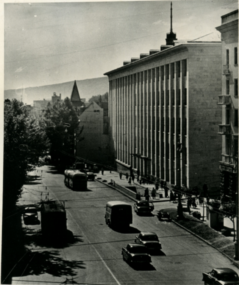
შენახავა გეგმითი სივყვის კოზინავთან ღანიის ქარაზი