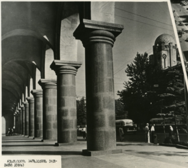
აღმოსავლელი კონსტრუქტორების საქართველოში

მთელი აღმოსავლელი სახელმწიფოს კონსტრუქციონერი-თავიდან დაიწყო საქონის მუშაობა. ეს მუშაობები იყო აკადემიკოსების მხრივ მუშაობები მუშაობები: საბაგრატიონის სსკ მუშაობების სახელი, სასაგრატიონის „თავიდან“, კავშირგაბმულობის სახელი, სსკ მუშაობები კონსტრუქციონერების მხრივ-დასაწყისის ინსტიტუტის საბაგრატიონის უნივერსიტეტი, მუშაობები და კონსტრუქციონერი.