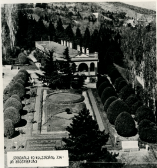
ჯანსაღისა და რასხვეთის ხანა- ბი მთაწმინდისა

აღიშთ მთაწმინდისა—თბილისის ათ-ათ თვალნაკ- ვან ადგილსა. მის ზედასოგზა აგებულთა ვანთოფონი, სარან განისკვნეგანს ვანთვალთ ხალხის საუკეთესო შვილანი. მთაწმინდა წლითიწლოგით მშვენიერავსა. მის მწვანეკვალსა გაშვენებულთა კვლავისა და რასხვეთის მშვენიერანი კაკი.