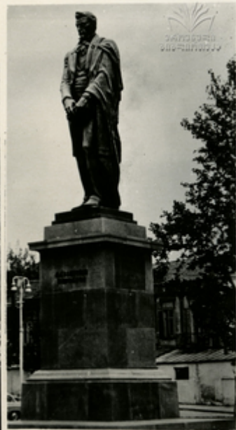
ა. ს. მელიქიძის ძეგლი

საქართველოს დემოკრატიის შე- ჩენის, პაჩიკის, სპეკიანის, მოურნის აგების ძეგლები.