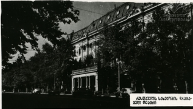
ახ. ჭავჭავაძის სახელობის, რაბა- ძის თეატრი