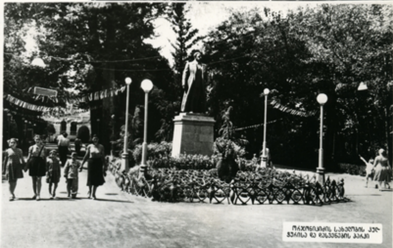
თბილისის სიბდაყდა კარ- გადალი და დასვენების პარკი