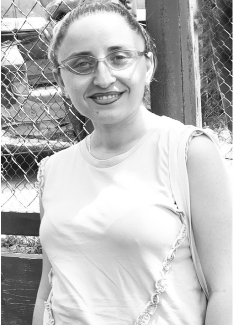
სიათის რა ნიშან-თვისებები გამოგვკვამ?

- მიუხედავად იმისა, რომ პირველივე მცდელობაზე სამედიცინოზე ჩავირიცხე, ეს არ იყო ჩემი არჩევანი. ბავშვობიდან უფროსის ტიტულს მიტაცებდა, სხვა პასუხი არასოდეს მქონია, როდესაც მეკითხებოდნენ, ვინ მინდოდა გამოსულიყავი. ახლობლებმა, მეგობრებმა გადაამარწმუნეს, რასაც სისუსტედ ვთვლი. არ უნდა დამეთმო ჩემი პოზიცია. ტრადიციულ, ძველმოდურ ოჯახში ვიზრდებოდი, სადაც უფროსის ტიტულს არ ითვლებოდა ქა-