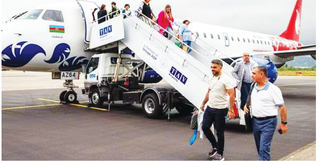
თულებები. ივნისის თვეში 300-ზე მეტი ავიარების შესრულება 13 ქვეყნიდან. აღსანიშნავია, რომ ბათუმს კიდევ ერთი მიმართულება „ბაქო-ბათუმი“ დაემატა. პირველი ავიარების რეგიონში 100-მდე ტურისტი ჩამოვიდა. ფრენები ზაფხულის