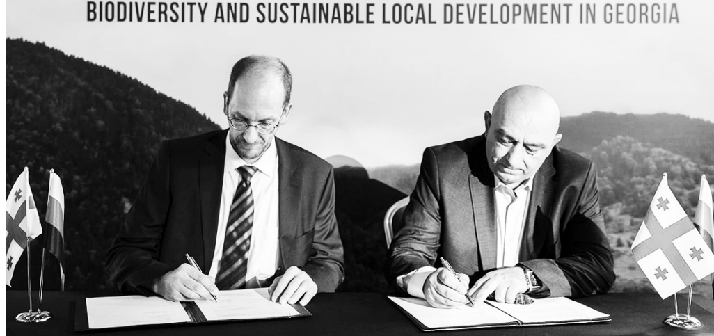
BIODIVERSITY AND SUSTAINABLE LOCAL DEVELOPMENT IN GEORGIA