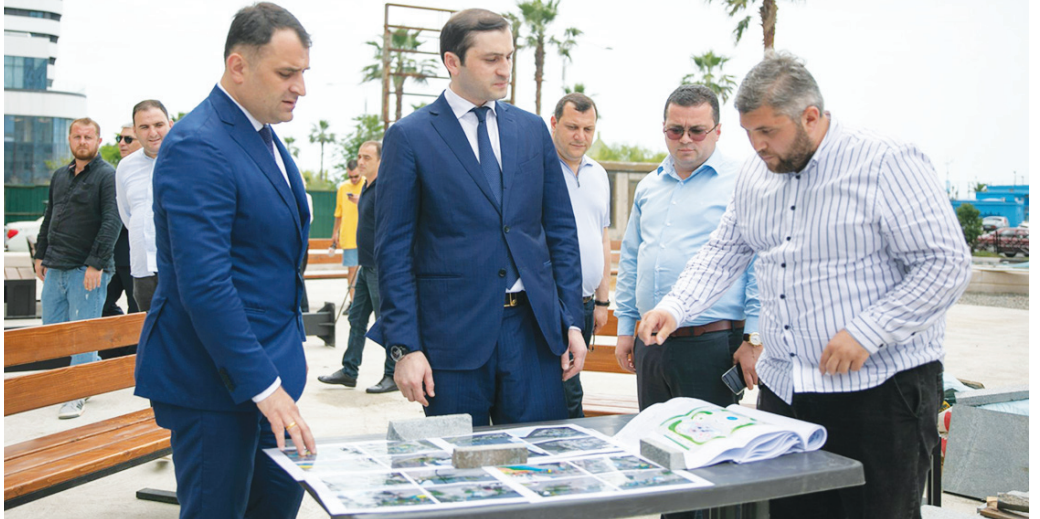
ით, ძალიან მალე აქ მცხოვრებ 1000-მდე ოჯახს გაუჩნდება ახალი საზოგადოებრივი რეკრეაციული სივრცე. მოსახლეობის თხოვნა, რომ მომიჯნავე მიწის ნაკვეთზე არ განხორციელებულიყო ინტენსიური მშენებლობა, სრულად არის გათვალისწინებული. აღნიშნულ მიწის ნაკვეთზე კოე-

წელს ბათუმში 10 ახალი სკვერი მოეწყობა. დასკვნით ეტაპზე შეიქმნა ხიმშიაშვილის ქუჩაზე სკვერის მოწყობის სამუშაოები. აქ სამშენებლო კომპანია „ილიჩინს“ მრავალსართულიანი კომპლექსის მშენებლობაზე უარი ეთქვა იმის გამო, რომ დარღვეული ჰქონდა აჭარის მთავრობასთან გაფორმებული სახელშეკრულებო ვალდებულებები. ახალი სკვერის მშენებლობა მოსახლეობის ინტერესების გათვალისწინებით დაიწყო. პროექტის ფარგლებში მოეწყობა სანიადრე და გარეგანათების სისტემები, ბორღურები და დეკორატიული ღობე, დაიგება გრანიტის საფარი და მწვანე კორდი, აშენდება შადრევანი, დამონტაჟდება საბავშვო ატრაქციონები, დაიდგება დეკორატიული სკამები და სანაგვე ურნები. სამუშაოებზე 1 888 887 ლარი დაიხარჯება და იგი ავვისტოში დასრულდება. ახალ სკვერში მიმდინარე სამუშაოები აჭარის მთავრობის თავმჯდომარე თორნიკე რიჟვაძემ ქალაქ ბათუმის მერთან არჩილ ჩიქოვანთან ერთად დაათვალიერა. „დღეს კიდევ ერთხელ გავცანიტ „მაკდონალდსის“ მიმდებარე ახალი სკვერის მშენებლობის პროცესს. როგორც მოსახლეობას დავპირდ-