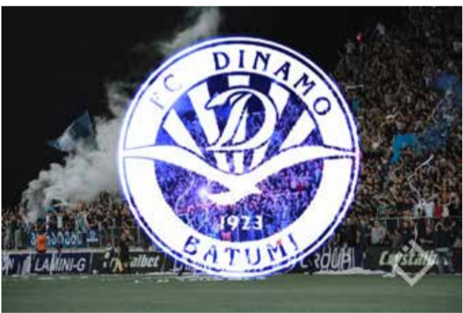
ახლა მთავარი ის არის, მოახერხებს თუ არა პირველ ორ ეტაპზე მაინც გუნდის დახმარებას ხვიჩა კვარაცხელია. მოგეხსენებათ, საქართველოს ნაკრებისა და

საქართველოს ჩემპიონი ბათუმის „დინამო“ ჩემპიონთა ლიგის საკვალიფიკაციო ეტაპზე მეტოქის მოლოდინშია. კენჭისყრა მალე გაიმართება და აჭარული კლუბიც შეეცდება გულშემატიკივარი გაახაროს. ხუმრობა ხომ არ არის, „დინამო“ ევროთასის ერთ-ერთ ჯგუფურ ეტაპს უმიზნებს და თუ ეს ჩემპიონთა ლიგა იქნება, გვერნმუნეთ, მთელი საქართველო ფეხბურთით იცხოვრებს. ბათუმელები პირველი საკვალიფიკაციო ეტაპის პირველ შეხვედრას 5/6 ივლისს ჩაატარებენ, საპასუხო მატჩი 12/13 ივლისს გაიმართება. უდიდესი ალბათობით, გია გეგუჩაძის გუნდი პირველ ეტაპს დაძლევეს, მეორე ეტაპზე მატჩები 19/20 და 26/27 ივლისს გაიმართება, მესამე საკვალიფიკაციო ეტაპი 2/3 და 9/10 აგვისტოს შედგება, ჯგუფში გამსვლელი პლეი-ოფები კი 16/17 და 23/24 აგვისტოს.