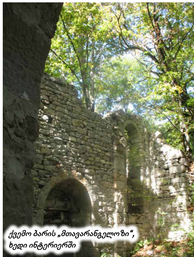
ქვემო ბარის „მთავარანგელოზი“, ხედი ინტერიერში

ამ საუკუნის დასაწყისში „მრავალძალი“, დასასრული მე-16 გვერდზე