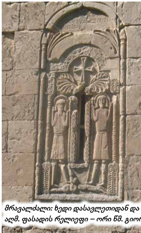
მრავალძალი: ხედი დასავლეთიდან და სამხრეთ-აღმოსავლეთიდან; აღმ. ფასადის რელიეფი – ორი წმ. გიორგი; ტაძრის წარწერა

ასეთ თეოფუნქციურ გადანაწილებაში, შეიძლება ზოგიერთი გაურკვევლობაც არის მაგრამ მათი განხილვა შორს წაგვიყვანს, თანაც ამ საკითხს, ასე თუ ისე, კვლავ შევეხებით.