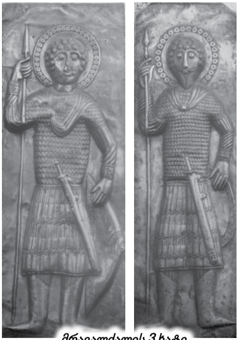
მრავალძალის 3 ხატი

ასეთი ტაძრების ხილვისას, ყოველთვის გიჩნდება სურვილი გაიგო მის დამკვეთისა და ამგების ვინაობა. ეს სურვილი უმეტესწილად შეუსრულებელია, ახლა კი, ვფიქრობ, ასე არაა. უცვლელი სახით დარჩენილ აღმოსავლეთ ფასადზე, ტაძრის უმთავრესი სარკმლის ორსავე მხარეს თითო-თითო კაცის ფიგურაა სრული ტანით. მათ თავზე შარავანდი ადგათ, მოკლე, სარტყელშემოჭრილი კაბა მოსავთ და ვინრო მოგვები აცვიათ ფეხზე, ცალი ხელით იქედნესა და დიოკლიტიანეს კლავენ შუბით, მეორე ხელით კი, მისიის აღსრულების ნიშნად, აქვთ აღმართული. საპირისპიროდ მყოფი მხედრების შემთხვევაში წმ. გიორგისთან და წმ. თევდორესთან გვექნებოდა საქმე, აქ კი ორივე ქვეითია და თანაც ერთნაირი. აქ ორი გიორგი – მთავარმონაპე და თეთრი გიორგი ხომ არ იგულისხმება? ამ კომპოზიციის ქვეშ არსებული ნარწერა ასეთია: „ქრისტე, წმინდა გიორგი, შეიწყალენ კეთილად მოღვაწენი ამის ეკლესიისანი“. სარკმლის თავზე მდებარე ქვაზე ამოკვეთილია ჯვარცმის სცენა ქრისტეს, ღვთისმშობლის, იოანე მოციქულისა და ორი ანგელოზის გამოსახულებით. ჯვარცმის ქვეშ თმანვერიანი მოხუცის თავია (სავარაუდოდ ადამის), ხოლო ჯვარცმის ზევით – ნარწერა: „ქრისტე, შეიწყალენ ნიკოლოზი“. ასეთ გამორჩეულ ადგილზე რიგითი პიროვნების სახელს არავინ ჩასვამდა. ის ტაძრის ქტიტორი და უთუოდ საერო კაცია, დიდი ალბათობით, ფარახეთის ხევისთავია (თუ რატომ ფარახეთისა, ოდნავ ქვევით ვიტყვი). ქტიტორის გარდა შემონახულია ხუროთმოძღვარ – კალატოზის სახელიც. სამკაულიან სარკმლის საპირეზე, რომელიც 1894 წელს აგებულ სამრეკლოს სამხრეთ კედელში ჩაუდგამთ, წერია: „წმინდა გიორგი, მეოხ ეყავ კალატოზსა იოვანესა“.