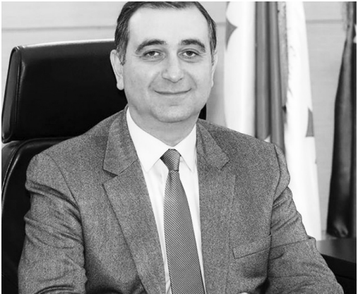
მობს მასწავლებელთა ტრენინგების ორგანიზებასა და სასწავლო რესურსების მომზადებას. - გადამზადდება საქართველოს ყველა სკოლის ჭადრაკის პედაგოგი და დარწმუნებული ვარ, რომ სექტემბერში როგორც მოსწავლეები, ასევე მასწავლებლები მზად შეხვებიან ამ პროცესს, - აღნიშნა საქართველოს ჭადრაკის ეროვნული ფედერაციის პრეზიდენტმა გია გიორგაძემ.

სავალდებულო საგნად ჭადრაკის შესწავლა 2022-2023 სასწავლო წლის სექტემბრიდან იგეგმება, მანამდე კი აღნიშნულისთვის მოსამზადებელი სამუშაოები მიმდინარეობს, რაც გულისხმობს