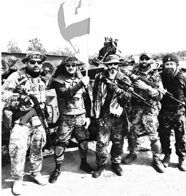
დღემდე ჩვენ გვერდით იმყოფება - გაზრდილი ყველა მხრივ. დღეს უკვე თითოეული ნამდვილად სახიფათო მტრისთვის იმითმ, რომ დღეს უკვე თითოეულმა დანამდვილებით იცის, რა, როგორ და როდის უნდა გააკეთოს. მესამე თვე იწურება. მონატრება სულ უფრო და უფრო ეპარება გულსა და გონებას. მიუხედავად მომავალი სირთულეებისა, რომლებშიც აუცილებლად გავყოფ თავს, პირველ რიგში იმითმ, რომ ჩემს

პირველი დღეები ყოველთვის მეტად ემოციურია. უამრავი საინტერესო და სახიფათო რამ გავიარეთ. თითოეული ქართველი ბიჭი, რომელიც აზრზე არ იყო ამ პროცესის და