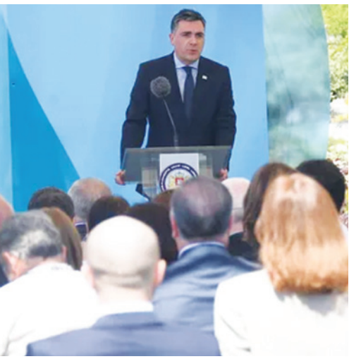
ია დარჩიაშვილმა დიასპორის დღისადმი მიძღვნილ ფორუმზე - „ქართული დიასპორა საქართველოს ევროპული მომავლისათვის“ გამოსვლიას. მან საქართველოს განვითარებისა და ქვეყნის პოზიტიური იმიჯის წარმოჩენის საქმეში, ისევე როგორც ევროინტეგრაციის პროცესში, ქართული დიასპორის ჩართულობის მნიშვნელობაზე გამახვილდა ყურადღება და აღნიშნა, რომ დიასპორასთან ურთიერთობა საქართველოს მთავრობის და საგარეო საქმეთა მინისტროს, ისევე როგორც საზღვარგარეთ საქართველოს დიპლომატიური მისიების საქმიანობის ერთ-ერთი მთავარი მიმართულებაა. საგარეო საქმეთა მინისტრმა მადლიერება გამოხატა ქართული დიასპორის წარმომადგენლების მიმართ, რომელთა ძალიან სხივითი მხარდასა და მჭიდრო კავშირის უზრუნველყოფის და ეროვნული იდენტობის შენარჩუნებისკენ.

თული დიასპორის ჩართულობის მნიშვნელობაზე გამახვილდა ყურადღება და აღნიშნა, რომ დიასპორასთან ურთიერთობა საქართველოს მთავრობის და საგარეო საქმეთა მინისტროს, ისევე როგორც საზღვარგარეთ საქართველოს დიპლომატიური მისიების საქმიანობის ერთ-ერთი მთავარი მიმართულებაა. საგარეო საქმეთა მინისტრმა მადლიერება გამოხატა ქართული დიასპორის წარმომადგენლების მიმართ, რომელთა ძალიან სხივითი მხარდასა და მჭიდრო კავშირის უზრუნველყოფის და ეროვნული იდენტობის შენარჩუნებისკენ.