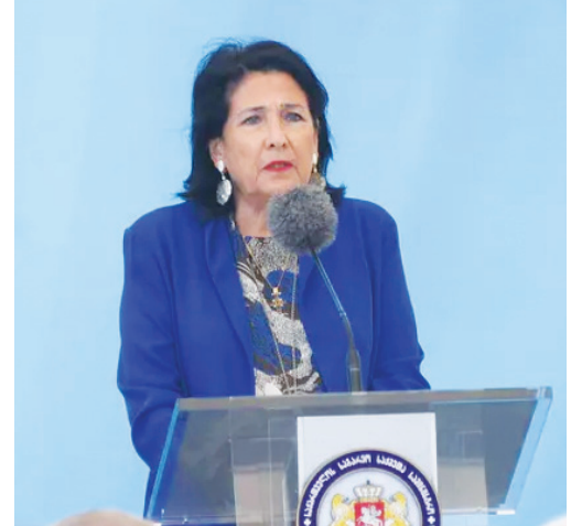
საქართველოს პრეზიდენტის განცხადებით, იმისთვის, რომ ქართულ დიასპორასა და ქვეყანას შორის არსებული კავშირი არ გაწყდეს, მნიშვნელოვანია, ორმაგი მოქალაქეობის მიღება კიდევ უფრო გამარტივდეს. „ამასთან, საჭიროა დიასპორის წარმომადგენლების ჩართულობა საქართველოს ყველდღიურ სახელმწიფო საქმეში, ანუ პოლიტიკაში. „ამას სჭირდება ის, რომ დიასპორას ჰყავდეს პარლამენტში თავისი ინტერესების წარმომადგენელი“, - განაცხადა სალომე ზურაბიშვილმა.

„სანამდე უნდა იყოს, რომ ჩვენ გვყავდეს მილიონზე მეტი ადამიანი უცხოეთში და არჩევნებში მონაწილეობდეს მხოლოდ რამდენიმე ათასი. დღეს არსებობს არჩევნებში მონაწილეობის მიღების ელექტრონული საშუალებები ჩვენს ქვეყანაში, ეს გამოცდადეთ ბოლო არჩევნებზე და ალბათ, დროა, გადავიდეთ მათ გამოყენებაზე, რომ უცხოეთში მყოფ ქართველებს არჩევნებში უშუალოდ მონაწილეობის საშუალება მიეცეთ“, - აღნიშნა ზურაბიშვილმა