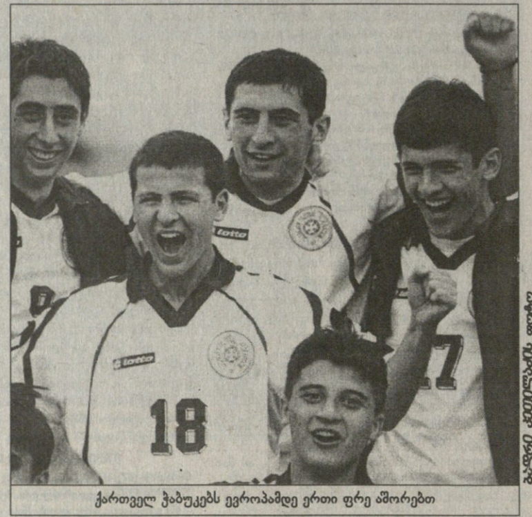
ქართველ ჭაბუკებს ევროპაში ერთი ფრე ამორებთ

გაულწევია ფინალურ ეტაპზე. მიუხედავად ეს რევანგის თემატიკისა, მდებარეობა მოახერხეს 1997 წელს. ორი წლის შემდეგ კი ვერცარე, რომელიმე ვილმა ათამაშა „მგრამეტწლამდელი“ ირლანდაში ევროპის მწვრთნელის ასე რომ, ბოლო ქართულებთან კლასიკური წელა გასული. ლოგიკურად გასამების ვერია... ვნახოთ ბაბა კვანტალიანი