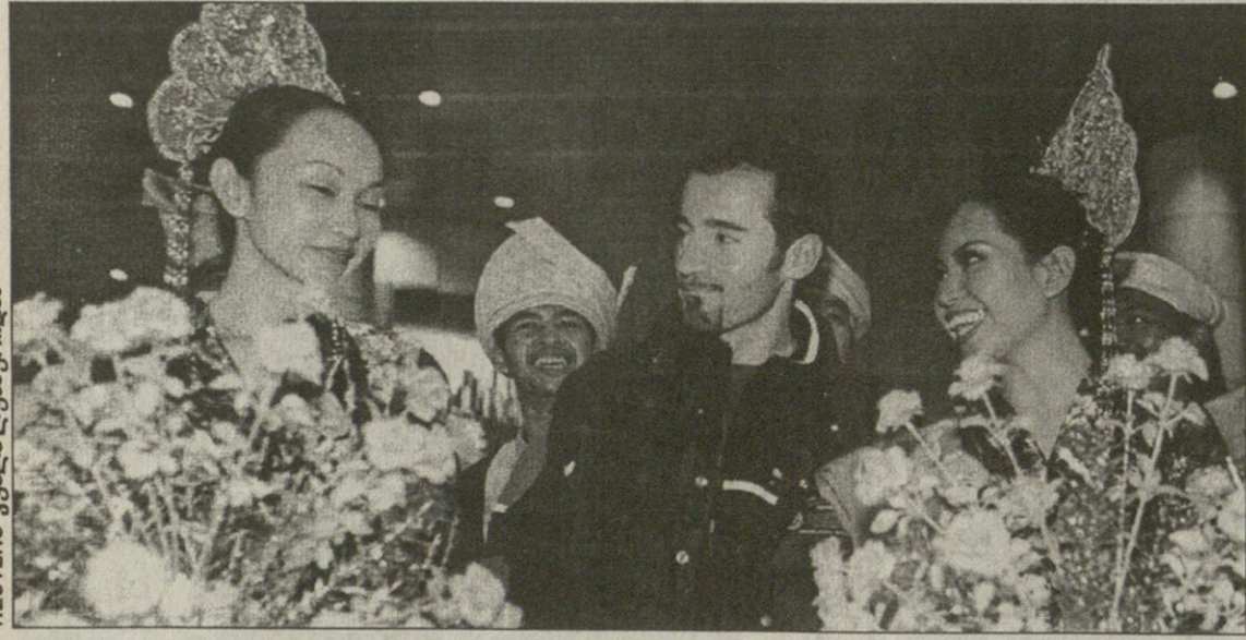
REUTERS კუალა ლუმპურიდან

კუალა ლუმპურის აერობორტი ქალაქიდან 90 კილომეტრშია და იტალიელ მოტომობილ მაქს ბიაჯისაც ეს ღამაზმანები იქ მიეგებნენ. ისე კი, იტალიელი მალაიზიაში ღამაზმანებისთვის არ ჩასულა, უფრო იმიტომ ჩაფრინდა, რომ იქაურ „გრან პრის“ შეეთამაშოს.