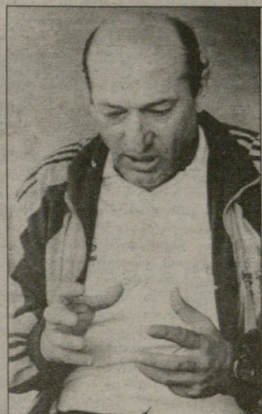
სოსო ფილიამ უარყო, რევაზ ძიჭუაშვილმა არაფერი თქვა...