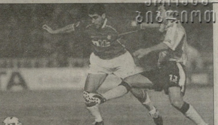
ლივინგსტონი — რეინჯერსი. გლზგოველი კლასილი რეინა (მარცხნივ) საუკეთესო იყო