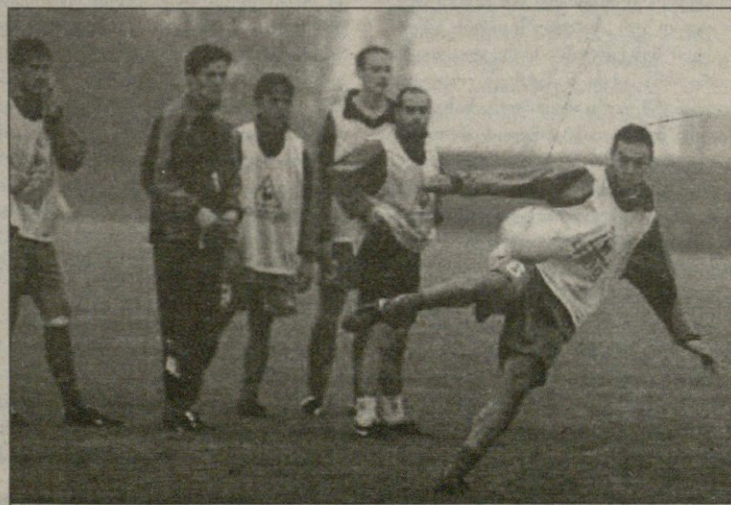
გუმის ნანტი: „ნანტი“ „ლაციოსთვის“ ემზადება