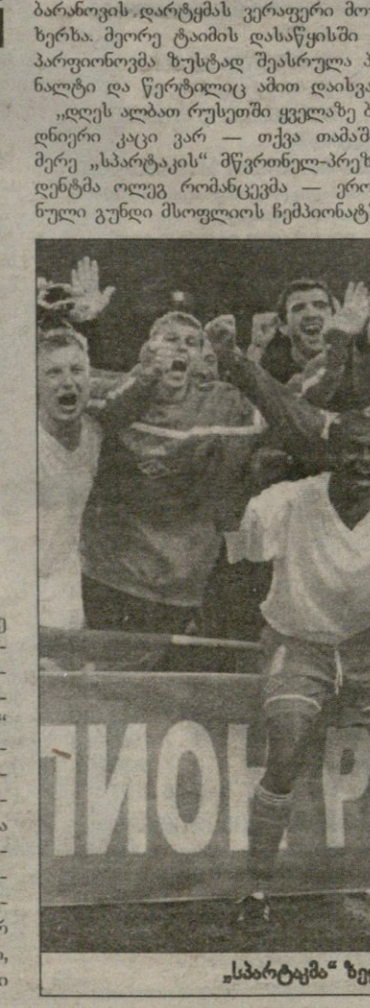
„სპარტაკმა“ ზედრედ შეექმნა გაიხარა