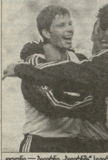
კილონი — ბაიერნი „ბაიერნი“ საგარეო ფორმითა და ჩვეულებრივ ფორმით...