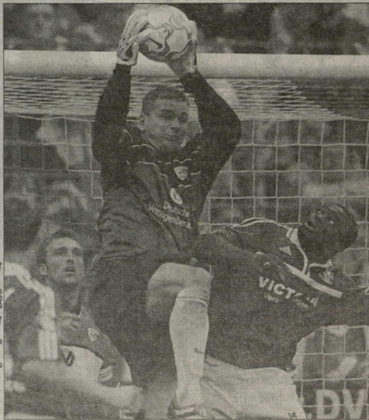
კაი ვერსლანდის გოლი — შალკე მასპინძელთა მეტყვე გეორგ კოსმა...