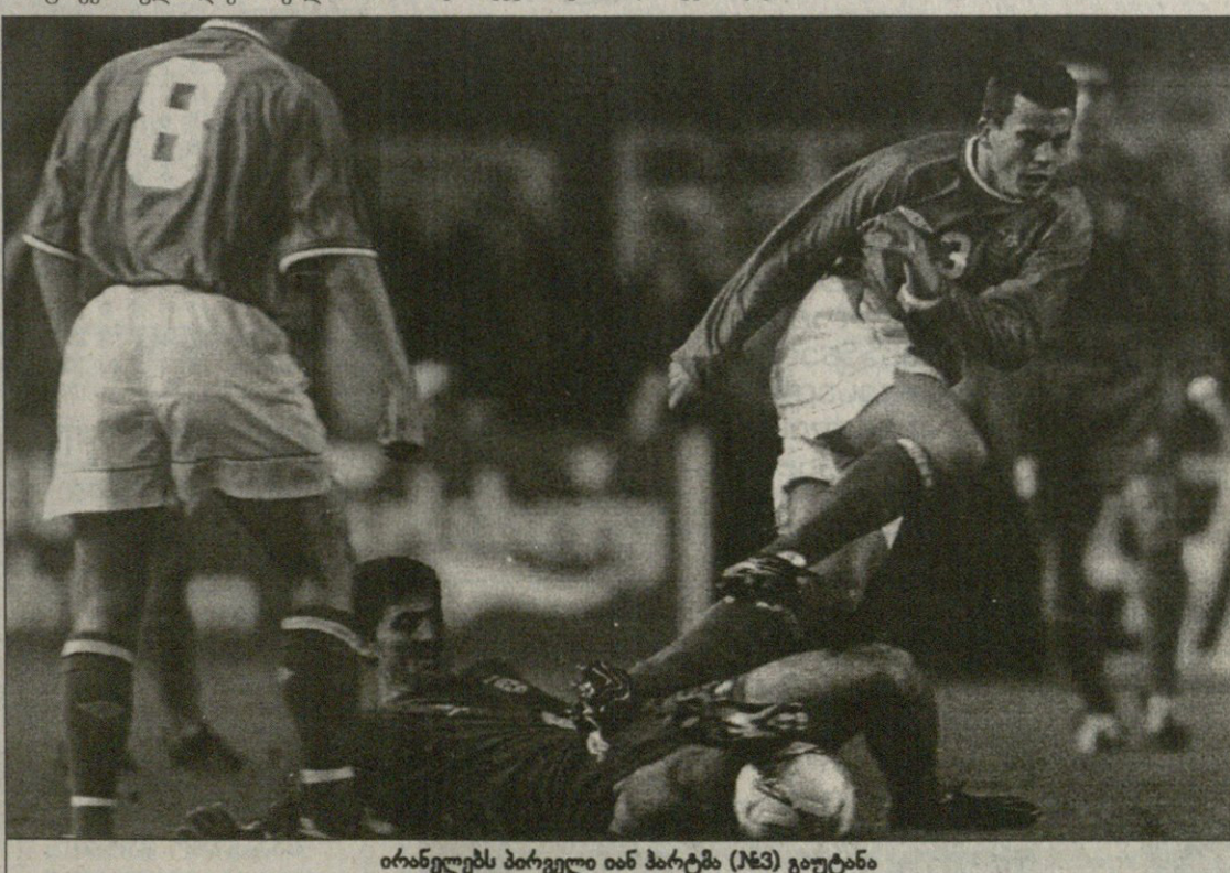
ირანელებს პირველი იან პარტი (№3) გაუტანა

მეორე გოლი კი შესვენების შემდეგ ექვს წუთში გავიდა. მაკატირის მიერ მარჯვნიდან, საჯარიმოდან ჩახუჭკუებული ბურთი მცველებმა მოიგერიეს, მაგრამ ის როზი კინმა მიიღო და ლონიერი დარტყმით ბადეში შეაგდო.