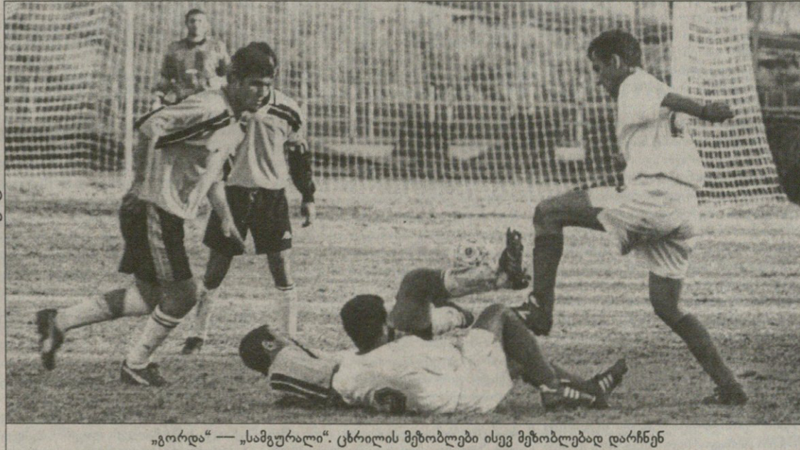
„გორდა“ — „სამგურალი“. ცხრილის მებოლები ისევ მებოლებად დარჩნენ