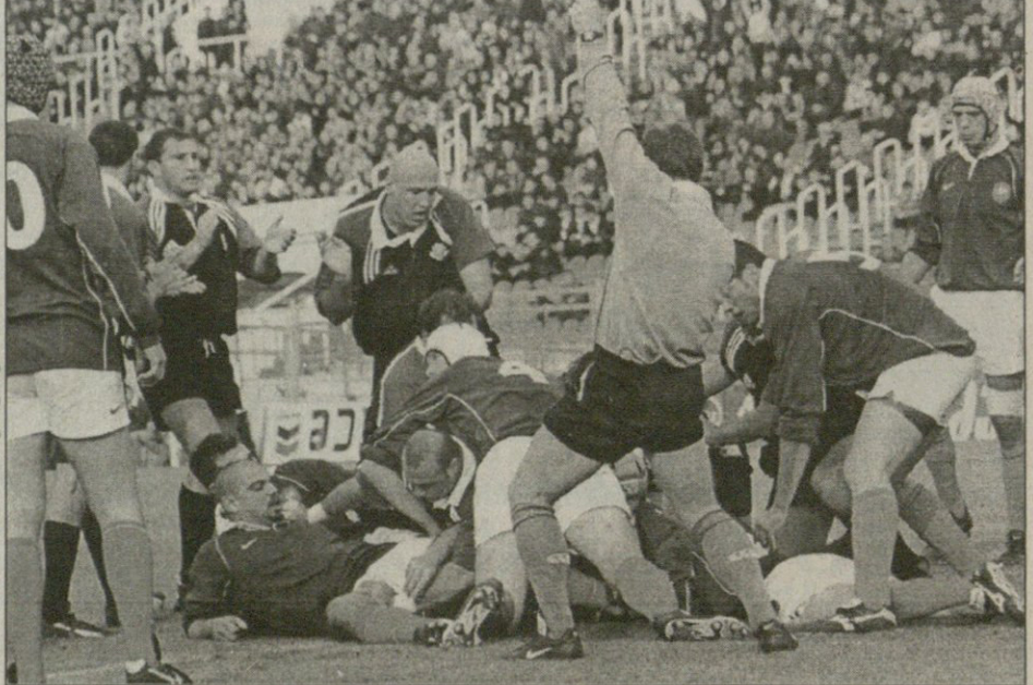
საქართველოს ნაკრების პირველი ლელო