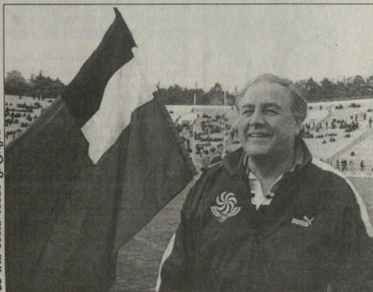
პაპინი კითხვებში ფოტოები