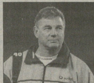
წლის მწვრთნელი როლ მაქკინი

ქართველებისთვის ყველაზე საინტერესო წლის საუკეთესო მწვრთნელის ნომინაცია გახლდათ, სადაც სამ სხვა კანდიდატთან ერთად საქართველოს ეროვნული ნაკრების ფრანგი თავაკაცი კლოდ სორელი იყო წარდგენილი.