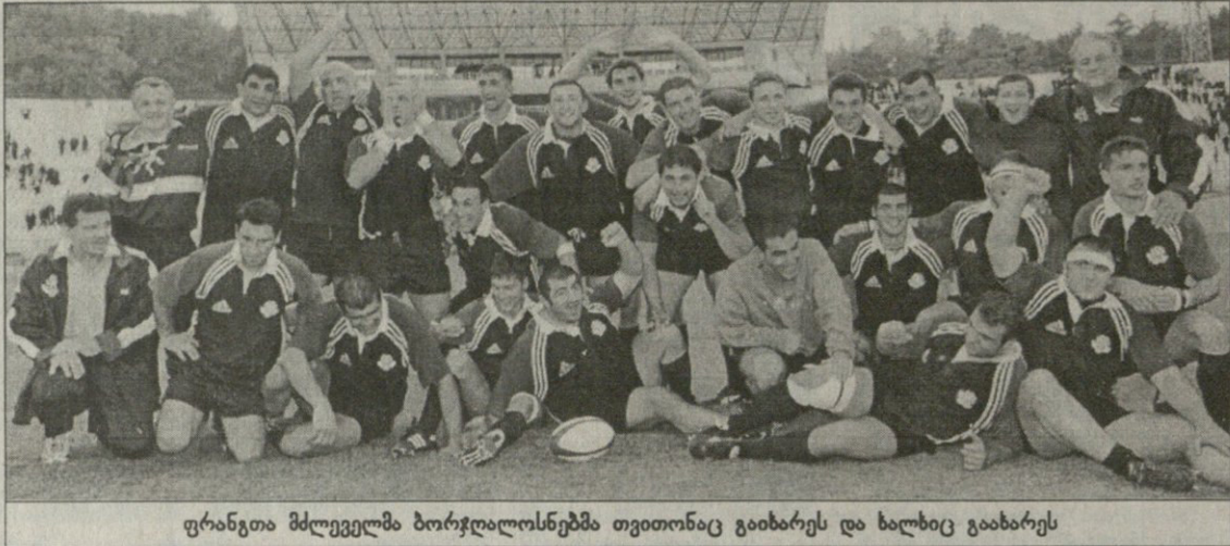
ფრანგთა მძღველმა ბორჯღალოსნებმა თვითონაც გიხიბრეს და ხალხიც გაახარეს