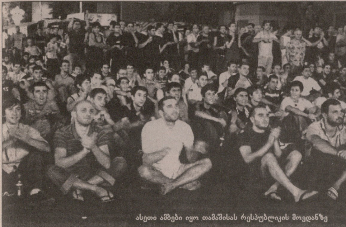
ასეთი ამბები იყო თამაშისას რესპუბლიკის მოედანზე