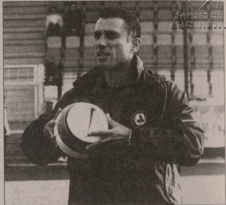
ეროვნული გუნდის მწვრთნელი