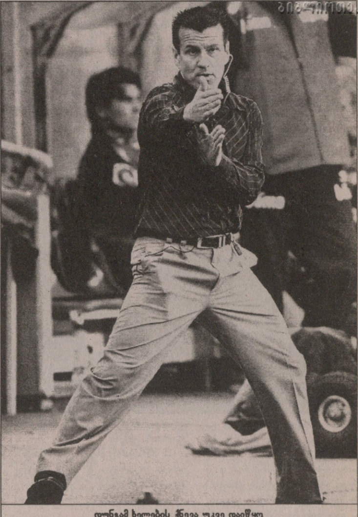
დუნგამ ხელების ქნევა უკვე დაიწყო