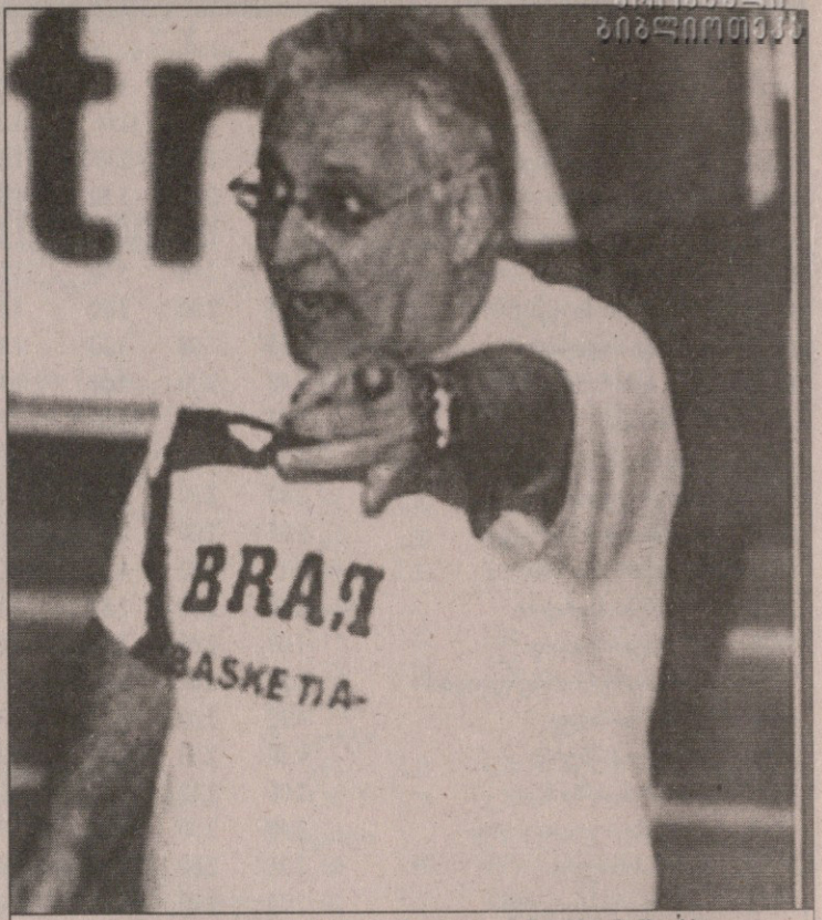
ალოიზიუ „ლულა“ ფერეირა ხელს ფინალისკენ იშვებს