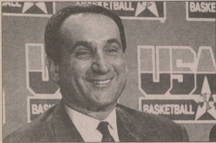
მაიკ კრეივესკი „ოცნების თორმეტეული“ დასახელდა

„ჩვენი გადასარეველი გავიარეთ მოსამზადებელი პერიოდი, ყველაფერი კარგადაა, ყველაზე ცუდი კი ის არის, რომ ამ ყველაფრის ბოლოს საქმე შემაღვინებდა სექსტრირებაზე მიღება და ვიღაცა გუნდს მიღმა რჩება“ — თქვა აშშ-ს ნაკრების მთავარმა მწვრთნელმა მაიკ კრეივესკიმ მას შემდეგ, რაც თავის 13-კაციან გუნდს ერთი გამოაკლო და მიიღო ის 12-ეული, რომელსაც იაპონიაში წაიყვანს კარგა ხნის წინ დაკარგული ოქროს საწმისის გამოსაბრძოლველად. ის ერთი უიღბლო სექსტრირებული, მოლოდინისამებრ, „სან ანტონიო სპურზის“ 201-სანტიმეტრიანი მსუბუქი ფორვარდი ბრიუს ბოუნი გამოდგა, კაცი, რომლის