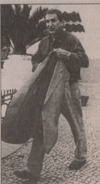
არაბთა გაერთიანებული ემირატები.

„სარბილის“ მკითხველმა კარგად უწყის, რომ პარეირასთვის უცხოეთში მუშაობა სიახლე არ არის. წლების მანძილზე მას გაუწვრთნია განა, ქუვეთი, საუდის არაბეთი და