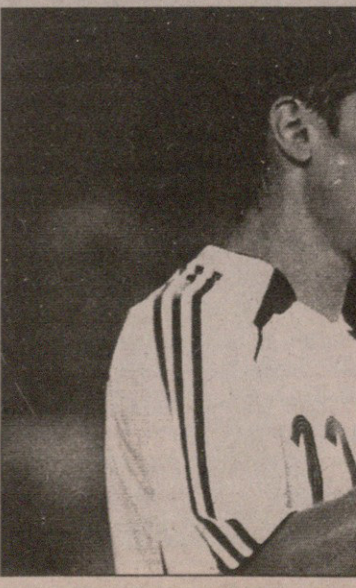
AFP გულ შეყვარებულნი

დრმა გახსნა ანგარიში და ეს მისთვის მერვე სანაკრებო გოლი გამოდგა. ამას მოჰყვა მუნდიალის საუკე- თესო ბომბარდირისა და გერმანი- ის წლის საუკეთესო ფეხბურთე- ლის, მიროსლავ კლოზეს გოლი. შედეგები დაიბნენ, დაახლოებით მსგავსი რამ მოხდა მსოფლიოს ჩე-