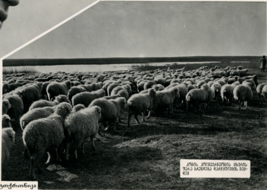
ქობის კოლმეურნეობის მხარის უაქა მდებარე მსახურების მუშა- რები

ხანჯარა ბერიანი მოვა ხნის წინათ უღოვანი მსახურობა, სპეციალური, ახლა კი მუშაობის ქართის ნათლად ნაბარი მოიხსნა და ვახსნს ენავე ველით, იმავს მშობლიური ყაზბაგის ჩაიონის სოფელ ქობის კოლმეურნეობის მხარის უაქას.