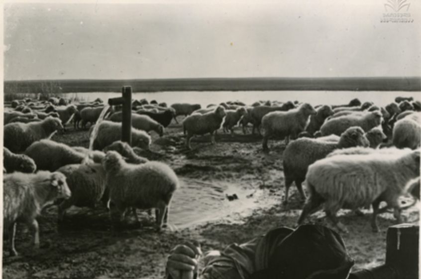
მსხლის შავი ლაჩვილიანი რაზმს.

იყო რამ, რომა ყიზღაიის ვაღაბი წყალს წვეთ-წვეთო- ბით უჭრთხილდაპოღნან, ათა- ჯილი ჯიღოშავისი მანძილიდან მოქაქონდათ. ახლა ვაღი მღი- რაიანა წყლით. 192 აკვანოილი ჭა გაუგაგაღს ქაქთვალდა გეოლოგებმა მისხვაკავას.