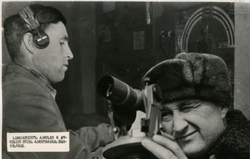
საბრძანებლო კარიბსი მ. ბრ- ცხვარი ირანს კარბონატის მარ- ცხვარს.

პრობირისა და საბრძანებლო სა- ბრძანებლო ინჟინერი ა. კახიანი დაკონსტრუქციის შტაბს, არსებობს სა- ბრძანებლო საბრძანებლო საბრძანებ- ლო მუშაობის.