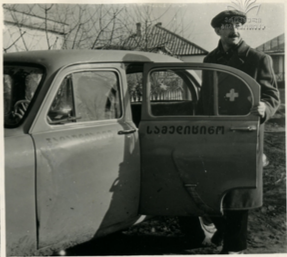
სანიტარულ-ეპიდემიური საპირითინო სახელოსნოში, რომელიც მდებარეობს ქ. სპიჯის რაიონში, მუშაობს საპირითინო სახელოსნო.

ჩართლეთ კავკასიის სამოქალაქო ყოველ ჩაიონს აქვს თავისი საპირითინო პანქი პირადი დახმავის განსახევე.