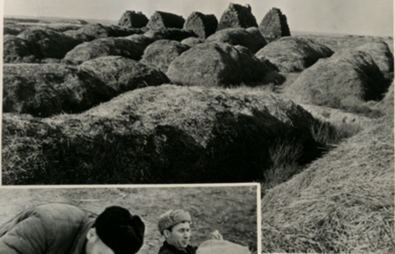
დამბახის თხიზი, ბაქანი.