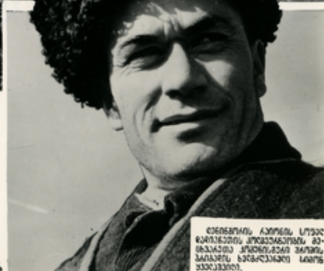
მინორის აბოონი, სწეა დაიქიანთი კოქანაქონის ბი- მბაკათ კრეილიანი მირიონი, პაიანს სხვარაქილი სიონ პაქანთი.

გაზაღ ახალ ქილომეტრზეა გარეუბნული უპირებამო ველზე. განაწყვე- ვლივ ქალის კასიის ზღვის მხარის სუსხიანი ქაჩი, მღაჟოგში აწვანს ნამისსვია აზხინდა, ვატიწვანს გაყვითლბულ გუჩქანს. თაჟიანთი 330 ათასი კაქანაი მიწა ქობარ დათმანს ქაჩთველ მამსვარაქანს დაღსწნელ- მა მამოგრაგმა ჩადილეთ კავკასიაში. აქ საქართველოს მზილი ჩაირონის ნახვარაი მირიონი მხვარაი და ათი ათასი სული მსხვილწეხა აქიანი ჰი- კაჟყვი. დღისით და ღამით, ყოველგვარ ამინდოი ითავეს საქორბეაჩემო ქონებანს მამათი აღაქიანები—ქაჩთვილი მყეჟსაქი.