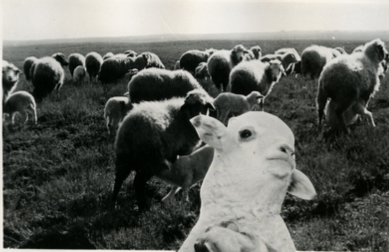
ნაკვები და გარეული საძირკ- ვა.

დღის დიდი მნიშვნელობაა. ვაჩი- რია მწყემსთა სსრკ-ის მიერ ეს ნაკვები მუშაობის ნაშთი— სათქმის ზანავეს თითოეული მუშა- კა. მსოფლიო დღის ვაჩი- რის საძირკვარზე ჩამოვიდა კო- მუნისტა მუშაობის გიგანტი მწყემსთა დასახელებად.