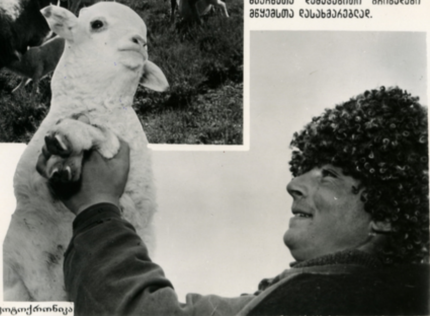
კომუნისტა მუშაობის დღის მუშაობის მუშაობის გიგანტი