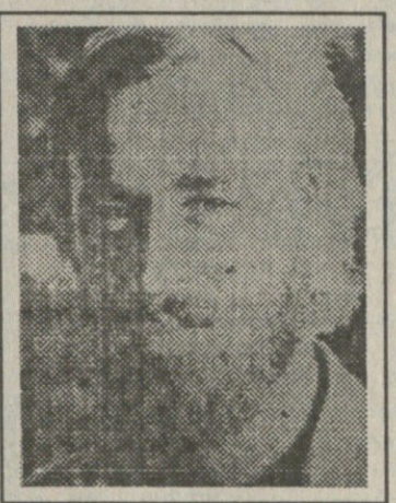
კენ უბიძგებდა შეიღს თავისი პასიური პოზიციით.

გაოცვებს იწვევს გ.კობახიძის დედის, როგორც მშობლის, გულგრილობა. მას არ შეიძლება არ შეენიშნა სვასტიკებით მოსატყული თავისი ბინა, ტყვიით დაცხრილული კედლები. მაგრამ ვაი რომ დროზე არ ატეხა განგაში, ვერ შეიგნო, რა უფსკრულისაკენ, მორალური დეგრადაციისა-