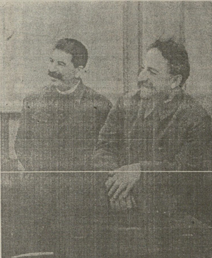
1921 წლის 25 თებერვლის შეხვედრა

ზრდებთან მეცადინეობა დაეწყო დაქირავებულ შენობაში“ (ს. 276, ფ. 4). ცხადია, რუსი სამღვდნეობა მარტო თავისი თავის იმედად არ იყო, მას ზურგს უმაგრებდა რუსეთის ეკლესია და მისი უწმინდესი სინოდი. სმურახოვსკი წერდა: „თბილისის სასულიერო სემინარიის კორპორაციის რუსული ნაწილის ამაგარი მოქმედება სანქცირებული იყო უწმინდესი სინოდის მიერ, რომელმაც 1917 წლის 15 ნოემბრის №9660 ბრძანებულებით თბილისის სასულიერო სემინარია გადააკეთა კავკასიის მართლმადიდებელთა რუსულ სასულიერო სემინარიად“ (ს. 276, ფ. 4). უწმინდესი სინოდის 1917 წლის 15 ნოემბრის №9747 ბრძანებულებით თბილისის სასულიერო სასწავლებლების (სემინარია და სასწავლებელი) კრედიტი გადაეცა რუსულ სასულიერო სემინარიას. მასვე უნდა გადასცემოდა ყოფილი საქართველოს ეგზარქატის გორის, თელავის, ქუთაისის, ოზურგეთისა და სამეგრელოს სასულიერო სასწავლებლების შენახვისათვის განკუთვნილი ხარჯები, რადგან ეს სასწავლებლებიც საქართველოს ეკლესიის გამგებლობაში გადავიდა. ბრძანებულებაში საგანგებოდ იყო აღნიშნული, რომ თბილისის სასულიერო სემინარიის, ასევე სხვა სასულიერო სასწავლებლების შენობები რუსეთის ეკლესიის უწმინდესი სინოდის საკუთრება იყო (ს. 276, ფ. 4). ვეკლესიისათვის ცხადი იყო, რომ რუსეთის ეკლესია საქართველოში პოზიციებს ვეღარ აღიდგენდა და ამდენად უწმინდესი სინოდის ორივე ბრძანებულება მხოლოდ ამწვევებდა კონფლიქტს. რუსეთის ეკლესიის უწმინდესმა სინოდმა კავკასიის მართლმადიდებელთა რუსული სასულიერო სემინარიის დაფინანსება ვეღარ შეძლო, რის გამოც სემინარია დახურვის აუცილებლობის წინაშე აღმოჩნდა. სემინარიის შესანახი თანხა არც ამიერკავკასიის რუსთა ეროვნულ საბჭოს აღმოაჩნდა, თუმცა სმურ-