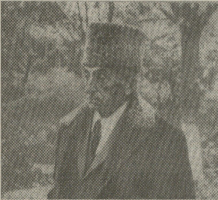
დაიწყოთ თუნდაც მწერლობის რაობის განსახლვით.

მწვავე, თანადროული იდეები „დიდოსტატის მარჯვენაში“ დაკვირვებული თვალისათვის ძნელი ამოსაკითხი არ არის.