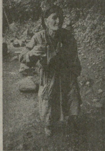
მლის შემკეთებელი, ბიბლიოთეკა, სამლოცველო, დასასვენებელი კეთილმოწყობილი ოთახი ახლახან 20-მდე უპატრონო, უმწეო, ფიზიკურად დაუძლეველ, რომელთაც მომვლელი არა ჰყავთ, ამ სახლში დაეთმოთ ყველაზე დიდი ოთახი, სადაც სათნობის დები დიდი გულმოდგინებით იზრუნებენ მათზე გვაგვს

საბუნების სახლს, რომელიც უმწეო ხანდაზმულთა თავშესაფრად იქცა, მუშტრის თვალი დაადგა მრავალმა ორგანიზაციამ. ზოგი მის უცებს ცოტა ჩაჩოჩებდას და თითო სართულს სთხოვს, ზოგი კი მთლიანად უპირებს გამოსახლებას. მაგალითად, საქართველოს კომპარტიამ პრეტენზია განაცხადა თავის ყოფილ ქონებაზე, ამ სახლში ადრე რაიკომი ყოფილა და ამდენად მისი კანონიერი მფლობელებიც ჩვენ ვართო. კომპარტია საერთოდ ყველაფერზე აცხადებს პრეტენზიას, რაც ადრე მათ ეკუთვნოდათ. ასე რომ გავყვეთ საქმეს, მთელი საქართველოს უძრავ-მოძრავ ქონებაზე მონარქისტებს შეუძლიათ უპირველესად ყადაღის დადება, რადგან უფრო ადრე ყველაფერი მონარქისა იყო... ეს ხუმრობაგაშვებით, ახლა კი ხანდაზმულთა წერილს გაეცანით.