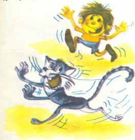
მხატვარი ზისო ხილაშვილი

— დიხაც რომ ის ჯაჭვის პერანგს ხევდა, შენ კი რა გავიხდა ეს ერთი ჭიქა ჩაი? — ზღვას ხერებდა, ჯაჭვის პერანგს ხევდა, მაგრამ არა მგონია, რომ პატარა კახს ცხელი ჩაით პირი გამოეთუთქა! — უპასუხა თორნიკემ და საუზმე გააგრძელა.