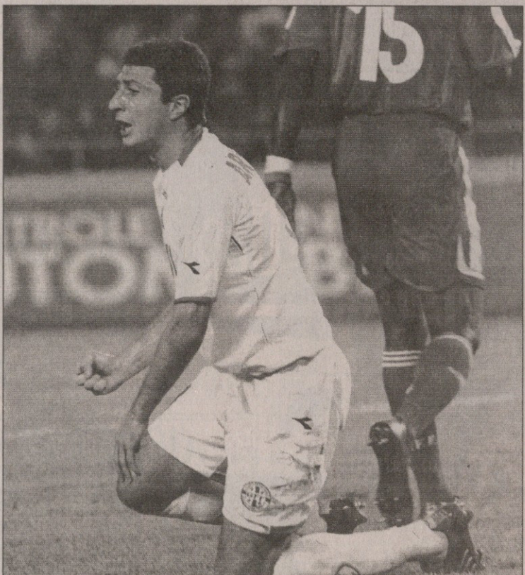
და მითხრა, სიტუაცია უფრო საგანგაშო მეგონაო. ვნახოთ, თუ ყველაფერი კარგად იქნა, სულ მცირე, ოთხი-ხუთი დღე მაინც დამჭირდება, სრული დატვირთვით რომ ვივარჯიშო — ჯერჯერობით ასეთ დღეში ვარ...

— შენი იტალიასთან თამაშის შანსი რამდენია? — 20 პროცენტით. მუხლს ბოლომდე ვერ ვშლი, რაც ხელს უშლის შეშუპებული სახსრიდან სითხის გაწოვას. — კლავს ტომოლოგრაფიულ ელასტიკას? — მას დღეს ვესაუბრე ტელეფონით და ტომოლოგრაფიული ელასტიკის გამოყენებასთან დაკავშირებით იტალიასთან თამაშის შანსებზე. — მოკლედ, დიდი იმედი არ გაქვს, რომ იტალიასთან ითამაშებ? — „აიაქის“ ექიმთანაც მივედი, ის ჩემს მუხლს კარგად „იცნობს“