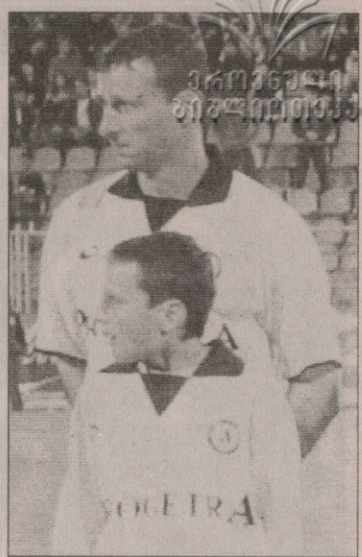
გადარი კაბინეტის ფოტო