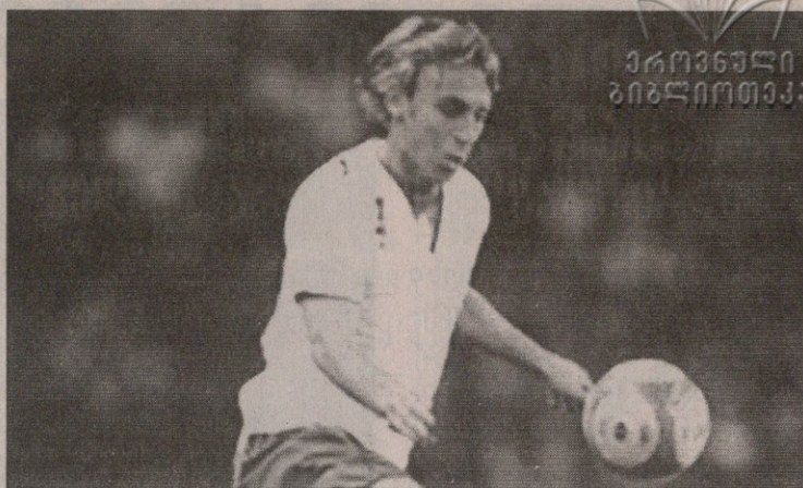
დანიელ დე როსი