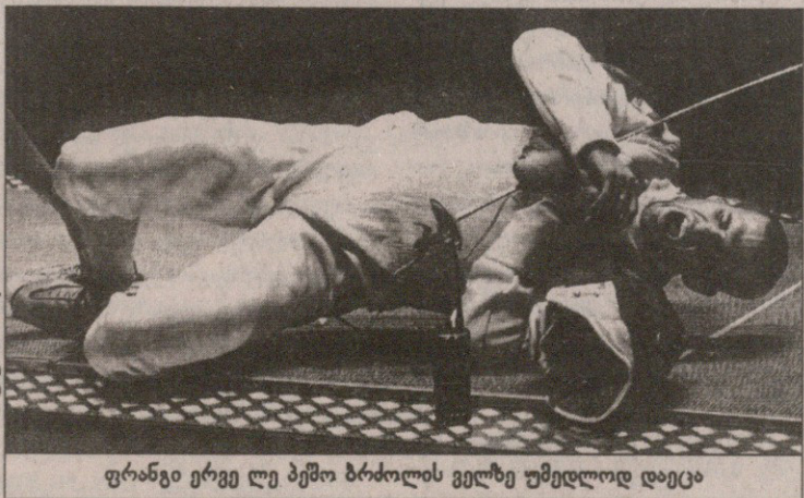
ფრანგი ერვე ლე ბეჟო ბრძოლის ველზე უმედლოდ დაეცა