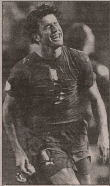
ფაბიო გროსო თბილისში ვერ ჩამოვა