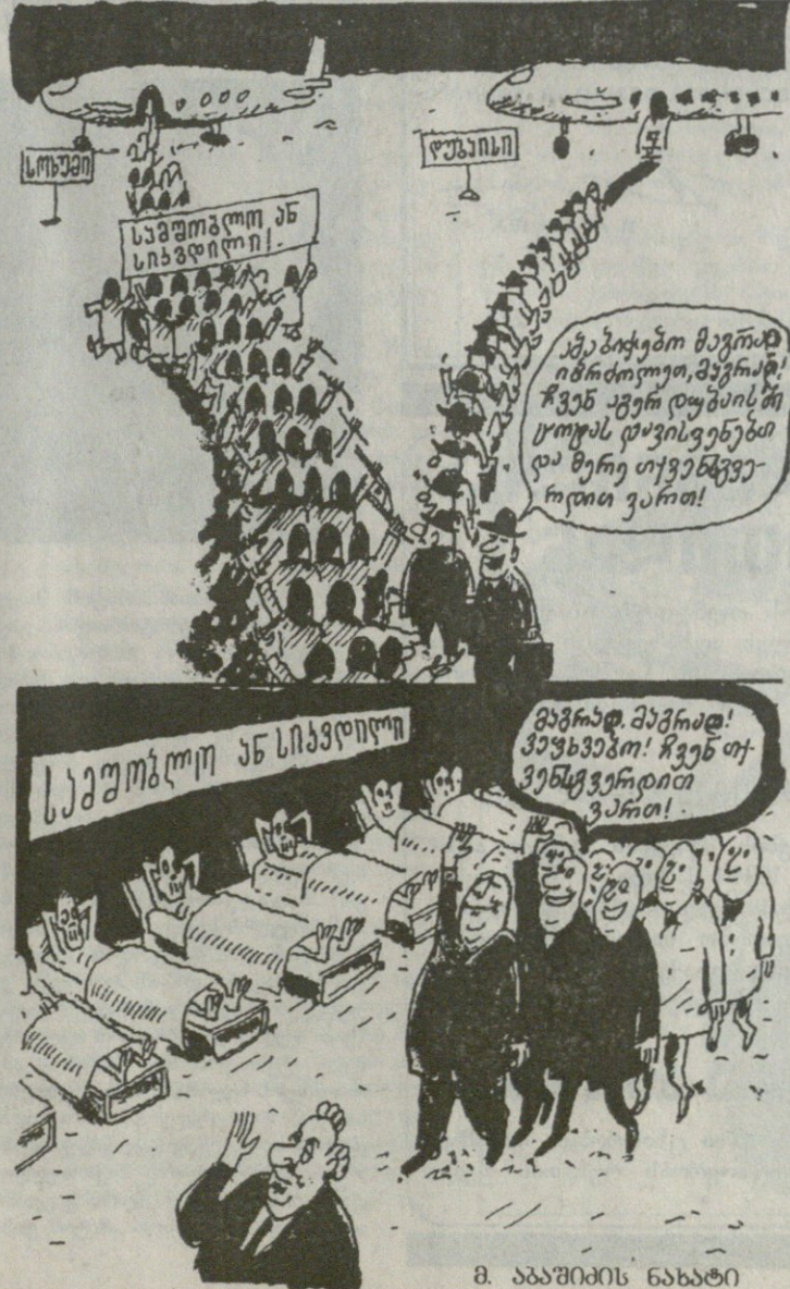
მ. აბაშიძის ნახატი

21 მარტს აღინიშნება ძაბთული ქუჩნალისცივის დღე. გილტცაუთ, ძვირთასდ კთლეგებთ!