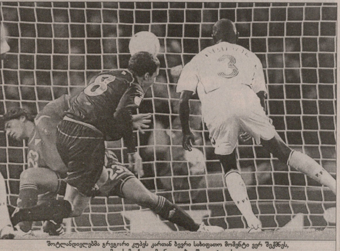
შოტლანდიელებმა გრეგორი კუმეს კართან ბევრი სახიფათო მომენტი ვერ შექმნეს, თუმცა სამი ქულა მაინც გლახგოში დაიტოვეს