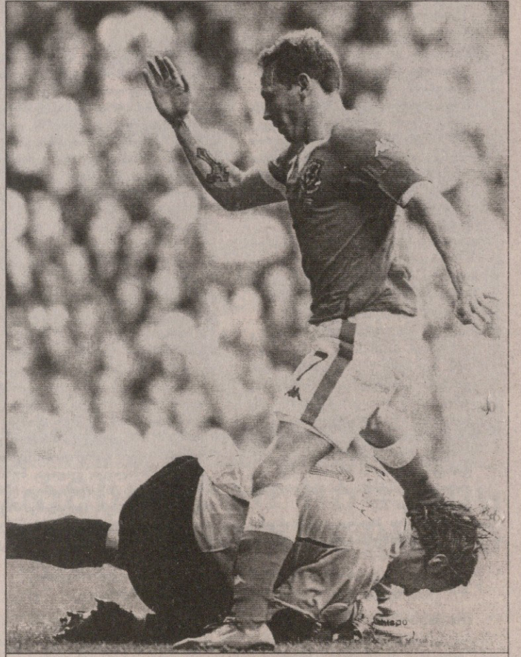
ჩონტოვალსკიმ ბელამი არ გაატარა

მე-14 წუთზე გახსნეს, თავი დუშან სვენტომ გამოიჩინა. კარდიფში მასპინძლებს ტრავმის გამო ნაკრების ლიდერი რაიან გიგზი ვერ დაეხმარა. რობერტ ერნსოუმ და საიმონ დევისმა ანგარიშის გათანაბრების ხელსაყრელი შანსები გაანიავეს. შემდეგ კი იუბილარმა ჯონსმა ბავშვური შეცდომა დაუშვა და მეორე გოლიც მიიღო. მეკარემ თავისი საჯარიმოდან გამოირბინა, თითქოს მდგომარეობაც განმუხტა, მაგრამ მისგან მოგერიებული ბურთი, იუბილზე მეორე საჩუქრის ავტორ მარეკ მინტალს ერგო... ხუთი წუთის შემდეგ მასპინძლებმა ერთი გოლის გატანა შეძლეს — ფანობა 17 წლის გარეთ ბელიმა გაანარა. თუმცა დროებით, მალე მარეკ მინტალმა დაუბლი შეასრულა. შესვენებამდე მცირე ხნით ადრე კაპიტანმა კრეიგ ბელამიმ მიზანში ვერ მოახვედრა. ტაიმთაშორისის შემდეგ კი კოზაკის მოწოდებული კუთხური მიროსლავ კარხანმა გოლად აქცია. მეხუთე, დამავიწყებელი გოლი კი ვიტეკის ანგარიშზეა. რობერტ ვიტეკმა სვენტოს კარგი პასით ისარგებლა. ოთხშაბათს სლავთაგან ნათრევი უელსი გულშემატკივართა წინაშე