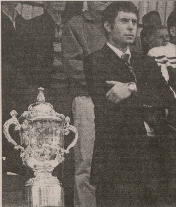
რუმინელებმა მატჩზე ვებ ელისის თასიც კი „დაპატიყეს“