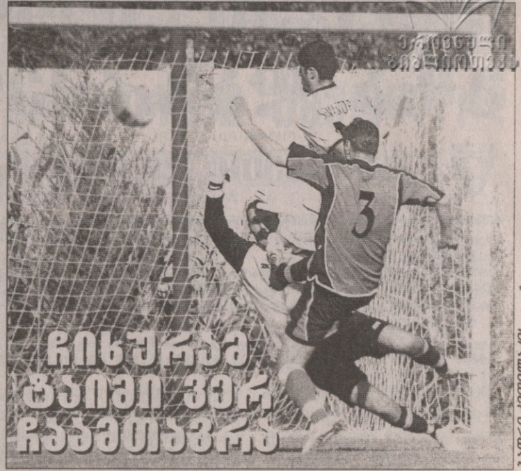
რისკიანი ტაიმი ჰმრ ჩაბმთაბრო

სამკვირიანი შესვენება „ამერიკა“ და „ჩინურა“ ამხანაგური მატჩისთვის გამოიყენეს და გუშინწინ საგურამოში, „ამერის“ ბაზაზე შეხვდნენ ერთმანეთს. აქვე ვთქვათ, რომ ბაზის მშენებლობის დასრულებას ჯერაც ბევრი უკლია, თუმცა ერთი მოედანი ისეთ მდგომარეობაშია, კაცი წუნს ვერ უპოვის.