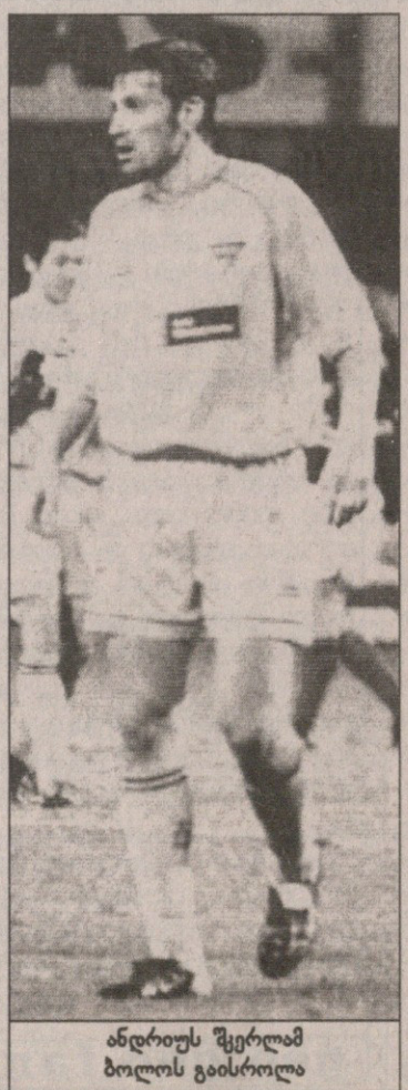
ანდრიუს შვერლამ ბოლოს გაისროლა