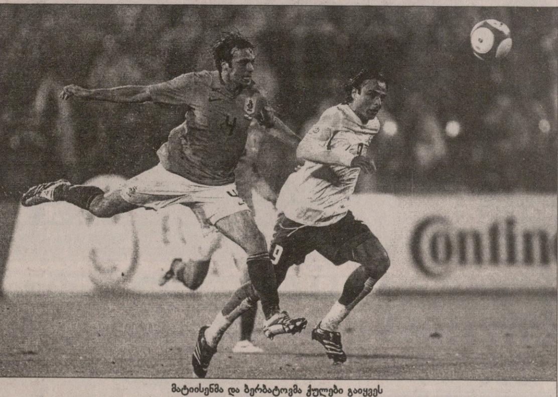
მატიისენმა და ბერბატოვმა ქულები გაიყვეს