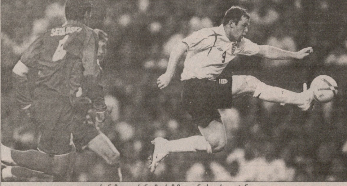
რუნემ კი იფრინა, მაგრამ მაკედონიას ვერ გაუტანა

რუსეთი 1:1 ისრაელი 1:0 არშავინი (5), 1:1 ბენ შუზანი (84) რუსეთი: აკინფევი, ა. ბერეზუცკი, იგნაშევი, ვ. ბერეზუცკი, ანიუკოვი, ჟირკოვი (სემშოვი 77), სმერტინი, ალდონინი, ბილიალფედინოვი (კრეგოვი 30), არშავინი, პოგრეზნიაკი (იზმაილოვი 57) ისრაელი: ავატი, ბენ შაიმი, გერმანი (ბენ იოსეფი 46), კვისი, საბანი (ბენ შუზანი 46), აფევი, ალბერმანი, ბადირი, ბენაიუნ (ტამუზი 75), ტალი, კოლაუტი გაფრთხილება: პოგრეზნიაკი, საბანი, კრეგოვი, ბენ შუზანი, სემშოვი მსაჯე: ფლორიან მეიერი (გერმანია) 22 000 მაყურებელი