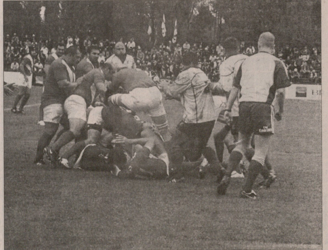
იშვიათი ეპიზოდი: ქართველებმა რუმინელებს გადაუარეს