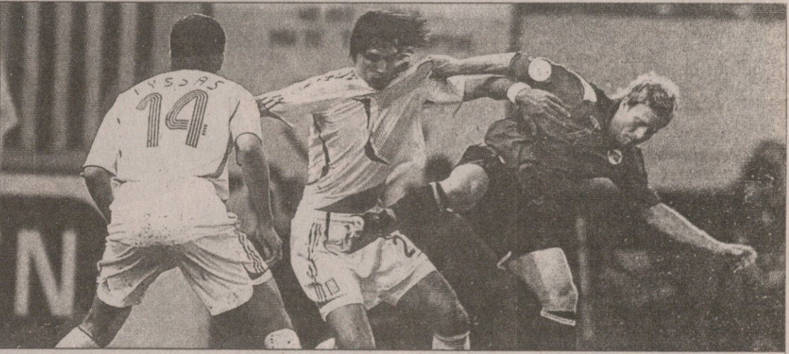
ფისასი სამარასისა და იფერსენის ჭიდაობას უყურებს

პირველი დასამახსოვრებელი მომენტი იურკას სეიტარიდისის დარტყმა გახლდათ, ბურთი ოდნავ აცდა მიზანს. შემდეგ იყო და საკ-