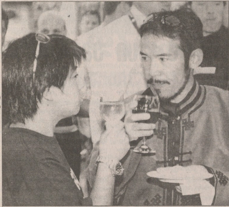
სუ ტეტ სეიმ და რო იაომ „ოქროს საწმისი“ თეთრი ღვინით დასველეს და შავითაც