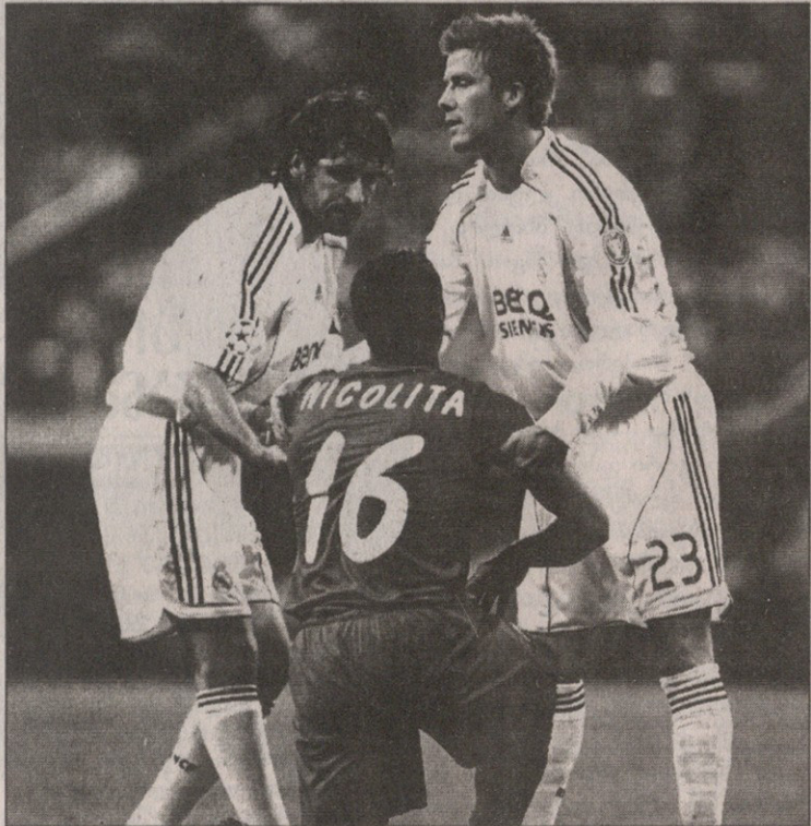
თანაგრობა: ეს ესაა, ბანელ ნიკოლიტამ ბურთი საკუთარ კარში ჩაჭრა

ლიონი 1:0 დინამო 1:0 ბენზემა (14) ლიონი: კუბუ კლერკი, სვილანი, კრისი, აბიდალი, ტიაგუ, ტულუზანი, ფუნინიო (კალსტრიომი 79), გოფუ (ა. დიარა 88), ბენზემა (ვილტორდი 75), მალუდა მწვრთნელი: ფერარ ულიე