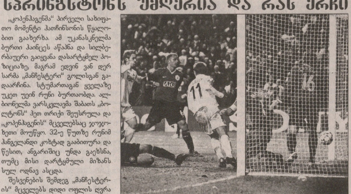
მარკუს ოლბოკმა (№11) ისტორიული გოლი შეაგდო

კოპენჰაგენი 1:0 მანჩესტერი 1:0 ოლბოკი (73) კოპენჰაგენი: კრისტიანსენი, იაკობსენი, პანგელანდი, გრაგგარდი, ვენდტი, სილბერბაუერი (კვისტი 71), ლინდეროტი, ნორეგარდი, ბერგვოლდი (ბერგლუნდი 68), ოლბოკი (თომასენი 89), შათინსონი მწვრთნელი: სტალე სოლბაკენი მანჩესტერი: ვან დერ სარი, ბრაუნ, ვიდიჩი (ფერდინანდი 46), სილვესტრი, ჰაინცე (ევრა 80), ფლეტჩერი (სქოულზი 71), პარიკი, ოში, რონალდუ, რუნი, სოლსკიერი მწვრთნელი: ალექს ფერგიუსონი გაფრთხილება: პანგელანდი, რონალდუ მსაჯი: ვოლფგანგ შტარკი (გერმანია) 40 308 მაყურებელი