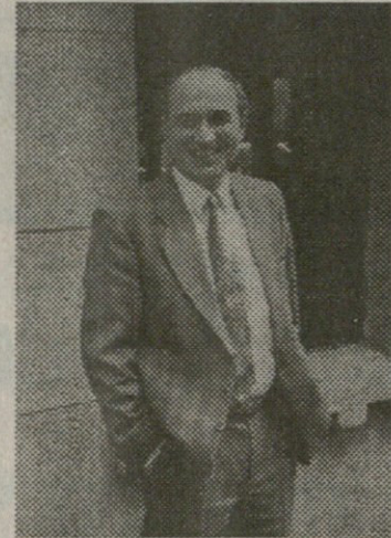
გარეშე იქნა განურებული. იქ მსხლმ ოთხ პიროვნებას აეტომბატის ზემოქმედებით ართმევენ ფულს თავდასხმელები აგრძელებენ ვახს და შემდეგ გადავდებთან წინასწარ განსაზღვრულ ადგილზე დაყენებულ სხვა მანქანაში.

ყველა გასროლა მოხდა მიზანში არც ერთი ტყვეა არ არის მიზანს აცდენილი. ყველა საბურავშია არც დისკი, არც ფრთა ტყვეას არ გაუკაწრავს, აქედან გამოჩნდა, რომ საქმე გვექონდა პროფესიონალებთან. მანქანა ყოველგვარი ხმაურის