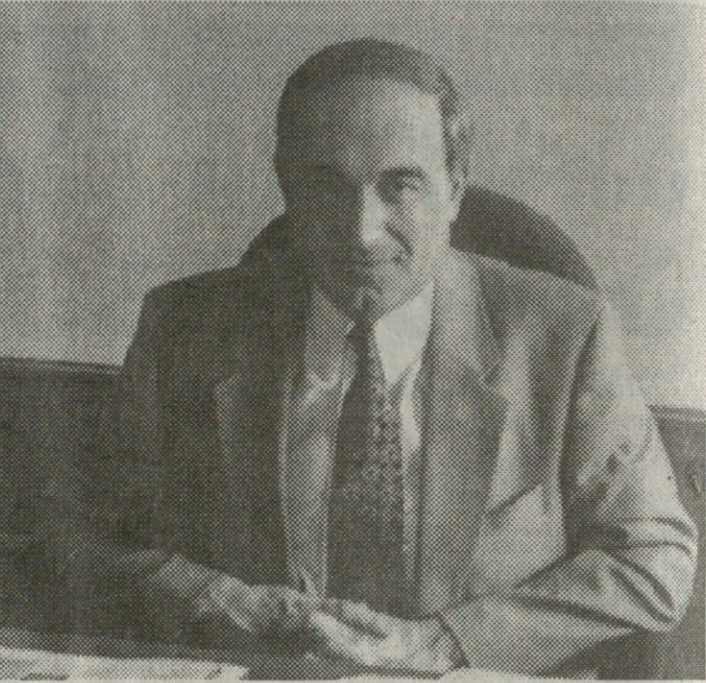
მერებზე გადაღებული რამდენიმე ჩვენება მაჩვენებ?

ნ.გ. - შეგიძლიათ ვიდუკავებოთ იწერ და ამ დროს კაცს ტანჯვა და აწამებ. სეათაშორის, არ დაემალა იმასაც, რომ ბევრი მათგანი ოპერატიული გზითაც არის გადაღებული.